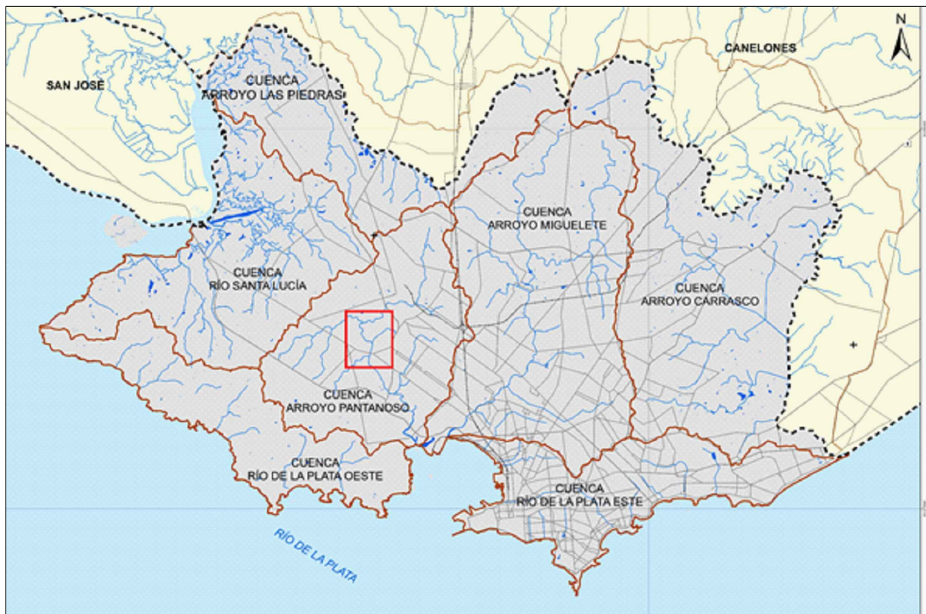
PLANO DE UBICACIÓN