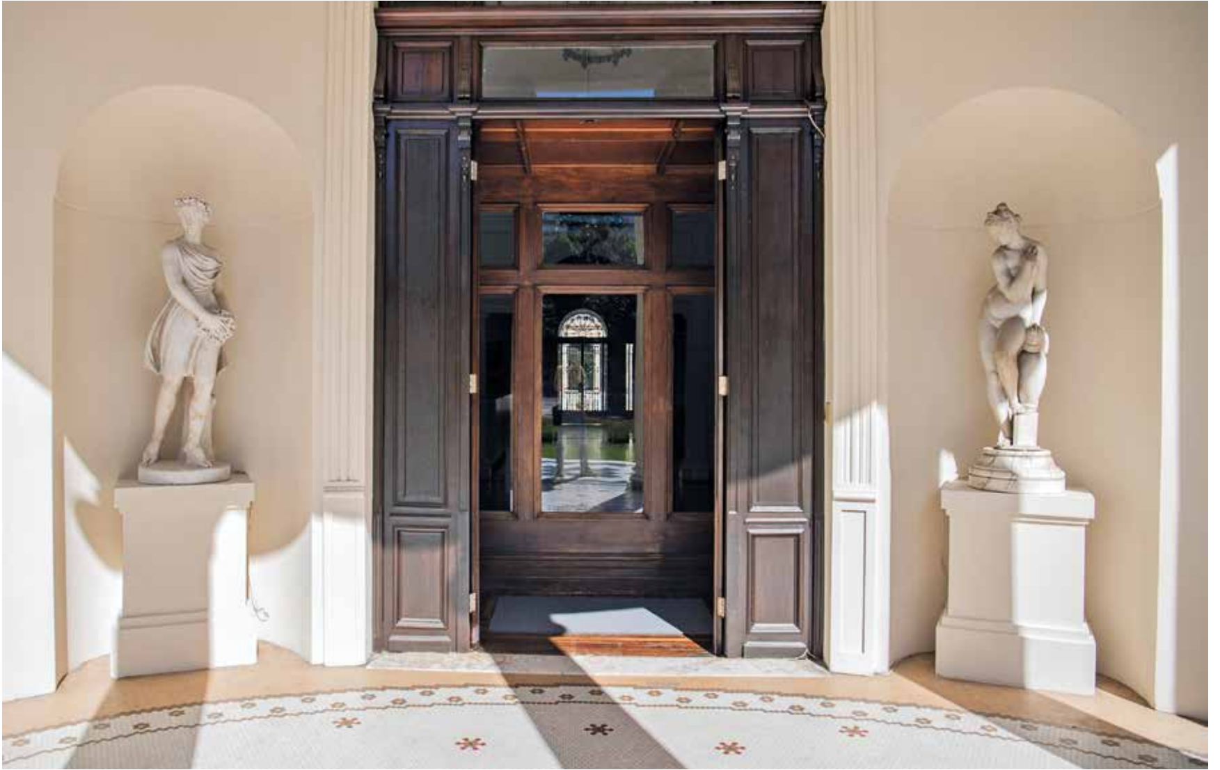
Restauración del Museo Juan Manuel Blanes.