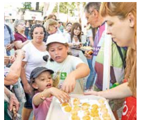
Cocina Uruguay en la Semana Criolla 2024. Marzo, 2024.

La llegada de un nuevo mes trajo consigo la renovación del cronograma de actividades de Cocina Uruguay, el programa de educación alimentaria de la Intendencia de Montevideo que fomenta la alimentación y los hábitos saludables para mejorar la calidad de vida de las personas. Con esa constante búsqueda, ofrece en los barrios cursos y talleres gratuitos.