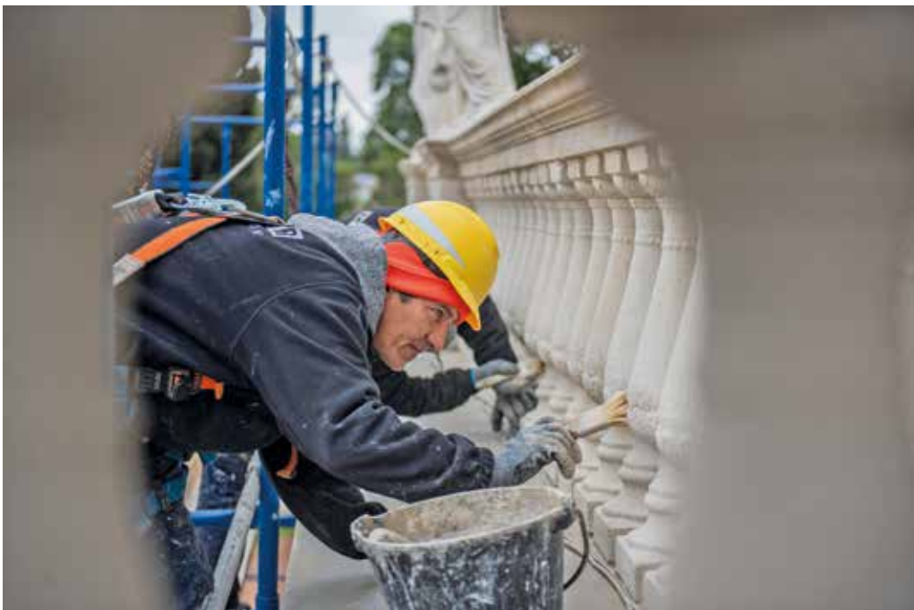
Restauración del Museo Juan Manuel Blanes.