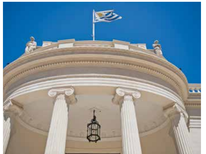
Restauración del Museo Juan Manuel Blanes.