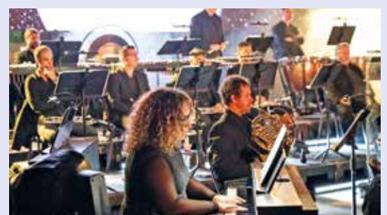
Concierto de la Banda Sinfónica de Montevideo en el Espacio Modelo. Marzo, 2024.