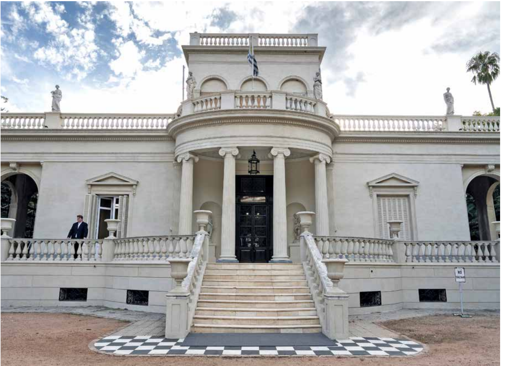
Restauración del Museo Juan Manuel Blanes.

El edificio, que desde hace casi cinco décadas es Monumento Histórico Nacional, tuvo trabajos de restauración en el acceso central, la fachada principal y las terrazas.