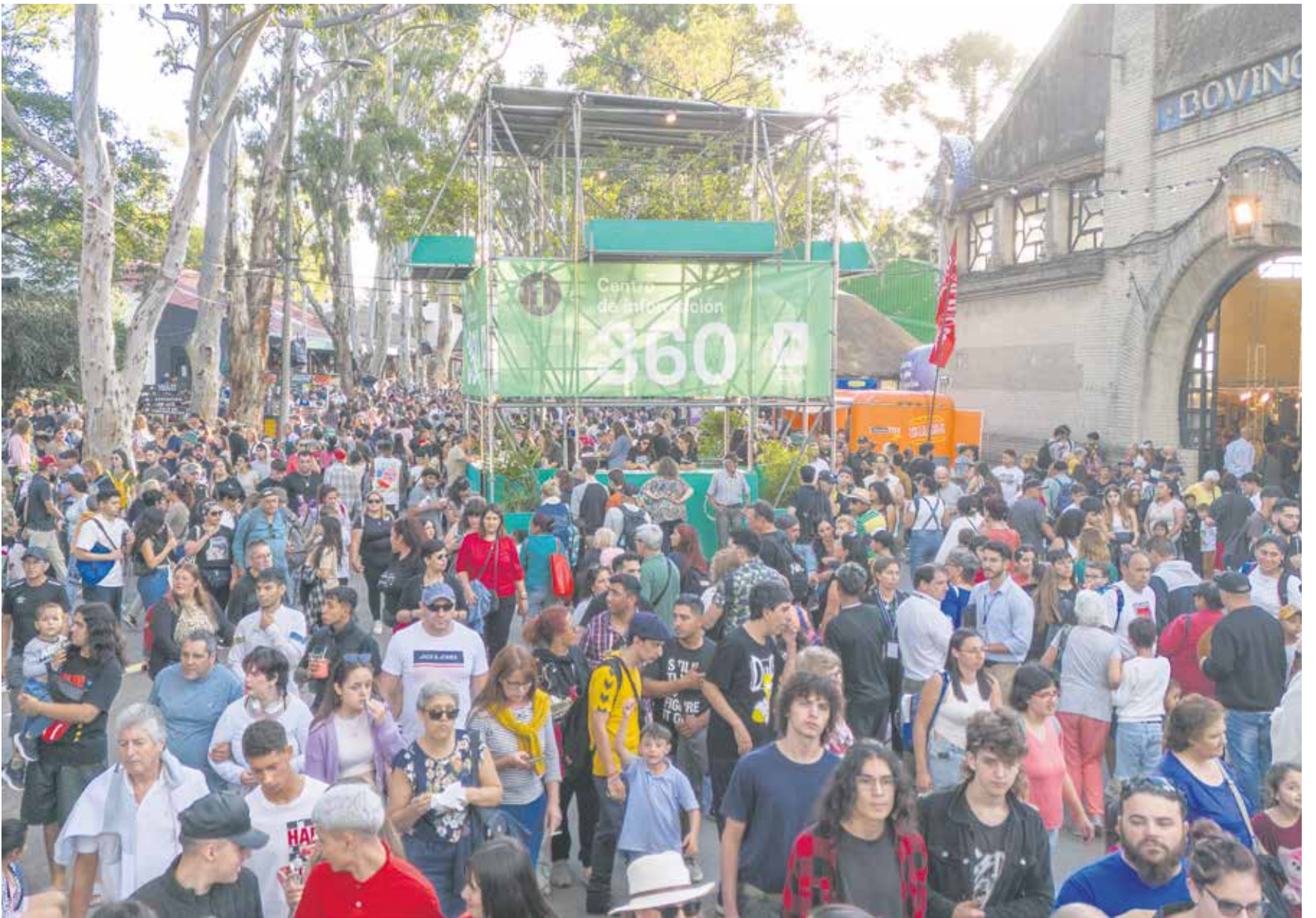
Semana Criolla del Prado.

La 97ª edición del tradicional evento convocó a gente de todo el país y la región, que protagonizó una propuesta pensada para el disfrute de toda la familia.