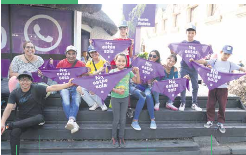
Punto violeta en la Semana Criolla del Prado 2024.