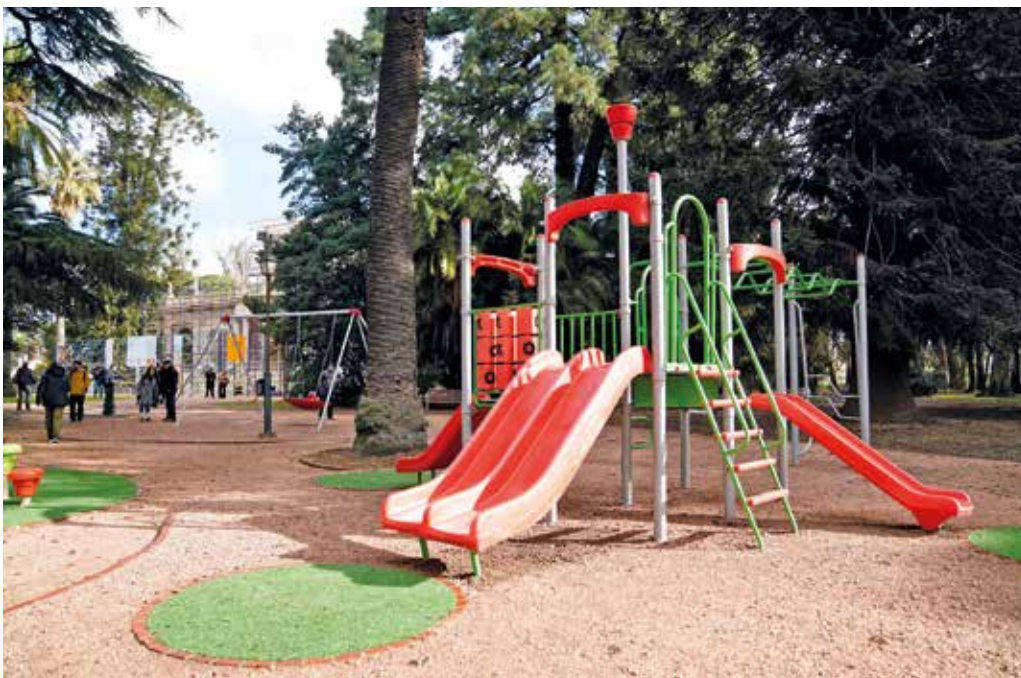
La renovada zona infantil en el Museo Blanes.