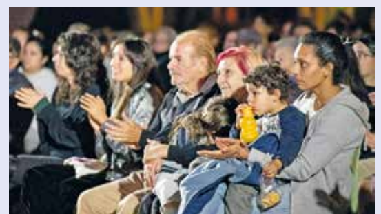
Concierto de la Banda Sinfónica de Montevideo en el Espacio Modelo. Marzo, 2024.

Como pudo leerse algunas líneas más arriba, la primera presentación de "Danzas Sinfónicas" será en el Teatro Solís, cuya Sala Principal le abrirá las puertas el martes 16 de abril a las 20.00 horas. La venta de entradas ya se está realizando a través de Tickantel, donde pueden adquirirse a diferentes costos: $390, $360 y $320. Además, existe una larga lista de descuentos: las personas no videntes entran gratis, quienes están en silla de ruedas tienen un 50% de descuento, al igual que los jubilados, portadores de la Tarjeta Dorada de la IM y los habilitados a acceder al Precio Joven. Además, usuarios de Montevideo Libre y quienes tengan Credencial Verde o Tarjeta TUS Trans ingresarán sin costo.