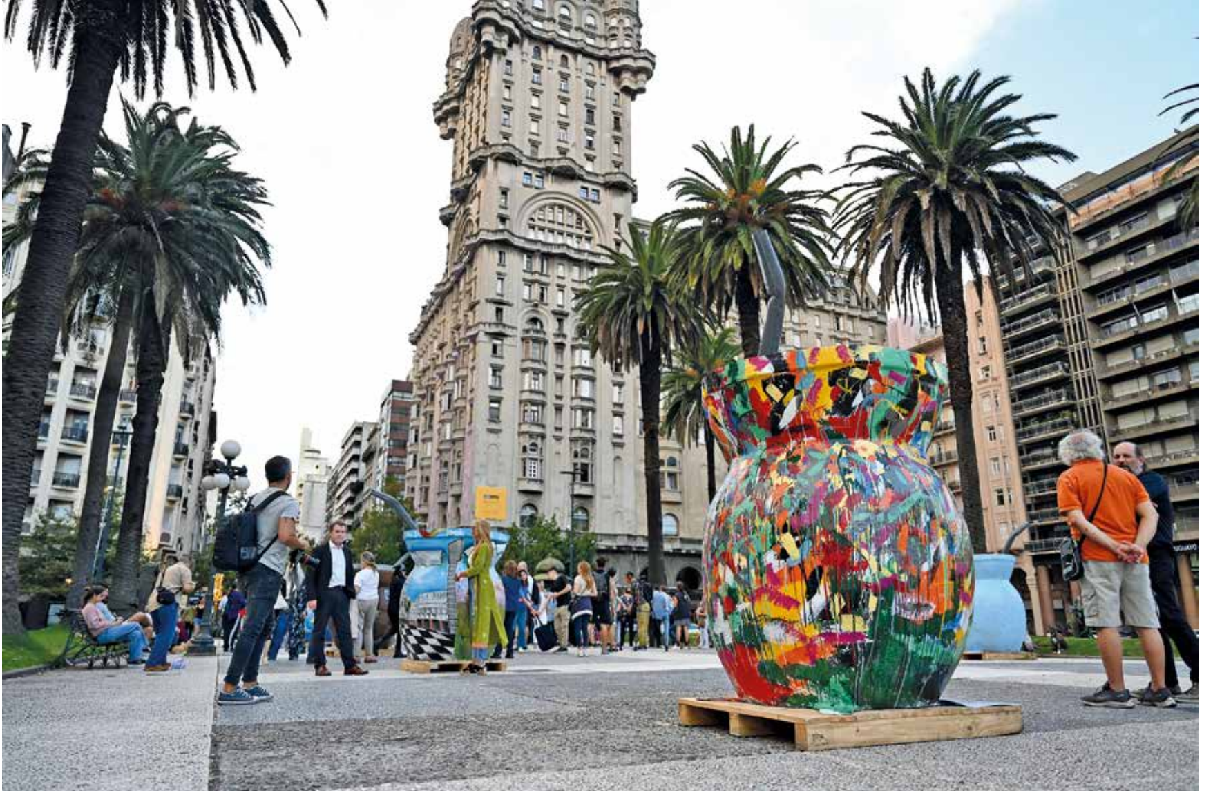
Inauguración de la 1era. Edición de Mate Art Gallery Uy. Marzo, 2024.