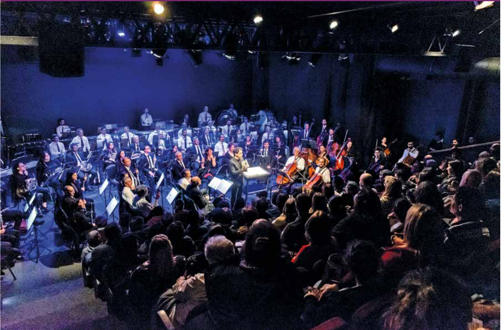
Presentación de la Banda Sinfónica en la Sala Lazaroff.

Los días 17, 18 y 19 de abril, el espectáculo "Danzas Sinfónicas" se presentará en la Sala Lazaroff, la plaza Pepe D'Elía y el Centro Cultural Florencio Sánchez.