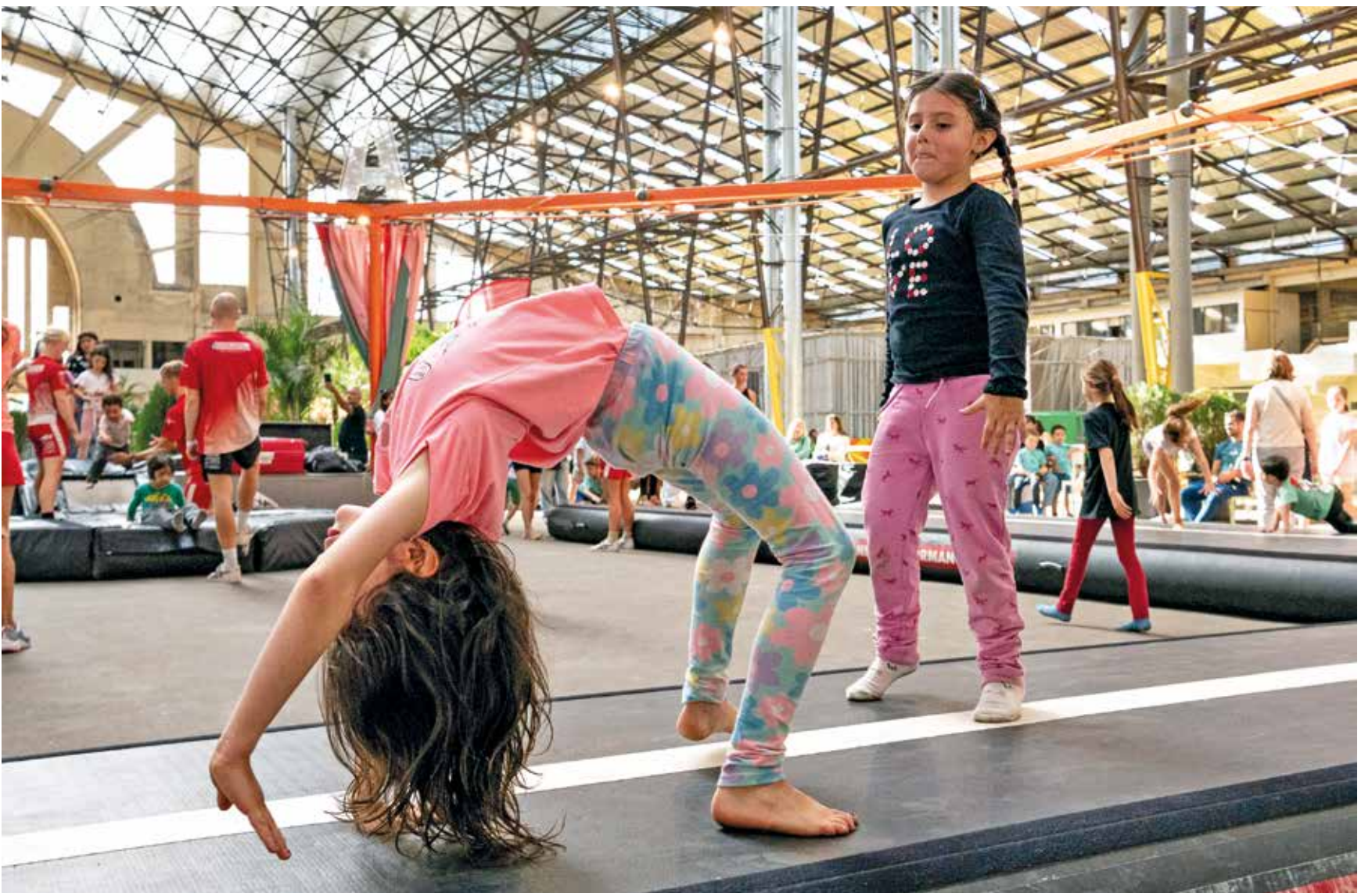
Actividades deportivas y recreativas en el Espacio Modelo. Marzo, 2024.

Comienza abril y continúan las diferentes propuestas culturales y recreativas que se desarrollan en distintos puntos de la ciudad.