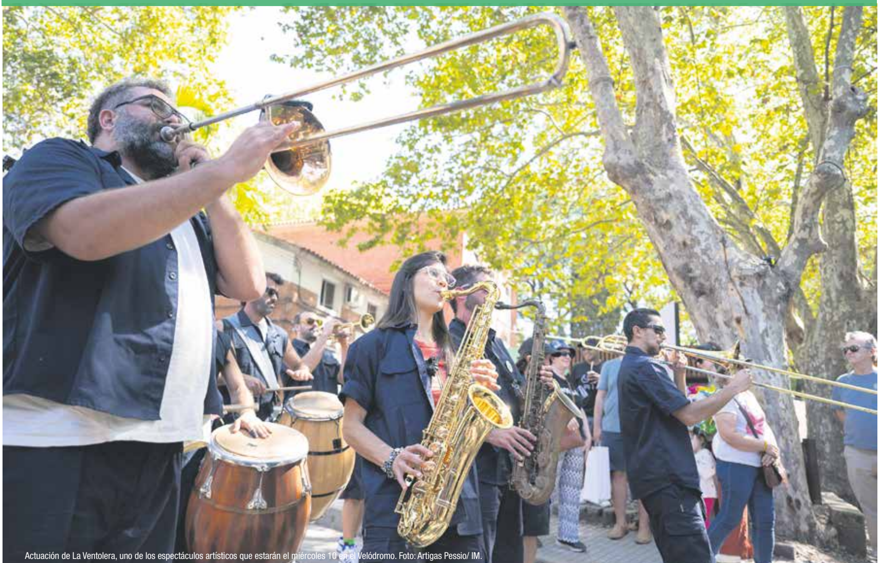
Actuación de La Ventolera, uno de los espectáculos artísticos que estarán el miércoles 10 en el Velódromo.

El Tocó Venir es organizado por la Intendencia de Montevideo desde hace más de 20 años, en coorganización con la UDELAR y con la FEU, la Federación de Estudiantes Universitarios.