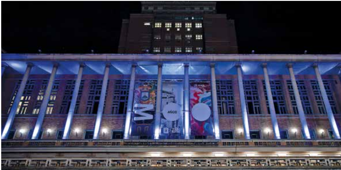
Explanada IM por el día mundial de concienciación del autismo. Abril, 2024.

La Asamblea General de Naciones Unidas definió en 2007 que cada 2 de abril tenga lugar el Día Mundial de Concienciación sobre el Autismo. Una fecha tan importante genera en todas partes del mundo instancias de sensibilización sobre el Trastorno de Espectro Autista (TEA), y Montevideo no será la excepción. Este sábado 6, de 10 a 13 horas, la explanada de la Intendencia será escenario de una jornada en la que se lleva-