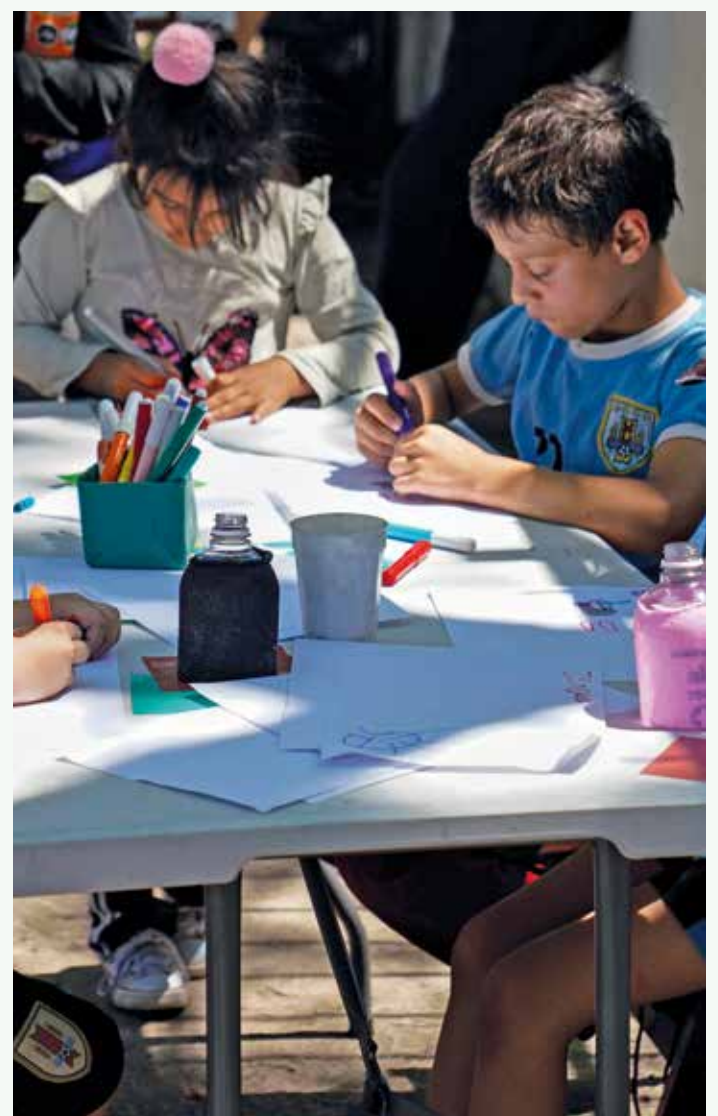
Peatonal barrial en el Municipio A.

Sin lugar a dudas, las calles de Montevideo volverán a llenarse de color y alegría durante las próximas semanas.