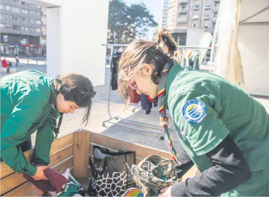
Campaña del Abrigo.

Del 27 al 31 de mayo se recibirá en la explanada de la Intendencia vestimenta, calzado, accesorio y abrigo de cama que será donado a diversas organizaciones sociales.