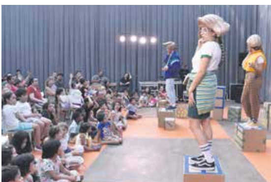
Inauguración del Espacio Modelo.