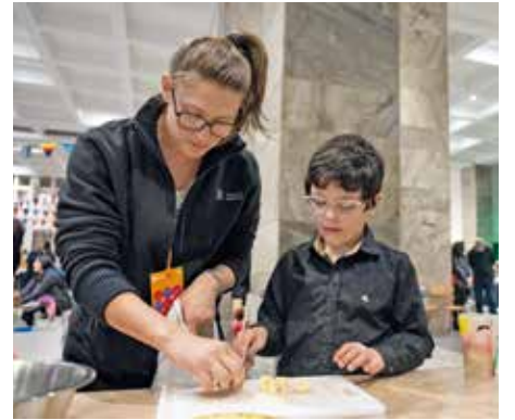
Actividad de Cocina Uruguay en la IM.