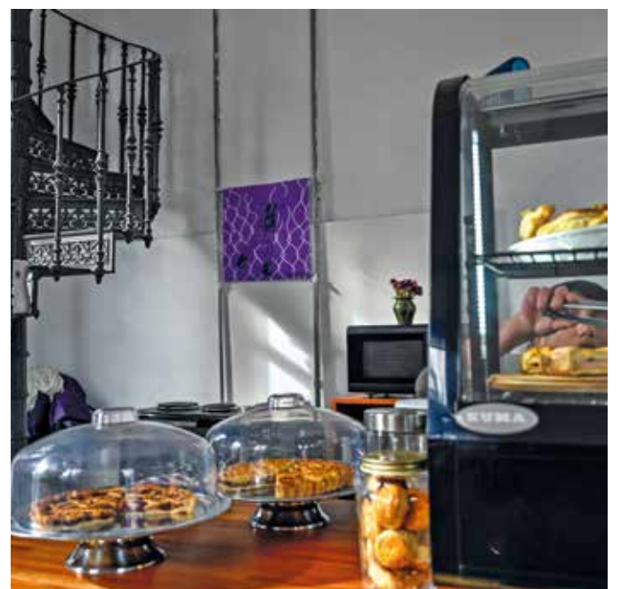
La cafetería instalada en la plaza "Las Pioneras", de la que toma prestado su nombre. Mayo, 2024.

Ubicado en la plaza “Las Pioneras” (Avenida Agraciada, entre Luna y Aguilar), abre sus puertas de martes a viernes de 10 a 19 horas. Los sábados y domingos, el horario pasa a ser de 11 a 19.