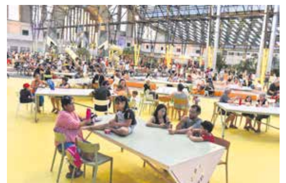
Inauguración del Espacio Modelo.