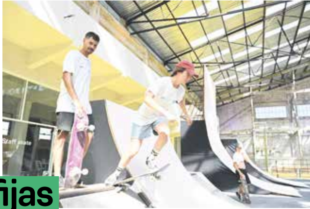
Inauguración del Espacio Modelo.