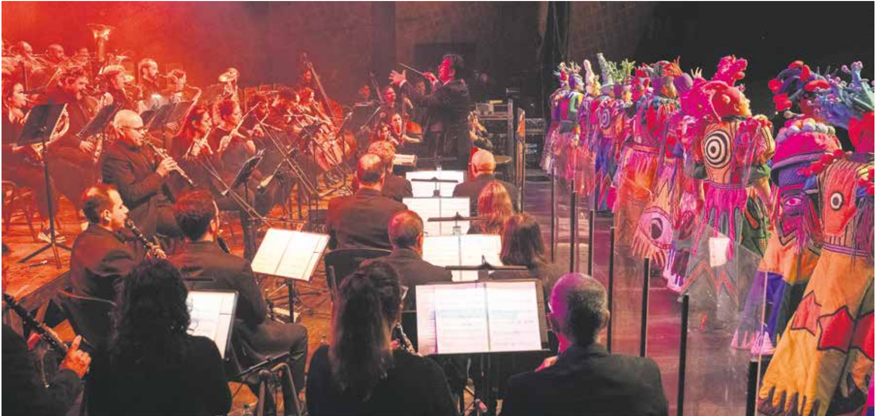
Agarrate Catalina con la Banda Sinfónica.

Fotografía, música y teatro, tres propuestas para disfrutar de excelentes eventos culturales en Montevideo en este mes de mayo.