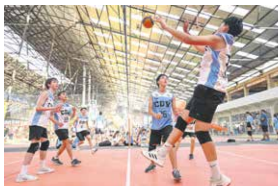
Inauguración del Espacio Modelo.