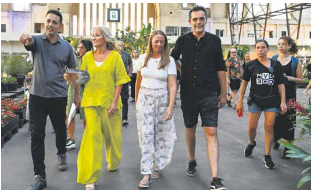
Inauguración del Espacio Modelo.