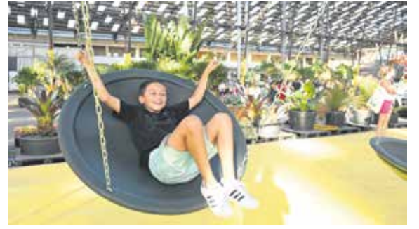
Inauguración del Espacio Modelo.

Canteros de flores y plantas, mesas y sillas, y todo coronado por una araña ornamental le dan forma al jardín de flores que se instaló cerca del portal patrimonial de la calle Cádiz. Es un espacio de descanso para contemplar el hermoso panorama o leer, tener pequeñas reuniones o realizar otras actividades.