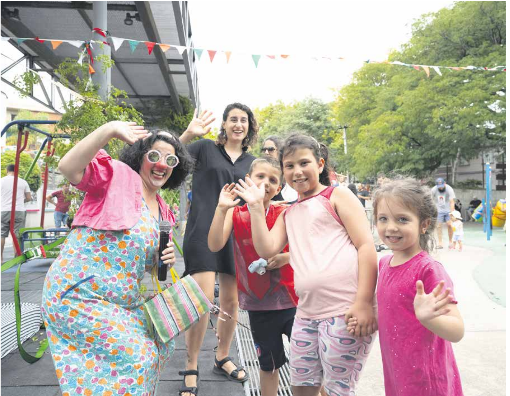
Actividad en el Parque de la Amistad.