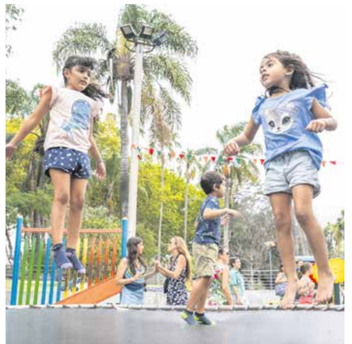
Actividad en el Parque de la Amistad.

105.700 personas visitaron el parque en estos 9 años sólo en la modalidad de visitas guiadas.