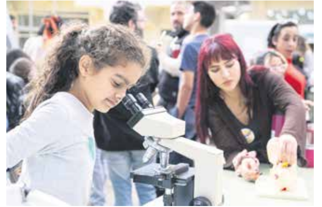
Feria interactiva de neurociencia en el Espacio Modelo.