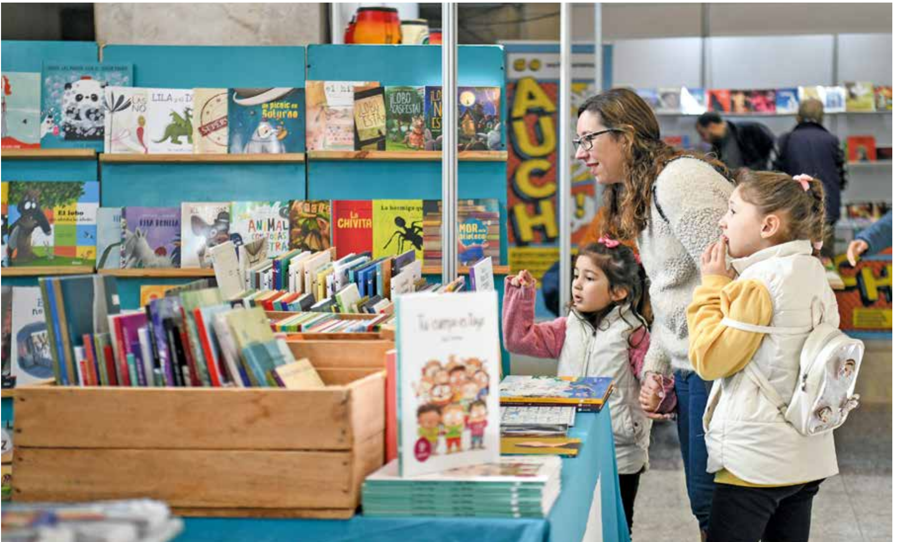
Feria del Libro Infantil y Juvenil de Montevideo.

Motivado por el Día Nacional del Libro, el sábado 25 y domingo 26 habrá en el Espacio Modelo una propuesta libre con talleres, dibujo, exposiciones y música en vivo. Unos días después, del 31 al 16 de junio, comenzará la Feria Infantil y Juvenil de Montevideo en la IM.