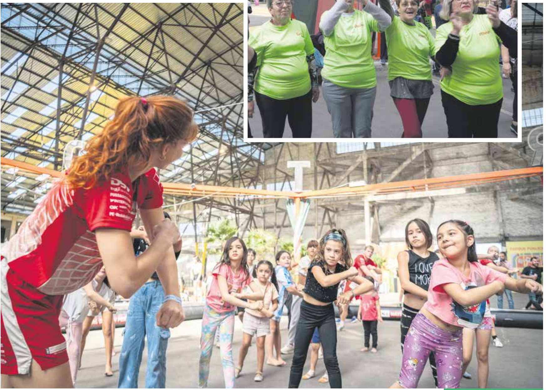
Exhibición del equipo nacional de atletas de Dinamarca en el Espacio Modelo.

Es prácticamente imposible que la persona que está leyendo estas líneas no encuentre en el Espacio Modelo una propuesta que se ajuste a sus gustos. La oferta del parque público techado más grande del país es amplísima, gratuita y contempla a todas las edades: hay juegos infantiles, diversos talleres (de temas tan variados como arte plástica y milonga, entre otros), actividades deportivas que se ajustan a los rangos etarios y las capacidades físicas de los asistentes (y que recorren disciplinas tan variadas como básquetbol, gimnasia, skate, ciclismo y frontball) y espacios de encuentro impulsados por MVD LAB que fomentan la innovación