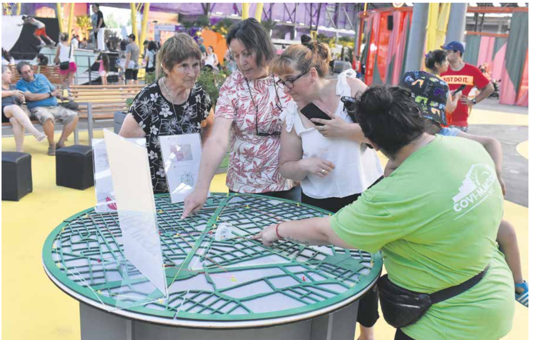
Inauguración del Espacio Modelo.