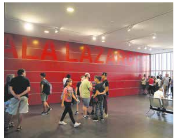
Función teatral en la Sala Lazaroff.

Entradas a la venta en Tickantel y boletería del teatro. El costo es de $390.