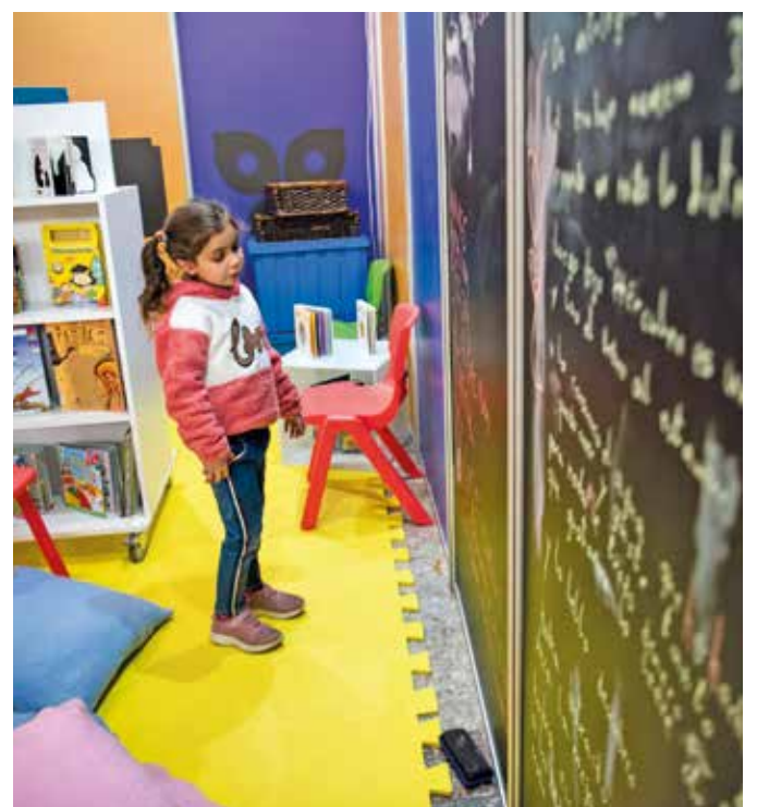
Feria del Libro Infantil y Juvenil de Montevideo.