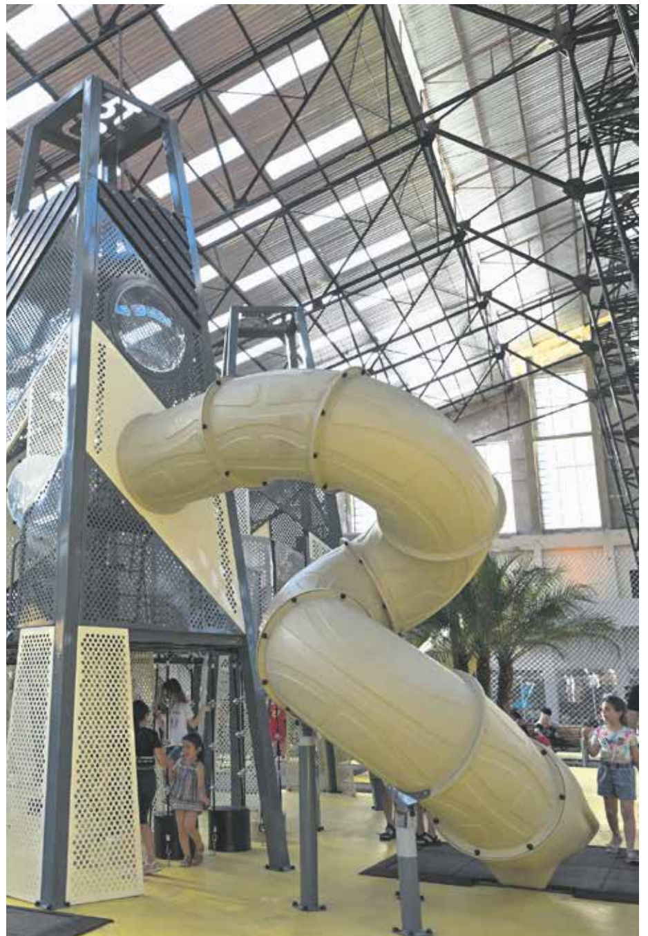
Inauguración del Espacio Modelo.