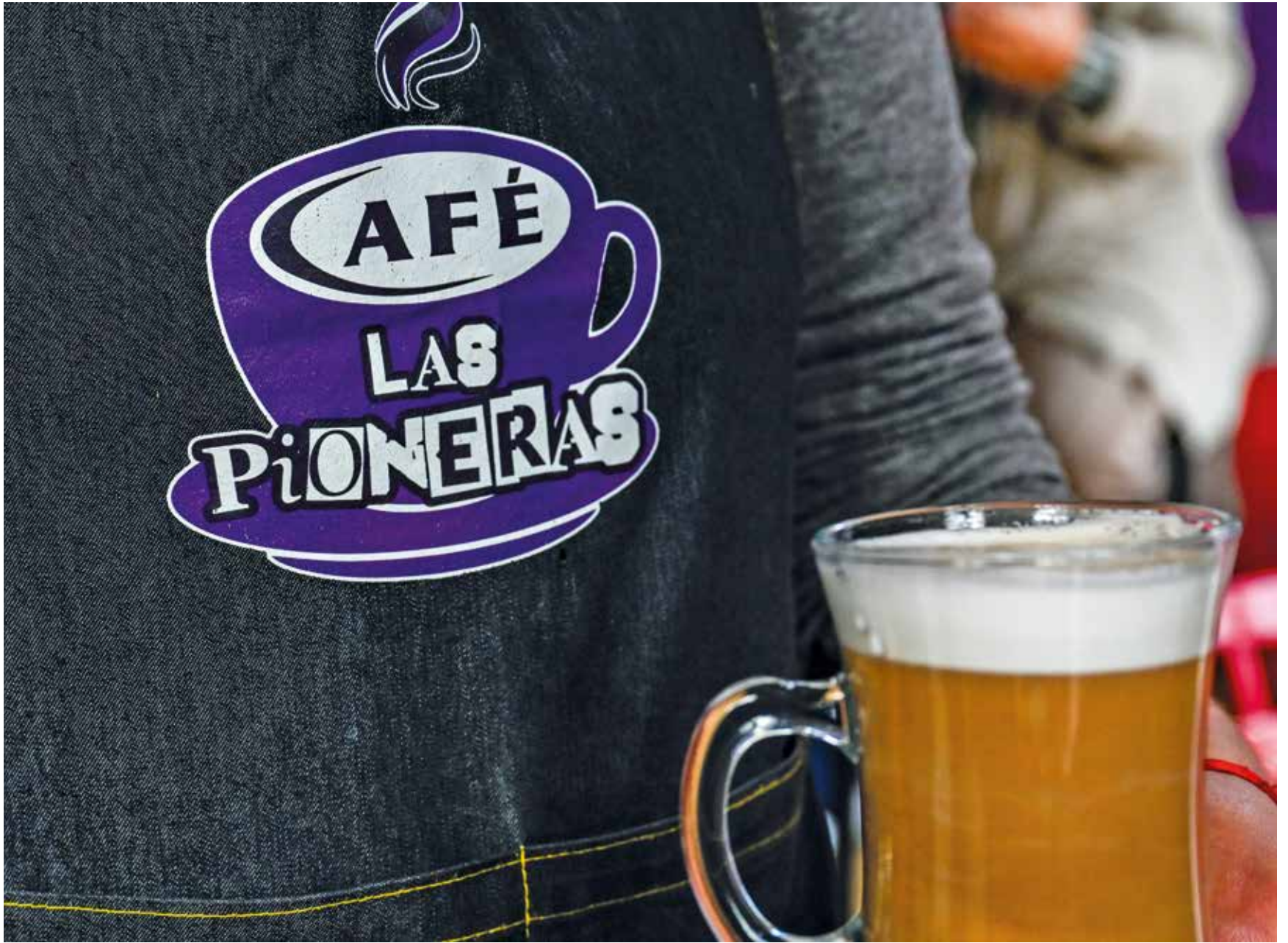
La cafetería instalada en la plaza "Las Pioneras", de la que toma prestado su nombre. Mayo, 2024.

eso que la Mercada se creó en el año 2017 y es una plataforma virtual en ese sentido”.