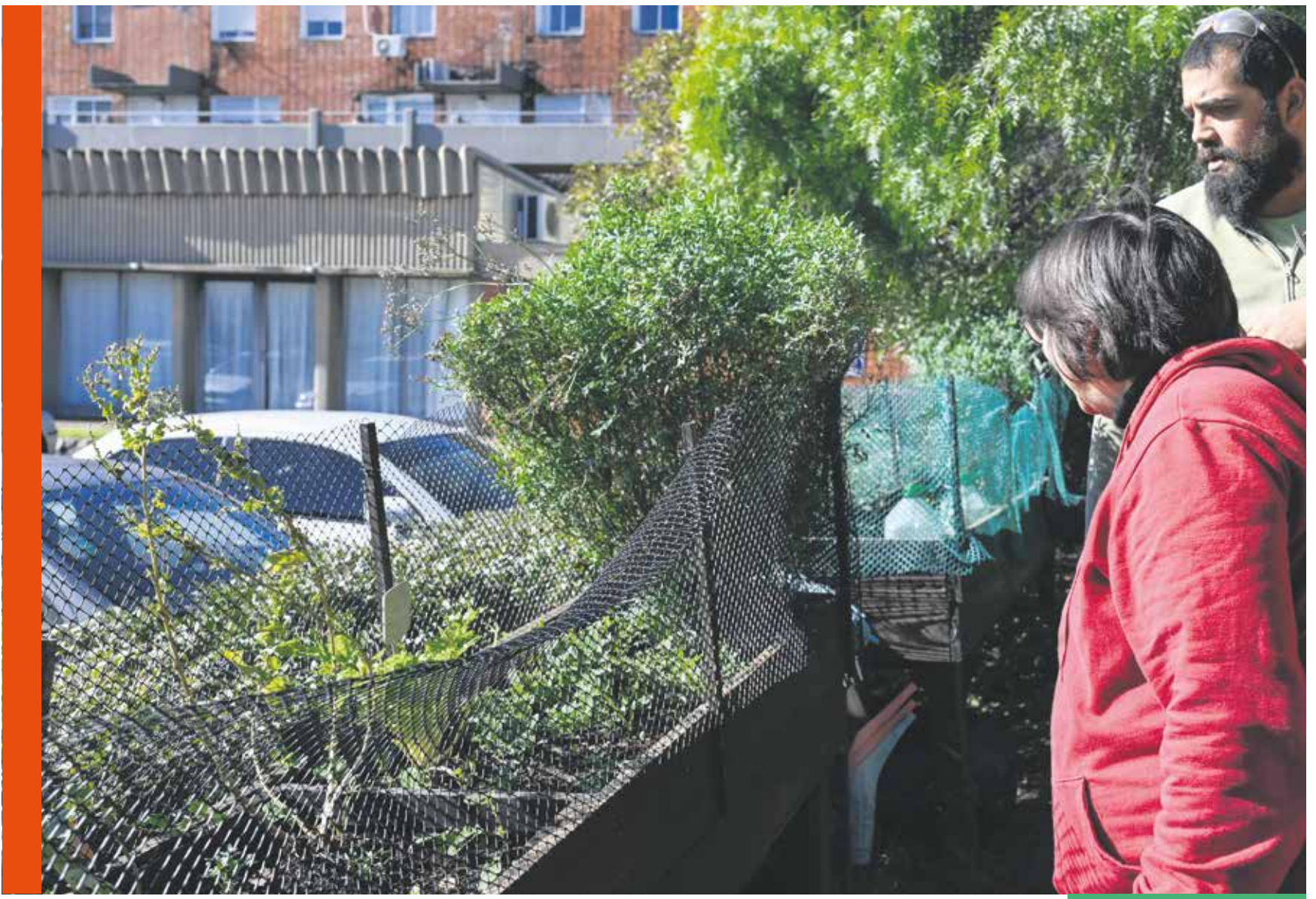
Recorrido por la cooperativa AFAF 3, que tiene uno de los 103 sellos Montevideo Más Verde otorgados por la IM.

Llevan adelante una huerta comunitaria para que todos los vecinos de la cooperativa de viviendas puedan abastecerse y trabajan junto a la IM y la Universidad de la República en el reciclaje de residuos orgánicos.