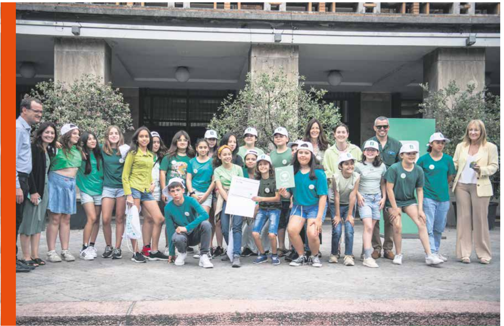
Entrega de sello Montevideo Más Verde a instituciones.

La Intendencia ya otorgó más de 100 reconocimientos a instituciones educativas, cooperativas y otras organizaciones sociales que realizan actividades que, enfocadas en mejorar la realidad medioambiental, contribuyen a generar comunidad y estimulan la multiplicación de este tipo de acciones en la ciudad.