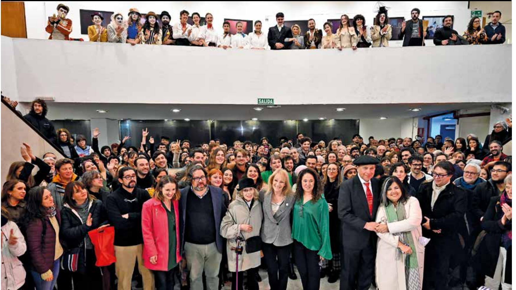
Inauguración de la nueva sede de la EMAD. Mayo, 2024.

La Escuela Multidisciplinaria de Arte Dramático inauguró su nueva sede ubicada en la calle Canelones 1084.