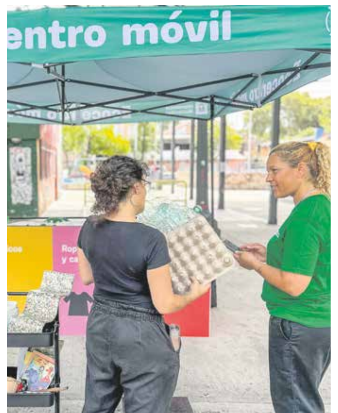
Ecocentro móvil en Terminal Goes.

Como se ve, el Mes del Ambiente estará repleto de cosas para hacer.