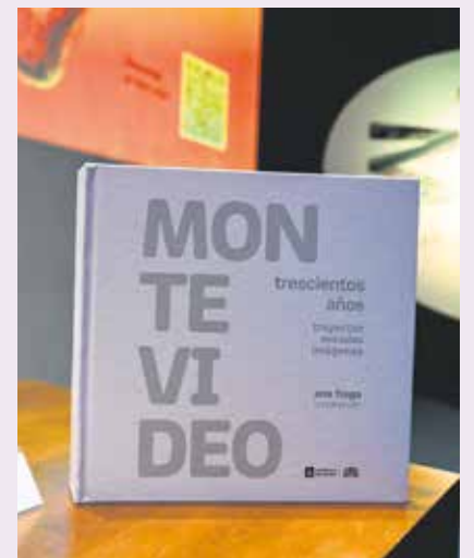
Presentación del libro: Montevideo 300 años: Trayectos, miradas, imágenes.