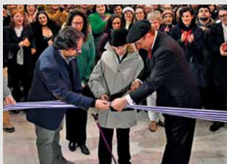
Inauguración de la nueva sede de la EMAD. Mayo, 2024.

E l local cuenta con reformas y adaptaciones para las necesidades de una escuela de formación artística que oferta cuatro carreras (actuación y diseño teatral: vestuario, iluminación y escenografía) de cuatro años de duración, una tecnicatura (dramaturgia), un diplomado (formación en docencia de teatro y expresión corporal), una extensa oferta de cursos abiertos y un programa de formación continua.