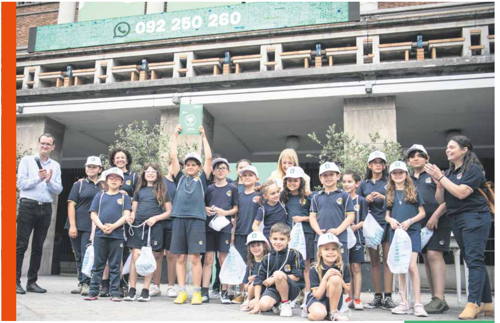
Entrega de sello Montevideo Más Verde a instituciones.

Las instituciones educativas, organizaciones y cooperativas destacan la distinción de la IM. El siguiente paso será generar instancias de encuentro e intercambio entre quienes poseen el Sello Montevideo Más Verde, para seguir estimulando así la participación y destacando su rol en la búsqueda de una realidad ambiental mejor.