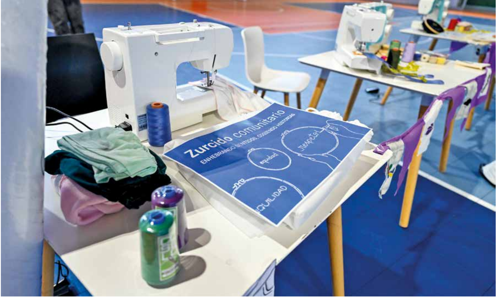
Inauguración de lavadero comunitario en el Complejo Cultural Crece Flor de Maroñas. Mayo, 2024.

las oradoras del acto inaugural. Destacó el proceso emprendido y resaltó la importancia del apoyo que desde lo institucional se le puede brindar al barrio. Mencionó, también, que el Complejo Crece es un espacio polifuncional que está constituido ideológicamente desde una perspectiva de potenciación de las personas, de democratización de acceso a las políticas públicas, de apropiación de las familias a los espacios públicos y de la mejora de la calidad de vida de las personas, trabajando junto a instituciones, vecinos y vecinas del barrio de forma conjunta.