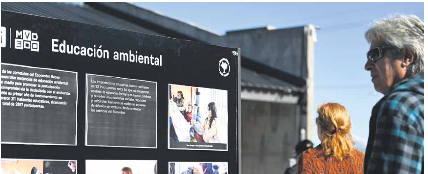
Aniversario del Ecocentro Buceo.

y adaptación a difundir. Se dará un lugar central a la presentación del documento y se dispondrá de un QR para acceder al documento completo en línea. Se expondrán los compromisos asumidos en relación a los cuatro ejes estratégicos con horizonte al 2050.