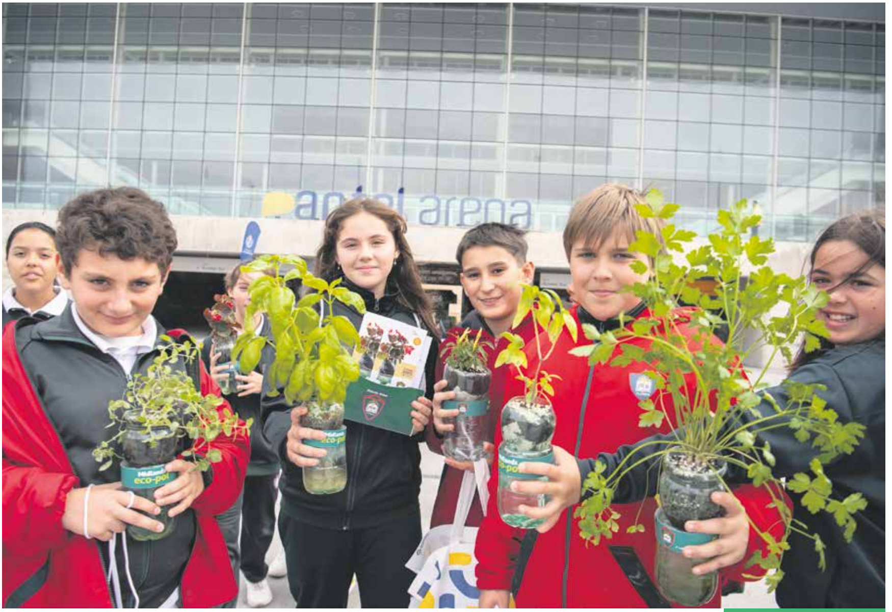
Inauguración de Expo Uruguay Sostenible.

A partir del 5 de junio, Día del Ambiente, se realizarán múltiples actividades en torno a la importancia de incorporar prácticas alineadas al cuidado del ambiente y mostrar el trabajo que la IM lleva adelante con el programa Montevideo más Verde.