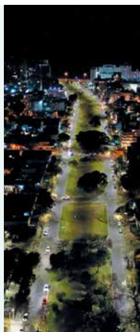
Nueva iluminación con tecnología led en la Rambla. Mayo, 2024.