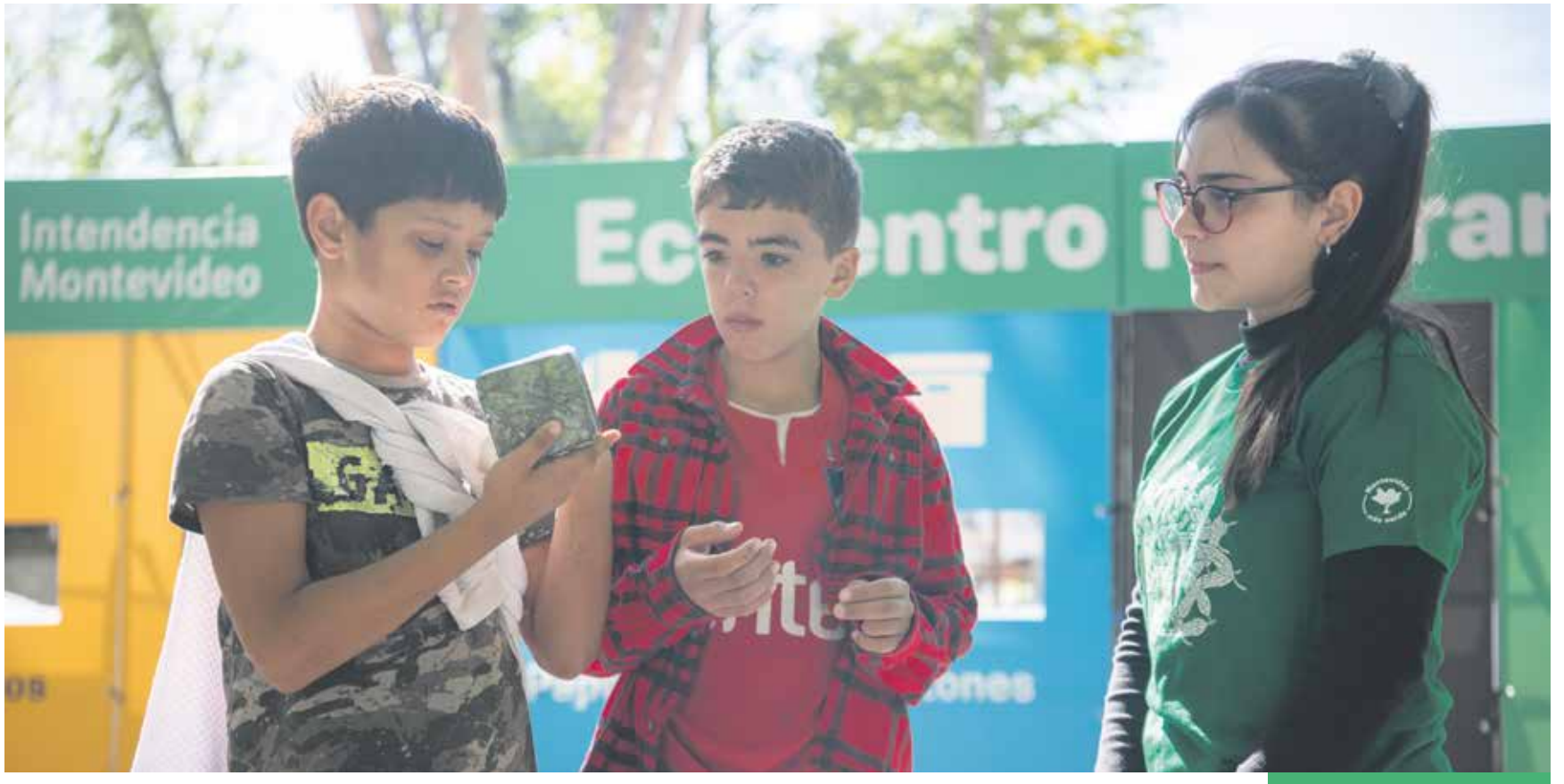
Ecocentro itinerante en la Semana Criolla del Prado.