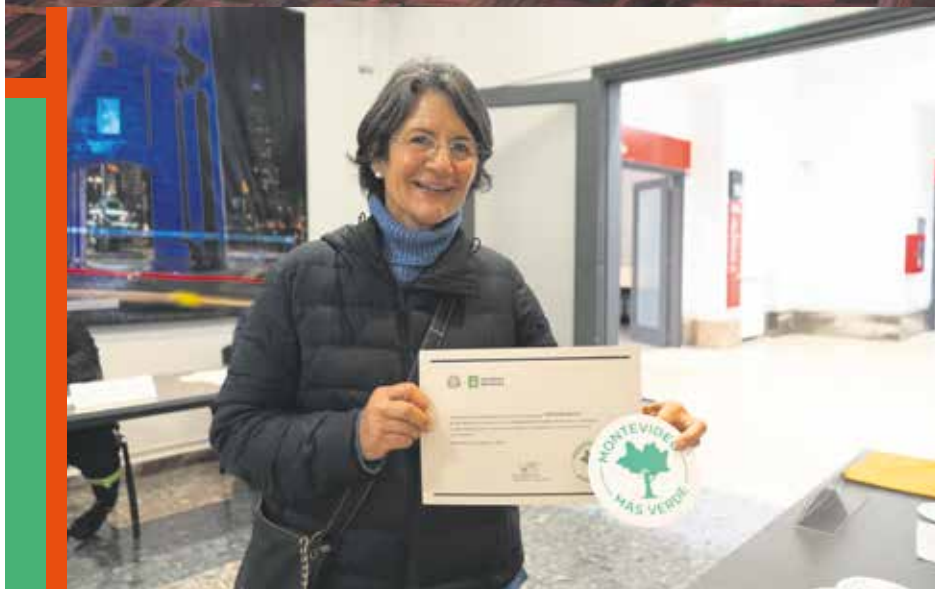
Entrega del sello «Montevideo más Verde» a Cooperativas ganadoras del llamado a proyectos ambientales.