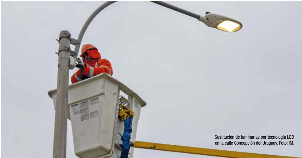
Sustitución de luminarias por tecnología LED en la calle Concepción del Uruguay.

Las luminarias con tecnología led ya fueron instaladas en el 90% de la extensión de la rambla. Además, se cambiaron 70.000 en calles barriales, se colocaron en 90 asentamientos que no tenían luz y se sigue trabajando en avenidas, aunque en varias ya se completó el proceso del programa Montevideo Se Ilumina.