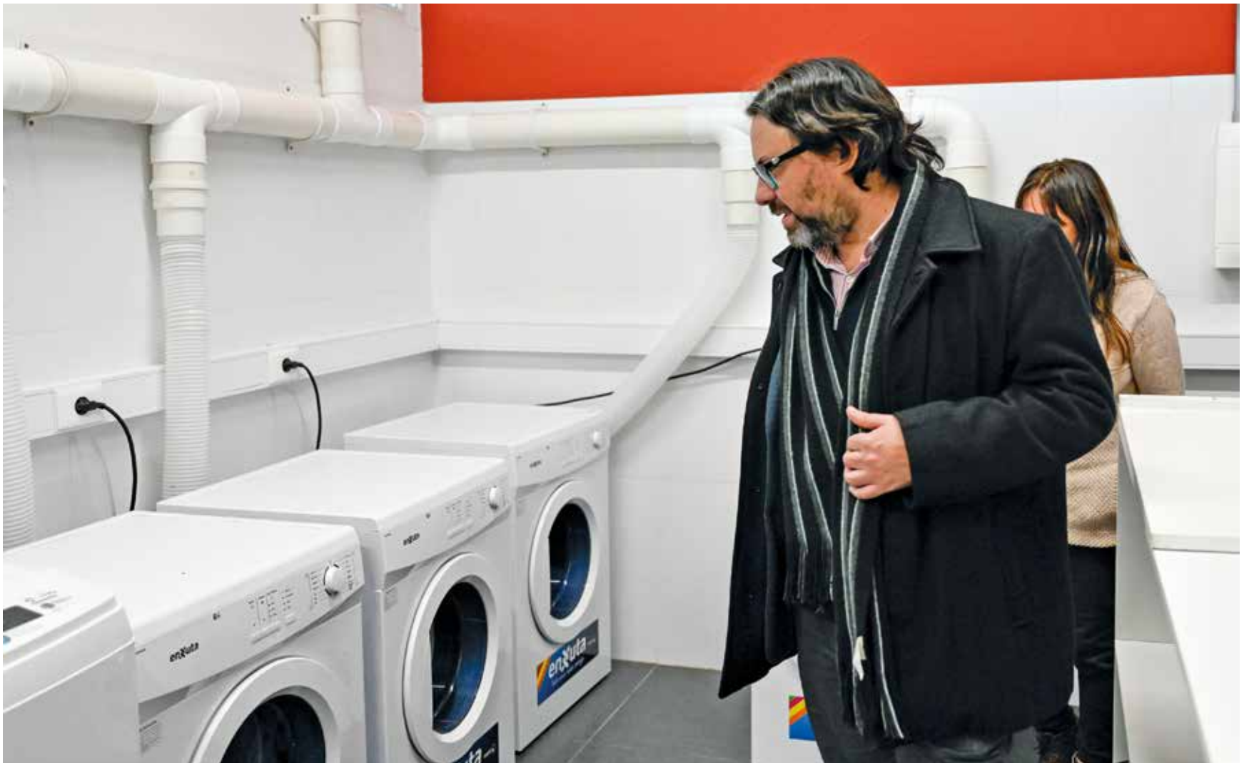
Inauguración de lavadero comunitario en el Complejo Cultural Crece Flor de Maroñas. Mayo, 2024.

Fue inaugurado en el Complejo Crece de Flor de Maroñas con un objetivo claro: brindarle un servicio a las personas cuidadoras del barrio, que en su mayoría son mujeres, para fomentar su empoderamiento y autonomía económica al darles más tiempo para realizar otras actividades. La idea es que este proyecto se replique en otras partes de la ciudad.