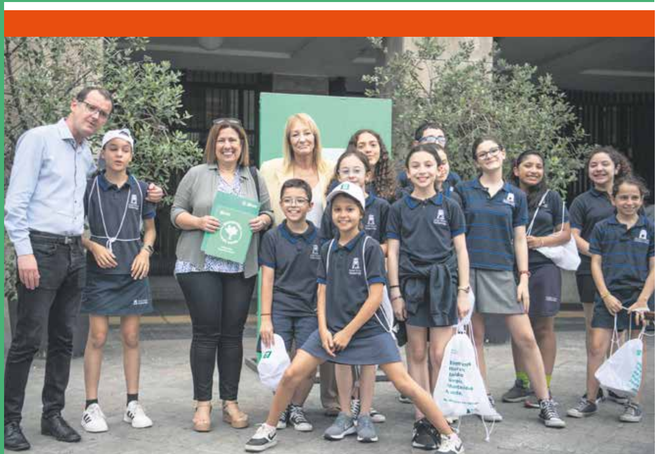
Entrega de sello Montevideo Más Verde a instituciones.

Son la cantidad de organizaciones que enfocan su acción ambiental en la clasificación de residuos. Sin embargo, hay muchos temas más: huertas comunitarias (29), acciones de sensibilización ambiental (25), reciclaje y reutilización (18), compostaje (13), eficiencia energética (7), implementación y mantenimiento de árboles (5), recolección de agua de lluvia o reutilización de agua (4), accesibilidad (3) y economía circular (1).