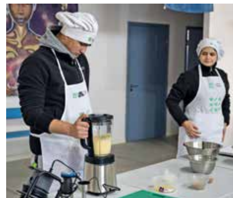
Talleres de Cocina Uruguay. Mayo, 2024.

Las propuestas de Cocina Uruguay nunca se detienen. El programa de educación alimentaria de la Intendencia de Montevideo sigue acercándole a la gente sus actividades, que buscan fomentar hábitos alimenticios saludables, indispensables para que todas las personas disfruten de una mejor calidad de vida. Todas son de acceso libre y gratuitas, y están dirigidas por un equipo de licenciados y licenciadas en nutrición, así como por cocineros y cocineras.