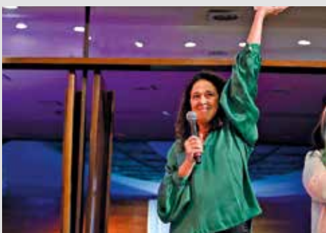
Inauguración de la nueva sede de la EMAD. Mayo, 2024.