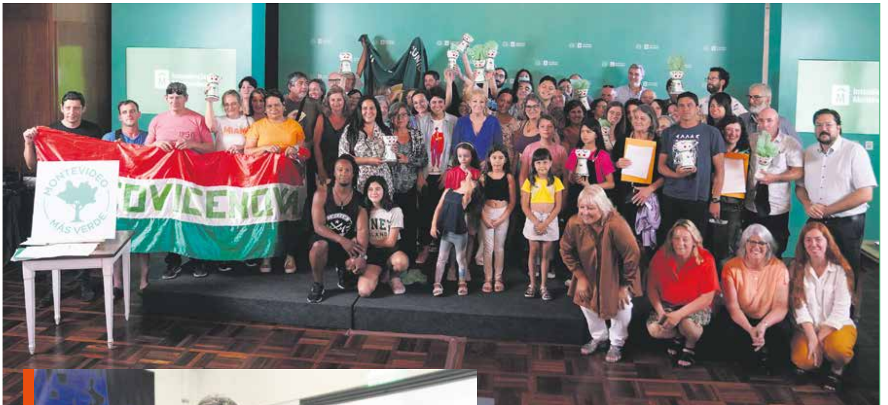
Entrega de sello «Montevideo más Verde» a cooperativas de vivienda.

"Un aspecto importante es que la sociedad está madura para darse cuenta. Otro, que si esto va multiplicándose y la gente actúa de este modo porque está bien, después da como cosa hacerlo mal. Por todo esto, el rol de la gente es clave", redondearon.