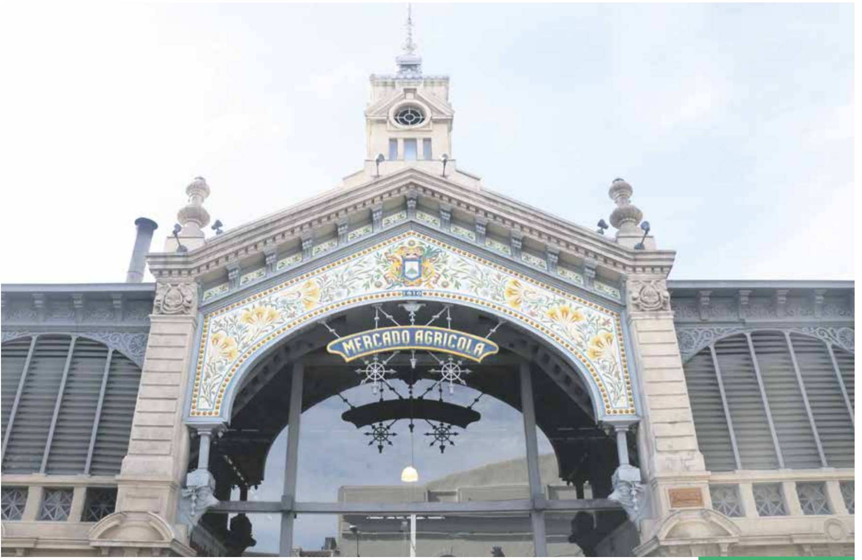
Fachada del Mercado Agrícola de Montevideo.

El 28 de junio se cumplen 11 años de la reapertura de un espacio que no para de demostrar su inmenso impacto en la ciudad. Para celebrarlo se inauguró un graffiti que destaca el vínculo del mercado con el barrio, y el día del aniversario se estrenará una fuente y habrá un show de Agarrate Catalina, entre otras propuestas.