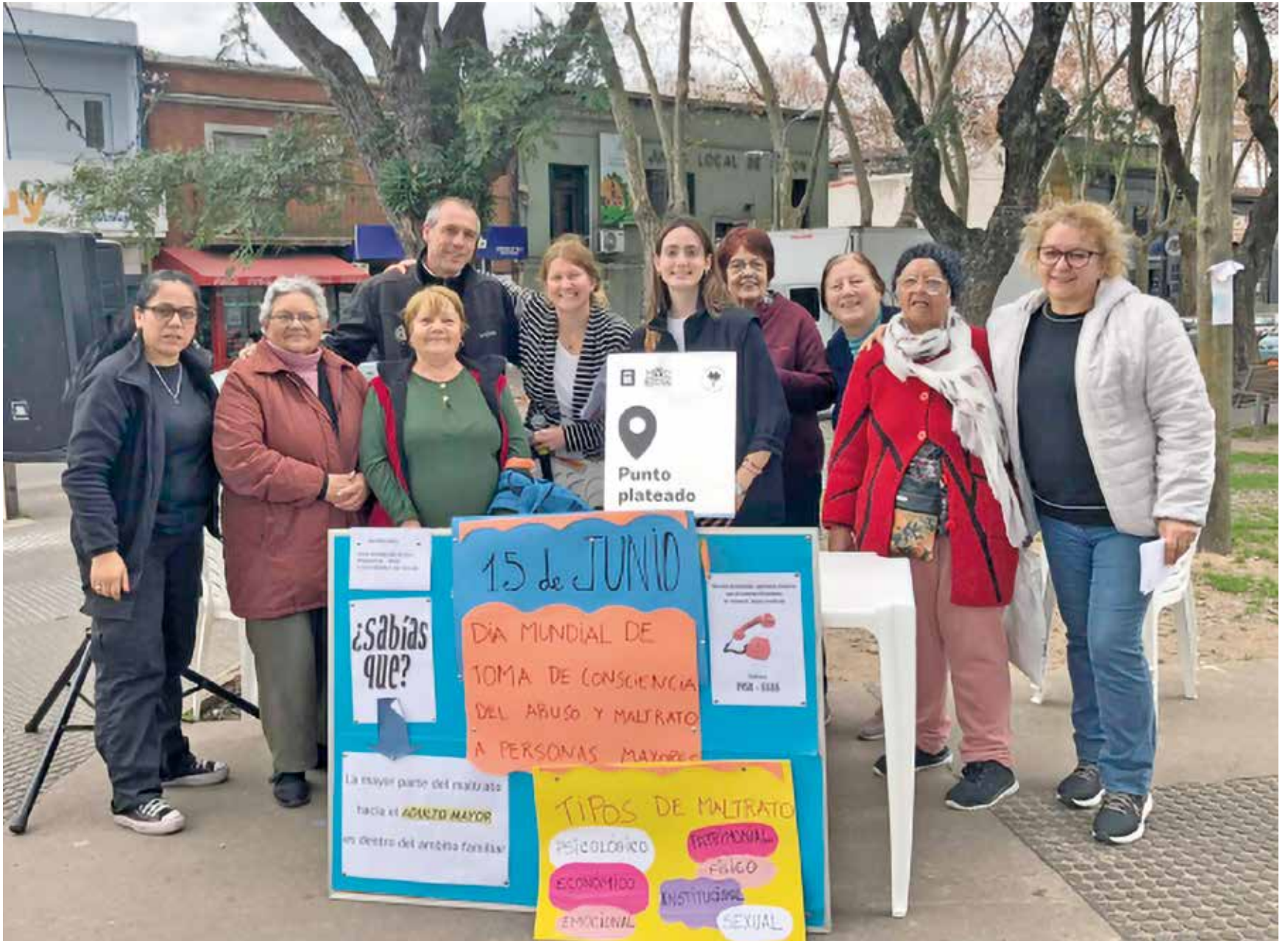
Encuentro por el Día Mundial de Toma de Conciencia del Abuso y Maltrato a las personas mayores.