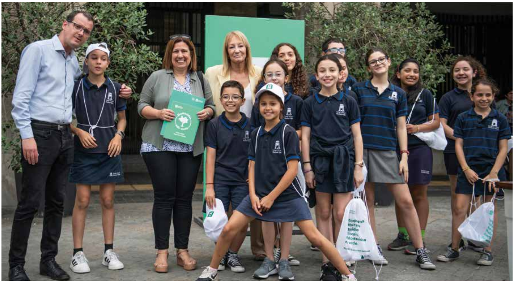
Entrega de sello Montevideo Más Verde a instituciones.

Estamos acostumbrados a que los titulares se los lleven los problemas, porque sabemos que los residuos son como los jueces de fútbol: los ven cuando anda mal la cosa. Pero al mismo tiempo en Montevideo se está produciendo un cambio que, cuando uno mira los números, es impresionante”