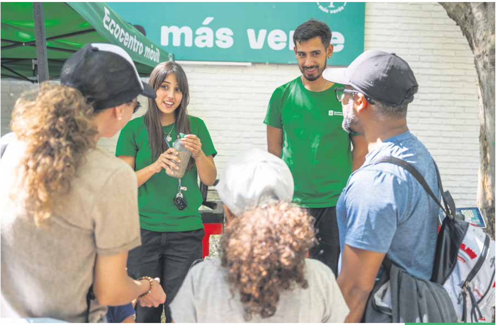
Ecocentro móvil en la Semana Criolla del Prado.

La participación de la gente a través de diversas herramientas generadas por Montevideo Más Verde, como la línea 092 250 260, los ecocentros, el servicio de bolsones o el trabajo de los motocarros demuestra que la ciudadanía “ha respondido invariablemente: cuando uno mira los números, es impresionante el cambio”, advirtió Guillermo Moncecchi.