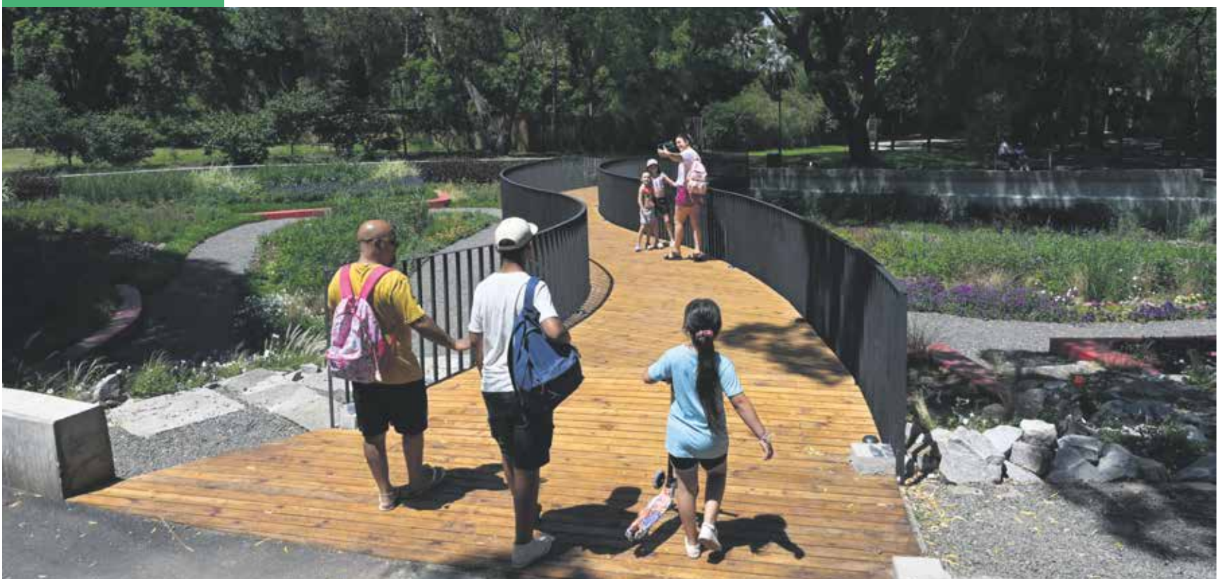
Familias disfrutando del Parque Villa Dolores.

La gente empieza a apropiarse de los lugares, y hoy Montevideo es una ciudad que tiene mucho uso del espacio público”.