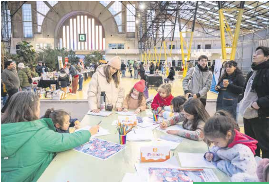
Festival en el Espacio Modelo, uno de los espacios públicos más visitados de la ciudad.

Además de seguir con iniciativas. Ahora se vienen los ecocentros móviles, va a seguir el recambio de contenedores, seguimos todo el tiempo mejorando la eficiencia. Me parece que lo más importante es que, de cara a un nuevo gobierno, en un último año de período, dejar todo consolidado para que el que venga pueda continuar un camino y mantener una política en ese tema”.