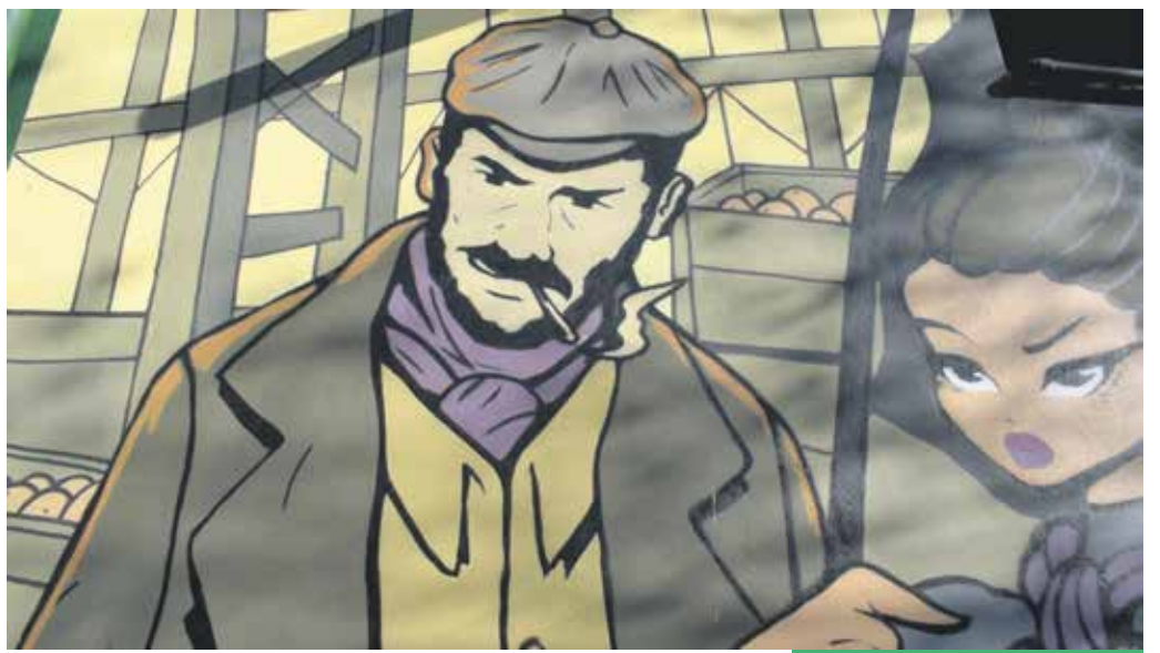
Así luce el nuevo graffitti realizado por el undécimo aniversario del Mercado.