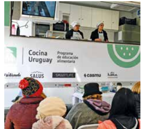
Taller de Cocina Uruguay en el Centro Salesiano.

Cocina Uruguay es un programa de educación alimentaria de la Intendencia de Montevideo que funciona desde 2007. Busca la cercanía con la ciudadanía a través de un espacio de encuentros e intercambio de saberes y promoción de hábitos saludables que contribuyen a la autonomía, otorgando herramientas que generan seguridad para la selección y preparación de alimentos, trabajando la alimentación como derecho humano. Todas las actividades son de acceso libre y gratuitas, dirigidas por un equipo de licenciadas/os en nutrición y cocineras/os. Al finalizar los cursos se entrega a cada participante un libro con más de 150 recetas fáciles, económicas y saludables.