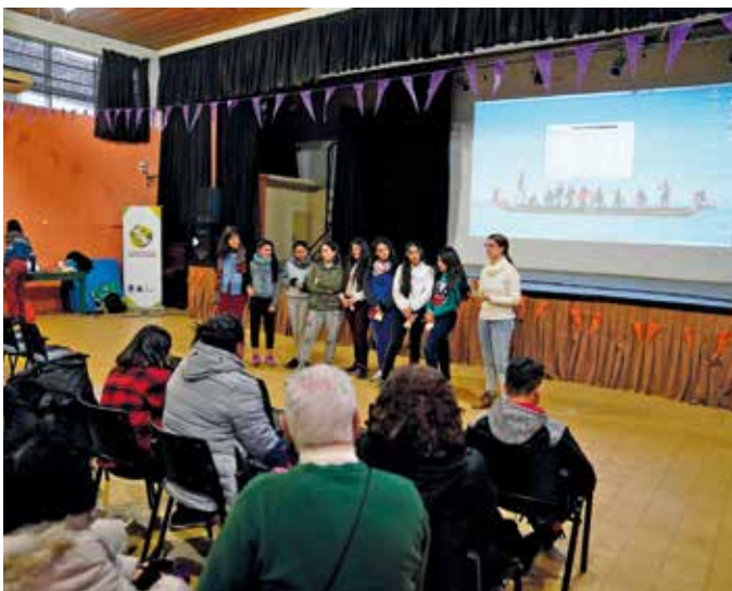
Ciclo de cine en el Complejo Sacude, que recibirá actividades como parte de "Estrenos recientes".

Durante junio, julio y agosto se proyectarán, en salas y centros culturales de todo el departamento, películas estrenadas entre 2022 y 2024.