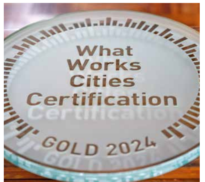
Montevideo recibe certificación de What Work Cities. Junio, 2024.

El programa de Certificación What Works Cities, lanzado en 2017 por Bloomberg Philanthropies y dirigido por Results for America, es el estándar internacional de excelencia en el uso de datos en la gobernanza de ciudades.