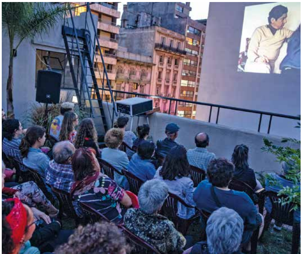
Propuestas gratuitas de cine recorrerán los barrios de Montevideo.

Se desarrollará durante junio, julio y agosto en diversas salas y espacios culturales de la ciudad. El Centro Cultural Goes, la Sala Lazaroff y el Complejo Sacude son algunos de los lugares donde ya fueron proyectadas (y hay por delante varias fechas más) las películas