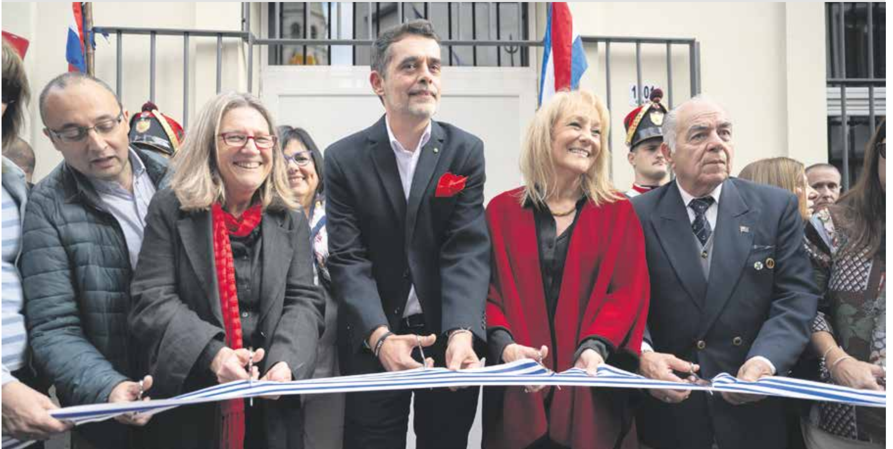
Inauguración de Centro Cultural Casa Natal de Artigas. Junio, 2024.

Tras un arduo trabajo de recuperación arquitectónica y la intervención de equipos de arqueología y antropología, abrió sus puertas a la ciudad el lugar en que nació José Artigas. Allí funcionará un centro cultural que abre sus puertas de forma libre y gratuita a quienes deseen disfrutarlo.