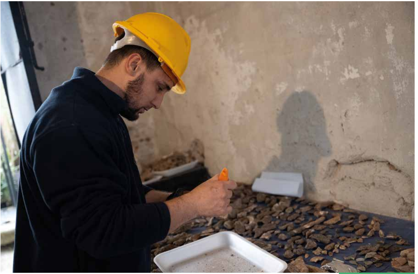
Hallazgos de restos coloniales en el Cabildo de Montevideo. Agosto, 2024.

Los trabajos que se estaban haciendo para mejorar la accesibilidad del lugar involucraron excavaciones que descubrieron estructuras y objetos de la época colonial y tiempos posteriores, que arrojan luz sobre la historia de una ciudad que está celebrando sus 300 años.