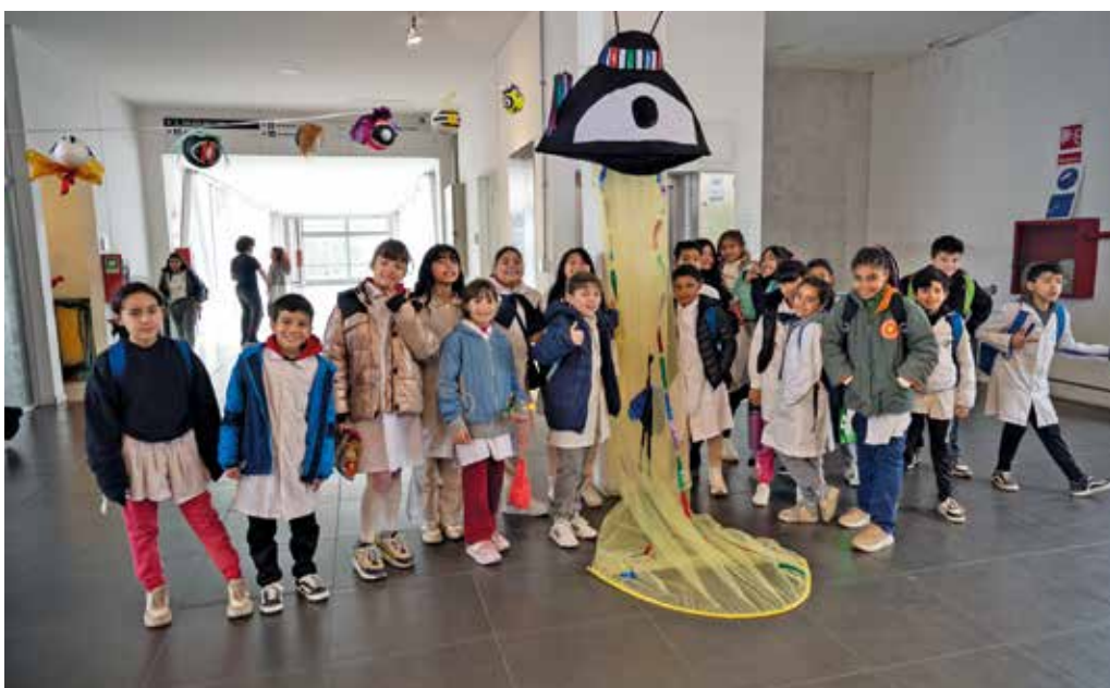
Divercine en la Sala Lazaroff. Agosto, 2024.

Durante todo el mes de agosto se exhiben películas y se realizan talleres vinculados al cine y a la realización audiovisual en diferentes salas municipales y centros educativos.