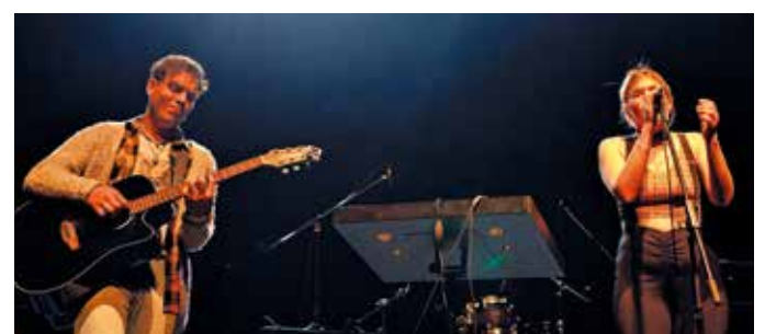
Jornada de música de Movida Joven en la Sala Zitarrosa.

Las inscripciones se realizan a través de formularios en línea, habilitado hasta el domingo 15 de setiembre. Las bases y los formularios para cada categoría se encuentran disponibles en el sitio web del evento.