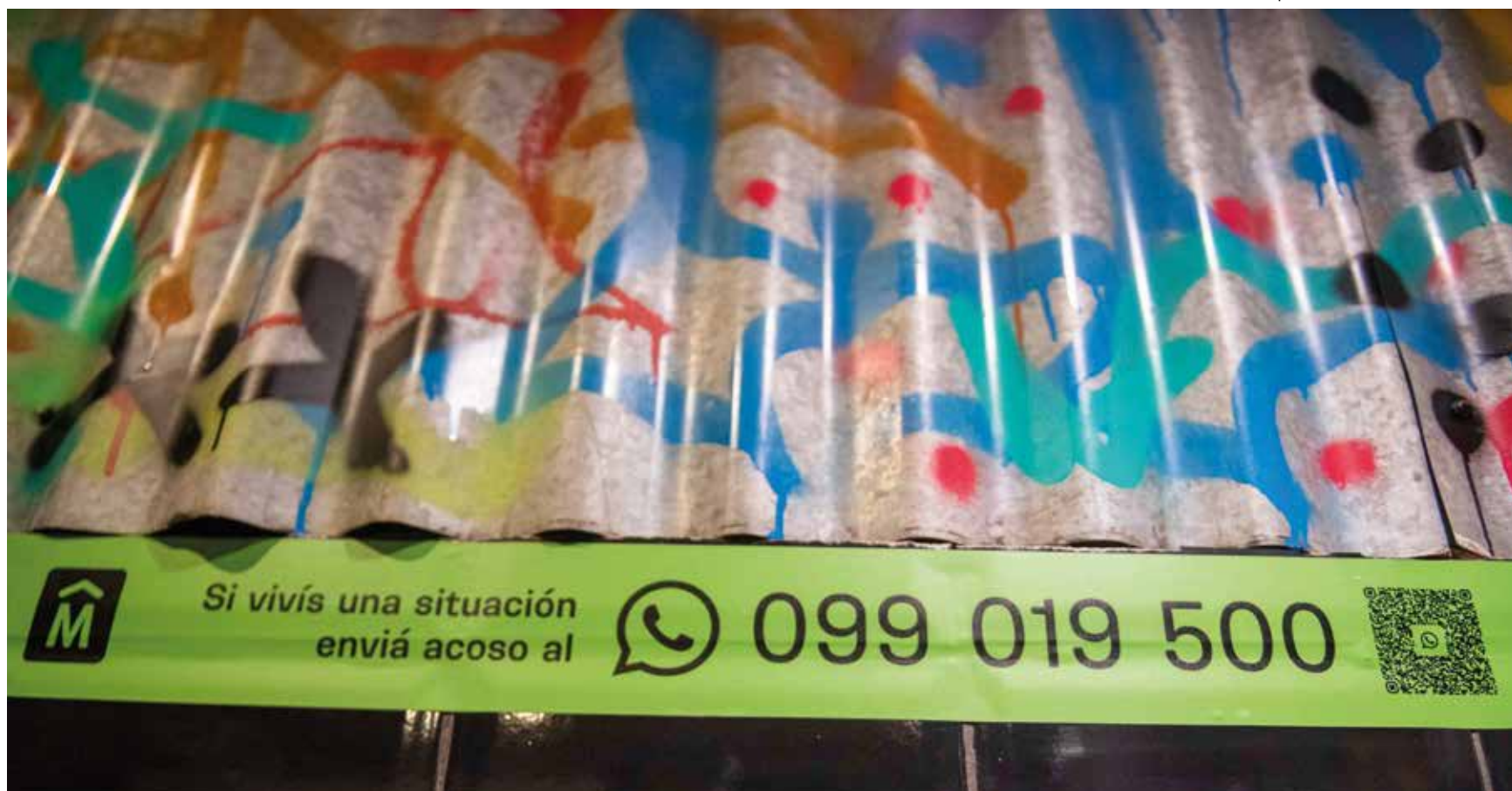
Campaña "Boliche libres de acoso".

Para sumarse voluntariamente, los locales interesados en sumarse a "Boliches libres de acoso" deben enviar un correo electrónico a libredeacoso@imm.gub.uy . Los pasos a seguir para incorporarse son: expresar interés a la Intendencia de Montevideo, sensibilizar al personal, contar con un espacio tranquilo y aislado (no excluyente), cartelera visible, seguir los pasos de la Guía de Actuación.