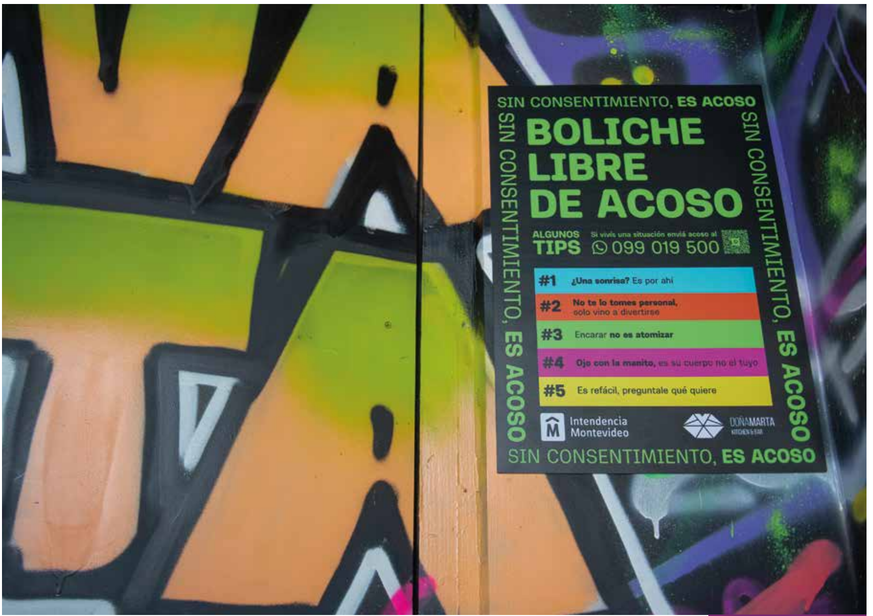
Campaña "Boliche libres de acoso".

Con el fin de generar conciencia y abordar la temática, se desarrolló una Guía de Actuación para el personal de los locales de ocio nocturno que se adhieran a una propuesta que, además, implica una campaña de comunicación que pone bajo la lupa códigos y prácticas hegemónicas. La misma ya está funcionando en tres establecimientos.