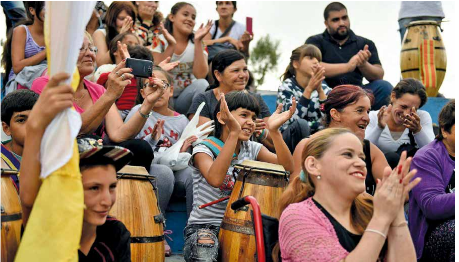
Programa Esquinas de la Cultura.