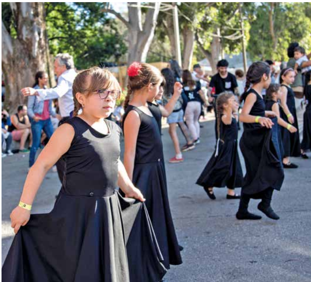
Programa Esquinas de la Cultura.

En su página web ( https://esquinas.montevideo.gub.uy/ ) puedes encontrar toda la información necesaria para despejar tus dudas.