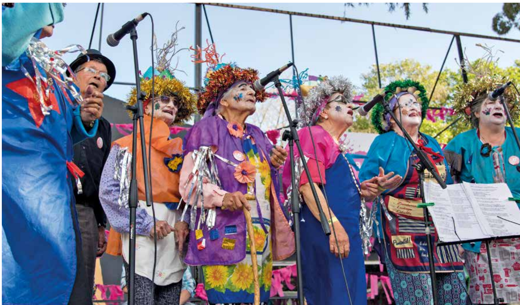
Programa Esquinas de la Cultura.

mos la certeza de que los talleres abren otros horizontes a quienes participan.