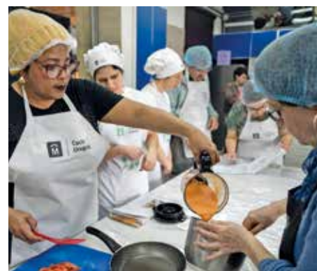
Curso sobre Alimentación Saludable.

Las propuestas de Cocina Uruguay nunca se detienen. El programa de educación alimentaria de la Intendencia de Montevideo sigue acercándole a la gente sus actividades, que buscan fomentar hábitos alimenticios saludables, indispensables para que todas las personas disfruten de una mejor calidad de vida. Todas son de acceso libre y gratuitas, y están dirigidas por un equipo de licenciados y licenciadas en nutrición, así como por cocineros y cocineras.