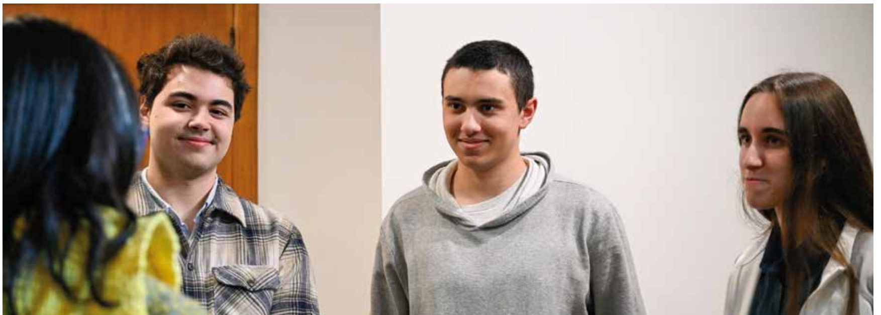
Encuentro con estudiantes de astronomía en el Planetario de Montevideo.