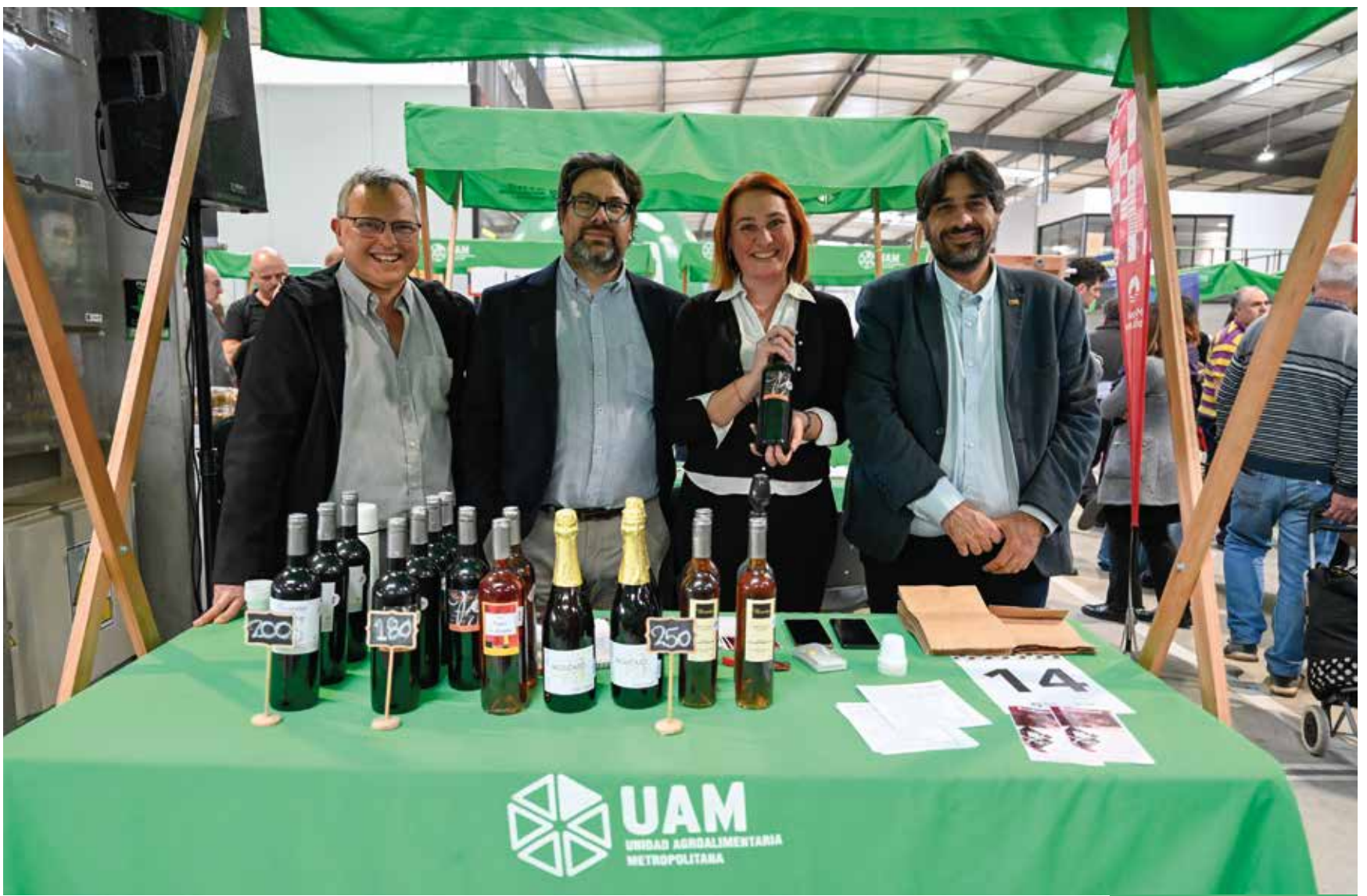
Expo Regional de Alimentos en la UAM. Agosto, 2024.

Contó con la presencia de nueve departamentos del país y emprendimientos de fuera de fronteras, como Argentina, Brasil, Armenia y Colombia presentando productos de su producción y gastronomía.