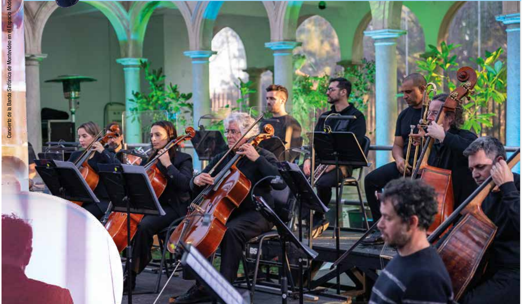
Actuación de la Banda Sinfónica en el Museo Blanes.

Concierto de la Banda Sinfónica de Montevideo en el Espacio Modelo.