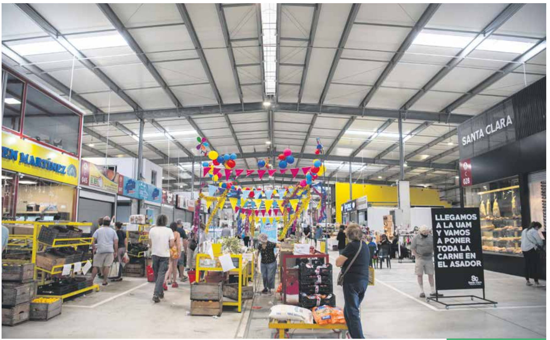
Actividad durante el ciclo "Sábados del Polivalente" en la UAM.