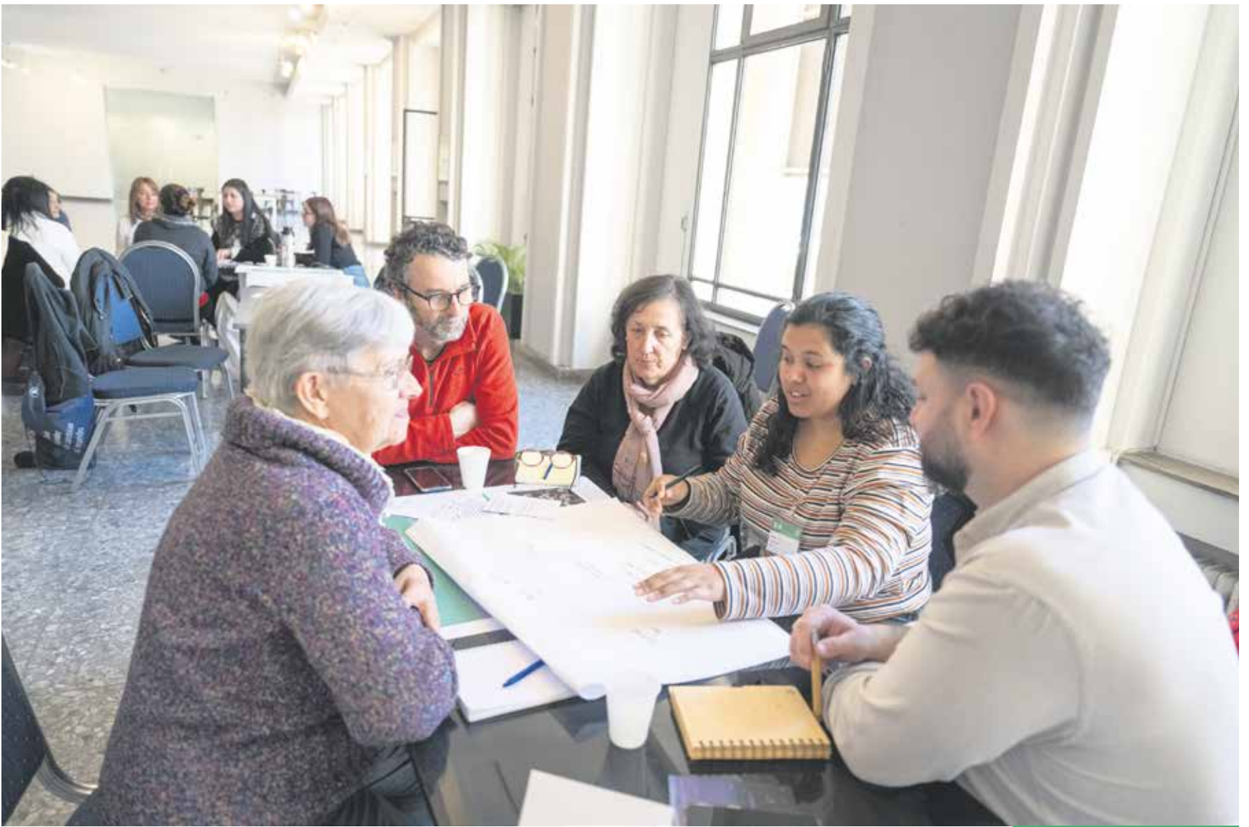
Sello Montevideo Más Verde : Jornada de trabajo colaborativo. Setiembre, 2024.

Instituciones educativas, cooperativas, organizaciones sociales y otras entidades que han recibido el reconocimiento que distingue acciones ambientales protagonizaron una instancia de diálogo e intercambio en la Intendencia que evidenció que su potencial se multiplica cuando se tienden puentes y generan vínculos entre partes con objetivos comunes.