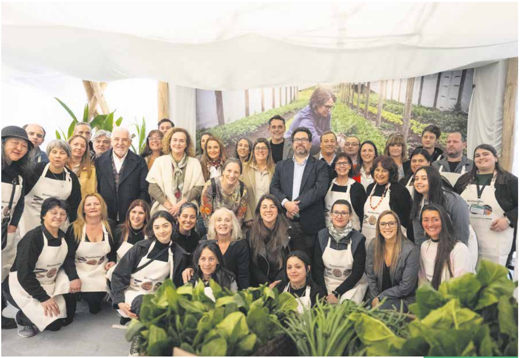
Entrega de premios a los mejores stands de la Expo Prado 2024. Setiembre, 2024.

El stand que la comuna instaló en el tradicional evento, en el que además de aludir a los 300 años de la ciudad tuvieron un papel importante distintos emprendimientos impulsados desde Montevideo Rural, fue distinguido en la categoría “Espacios Verdes”.