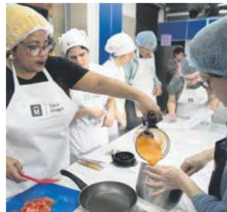
Curso básico de Cocina Uruguay en Los Bulevares.

Cocina Uruguay, el programa de educación alimentaria de la Intendencia de Montevideo, sigue ofreciendo oportunidades para que las y los interesados puedan asistir a cursos y talleres gratuitos en los que licenciados en nutrición y cocineros comparten sus conocimientos sobre alimentación saludable. De esta forma, las personas tendrán más herramientas para mejorar sus hábitos en su vida diaria, además de llevarse un libro con más de 150 recetas fáciles, económicas y saludables.