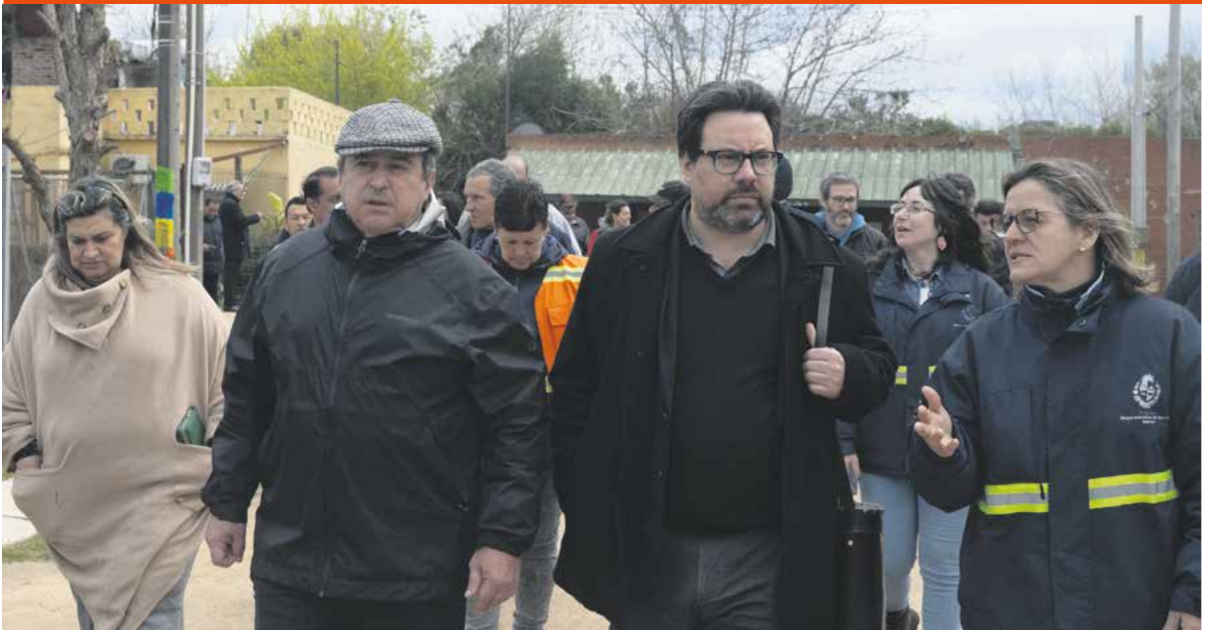
Firma de contrato para comienzo de obras en JUVENTUD 14. Setiembre, 2024.

Las intervenciones para regularizar la situación del lugar implican saneamiento, vialidad, drenajes pluviales, red de agua potable y mucho más. Todo esto “transformará muchas cuestiones de la vida diaria de las personas y traerá mejoras significativas al barrio”.