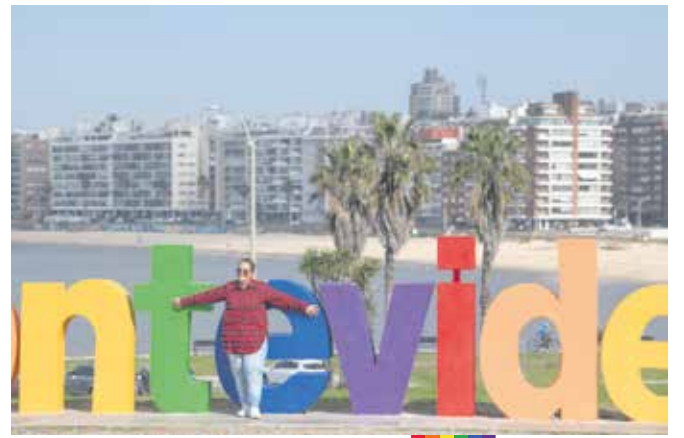
Intervención en cartel Montevideo en el marco del Mes de la Diversidad. Setiembre, 2024.

Durante los días que le quedan a setiembre, el arte y las instancias de intercambio seguirán siendo protagonistas de un mes que en su recta final tendrá la tradicional Marcha de la Diversidad, que se llevará a cabo el viernes 27 y, como cada año, convocará a miles de personas.