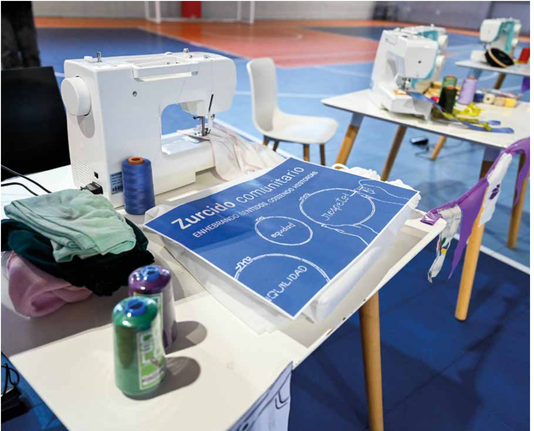
Zurcido solidario en el Crece Flor de Maroñas.

El Complejo Crece sigue sumando actividades que construyen el acervo cultural de Flor de Maroñas. Vecinos y vecinas participan de una actividad comunitaria.