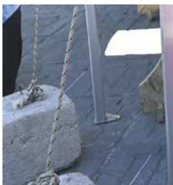
Actividad durante noviembre, Mes de la Lucha contra la Violencia de Género.

Yo a veces en broma digo que desde acá desde este edificio gigantesco en 18 de Julio no puedo tomar decisiones del semáforo de Casavalle. Yo puedo contribuir un poquito en esa decisión, pero es el vecino el que puede decirme mucho más. Y eso creo que fue parte de la impronta con la que hemos trabajado en todos los temas”.