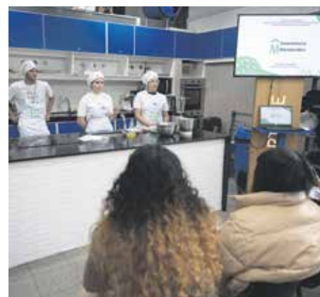
Taller de Cocina Uruguay en el MAM.

Cocina Uruguay, el programa de educación alimentaria de la Intendencia de Montevideo, sigue ofreciendo oportunidades para que las y los interesados puedan asistir a cursos y talleres gratuitos en los que licenciados en nutrición y cocineros comparten sus conocimientos sobre alimentación saludable. De esta forma, las personas tendrán más herramientas para mejorar sus hábitos en su vida diaria, además de llevarse un libro con más de 150 recetas fáciles, económicas y saludables.