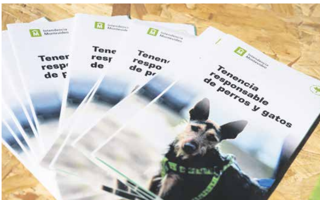
Presentación del portal Espacio Animal.