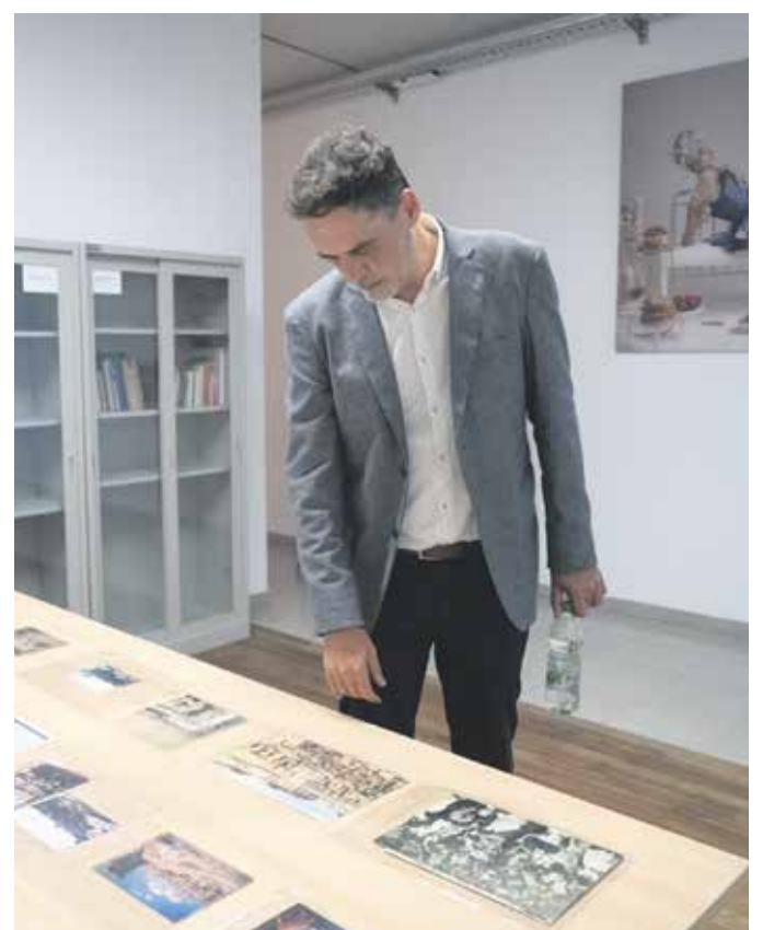
Inauguración de la Casa de la Memoria Ciudadana.

Uno de los aspectos fundamentales de este proyecto es su búsqueda por contribuir a transformar la idea que muchas veces tenemos sobre los archivos. Para lograrlo, se generó un espacio arquitectónicamente atractivo, accesible y con espacios luminosos que invitan a visitarlo. Esto apoya una propuesta dinámica y viva, en la que las personas no solo tendrán la posibilidad de consultar la documentación disponible, sino participar activamente de las diferentes actividades que allí se desarrollan.