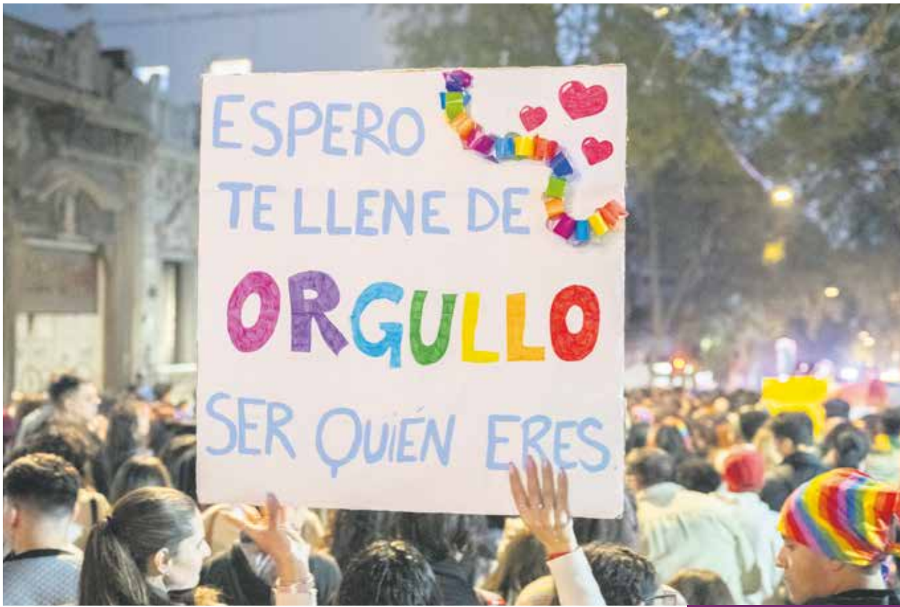
La promoción y la defensa de los derechos de las personas LGBTIQ+ serán protagonistas en el Centro.