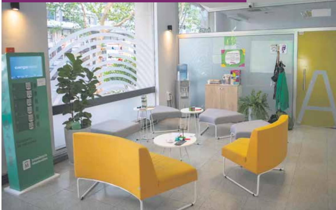
El Espacio Contás, que brinda atención en salud mental gratuita a jóvenes de 15 a 20 años.