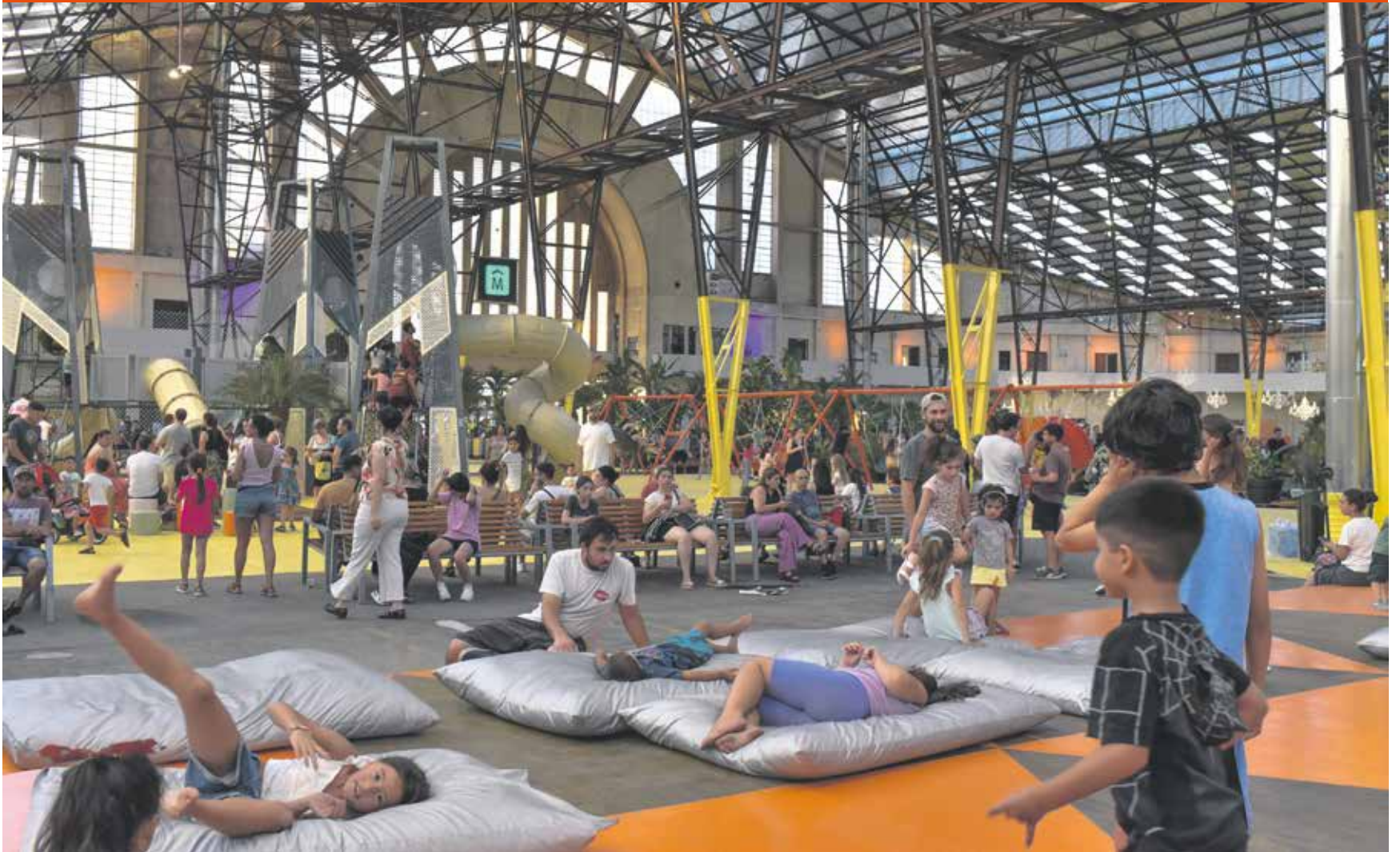
Actividad en el Espacio Modelo.

El Foro Urbano Mundial distinguió al Espacio Modelo por aportar al acceso universal a zonas verdes y espacios públicos seguros e inclusivos para las mujeres, niños, niñas, personas mayores y con discapacidad.