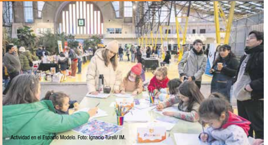
Actividad en el Espacio Modelo.

Dentro de la misma categoría, fueron premiados los siguientes proyectos: rehabilitación de espacios públicos en el centro histórico de Kalandia, Jerusalén Este, por Riwaq, Centro de Conservación Arquitectónica; el Parque Forestal Benjakitti en Bangkok, Tailandia por Turenscape + Arsomsilp Community and Environmental Architect; y el proyecto New Levee en el parque arqueológico de Wuyue por Office Off Course en Hangzhou, Zhejiang, República de China.