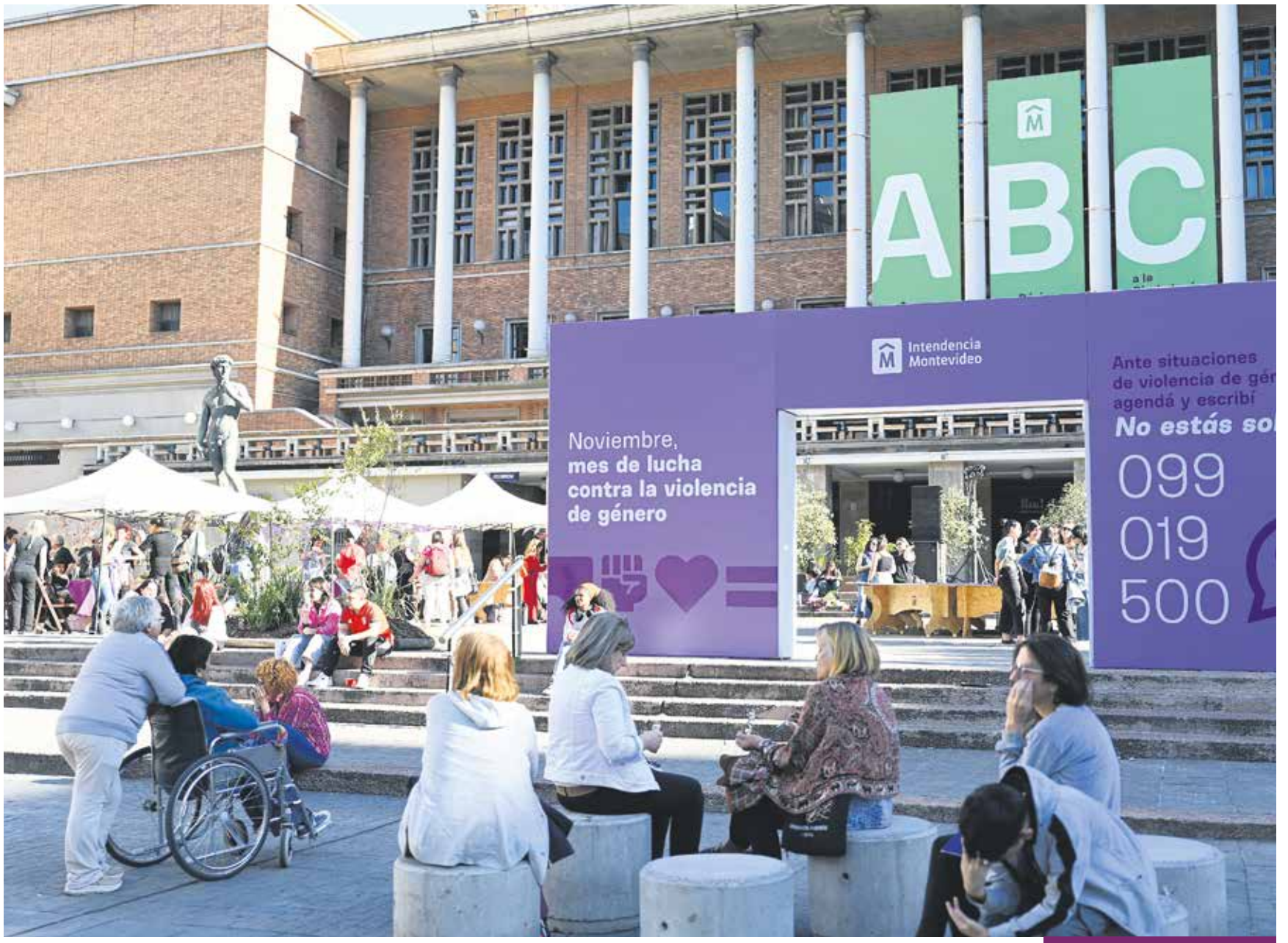
Actividad durante noviembre, Mes de la Lucha contra la Violencia de Género.

Montevideo refuerza su compromiso y la respuesta. Actualmente abarca todo el territorio de Montevideo, involucra a diversas áreas de la Intendencia y despliega servicios para la ciudadanía y para el funcionariado interno de la IM y municipios.