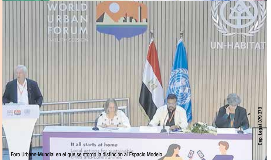
Foro Urbano Mundial en el que se otorgó la distinción al Espacio Modelo.