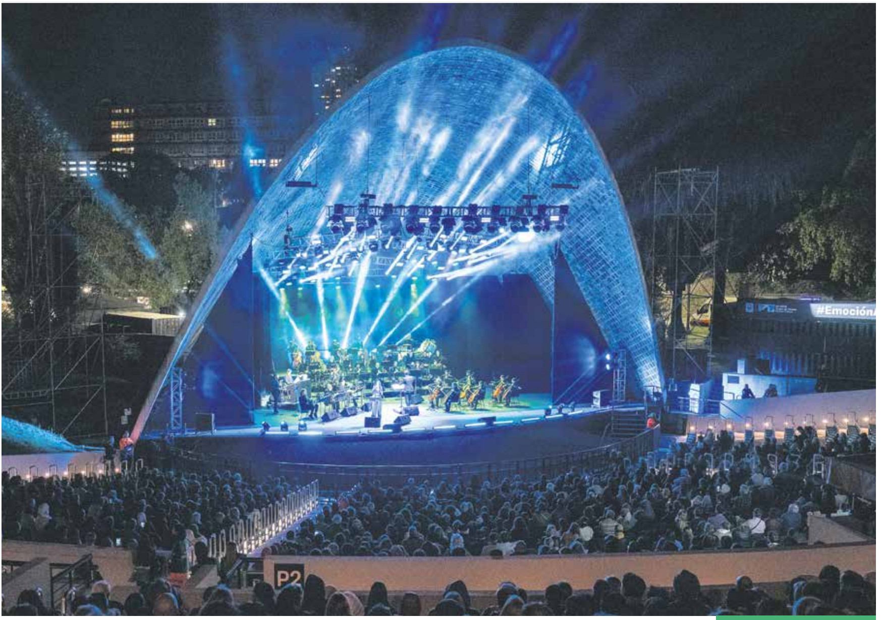
Inauguración de la segunda etapa de obras en el Teatro de Verano.

Fueron inauguradas las mejoras de la segunda etapa de obras: se creó una nueva bandeja superior, se instalaron butacas en todo el recinto y el aforo creció 1.000 localidades, entre otras intervenciones para mejorar la experiencia de quienes lo visitan. Miles de personas disfrutaron del espectáculo “Tangazo”, que reunió a la Banda Sinfónica con varios referentes de la música nacional.