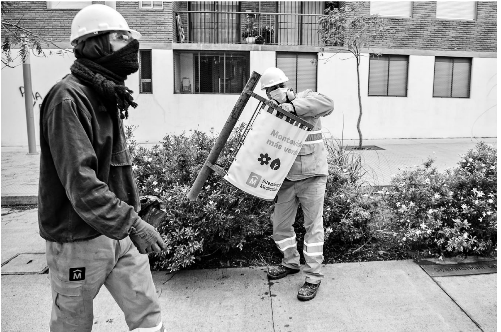
Retiro de papeleras en Plaza y memorial José "Pepe" D' Elía, 10 de agosto de 2021.