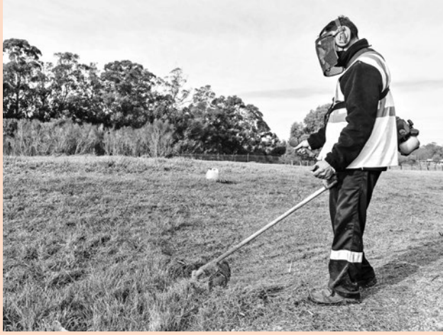
Cuadrilla de trabajo del Programa ABC Trabajo en el Parque Lecocq, 2 de julio de 2021.