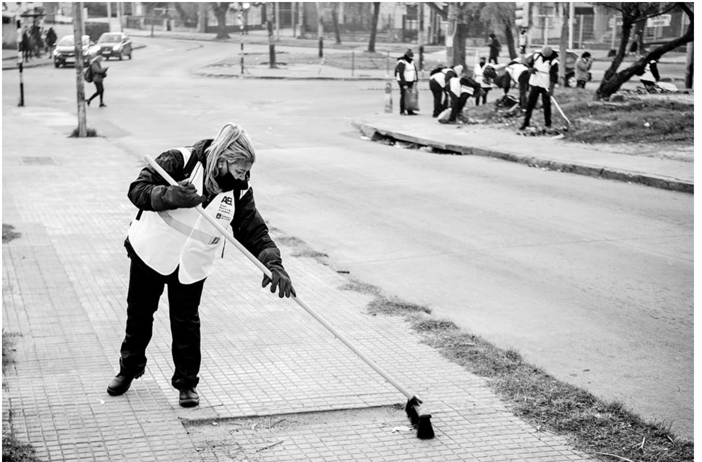
Cuadrilla de limpieza del Programa ABC Trabajo en la Calle Iguá, 18 de junio de 2021.

También se habilitarán alturas excepcionales mayores a 31 metros en predios de más de 30