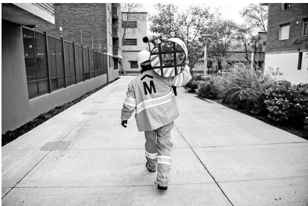
Retiro de papeleras en Plaza y memorial José "Pepe" D' Elía, 10 de agosto de 2021.