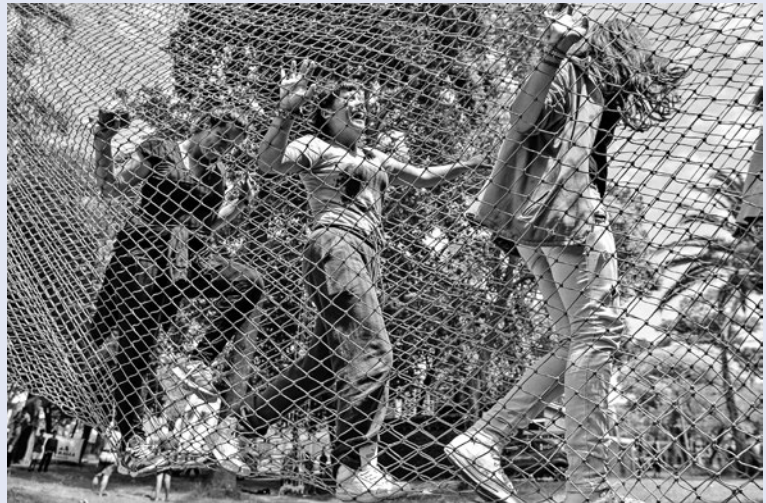
Día de recreación de jóvenes en Cambadu, 30 de enero de 2018.

También coordinamos con el MAM, que viene trabajando desde hace varios años el Día del Niño, como una forma de promocionar las actividades del Mercado y enviar un mensaje solidario a través de la recolec-