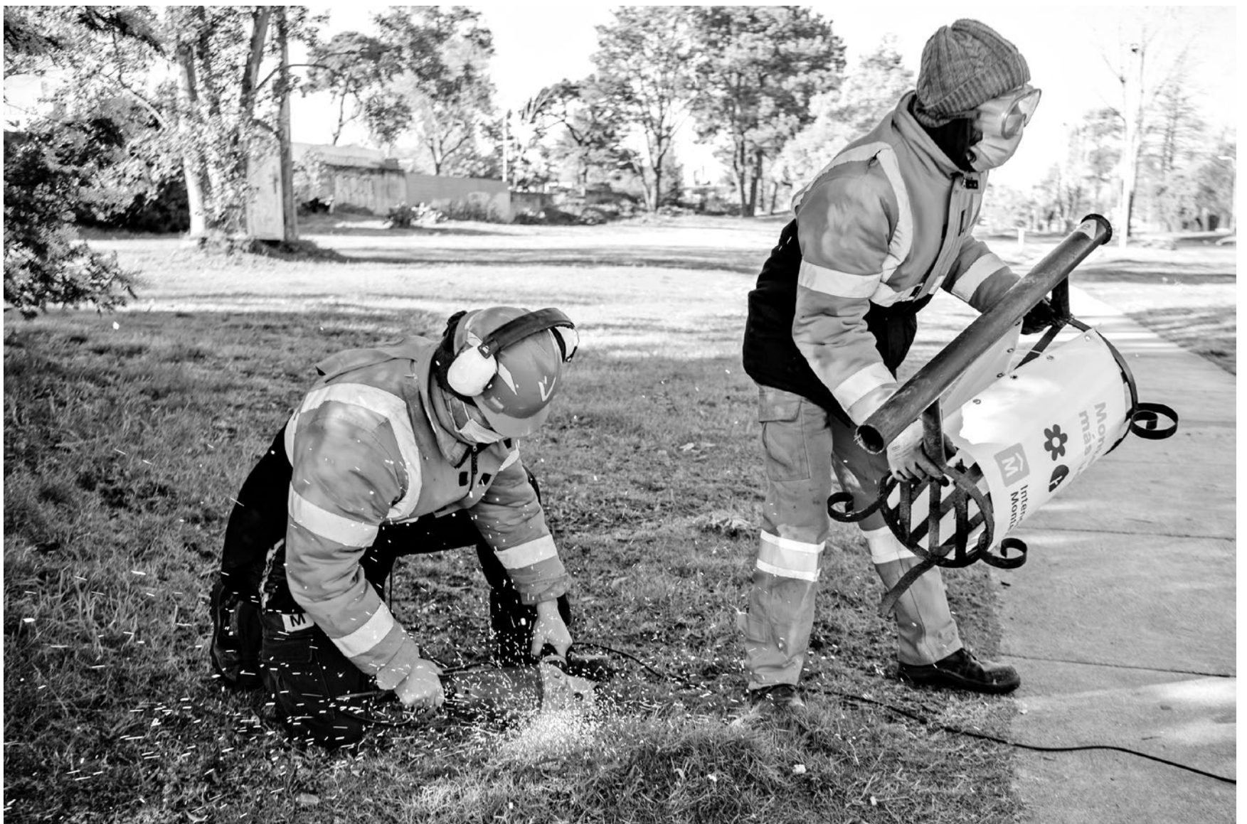
Retiro de papeleras en Plaza Santa Mónica, 11 de agosto de 2021.

Un proyecto para “la Montevideo del Siglo XXI”