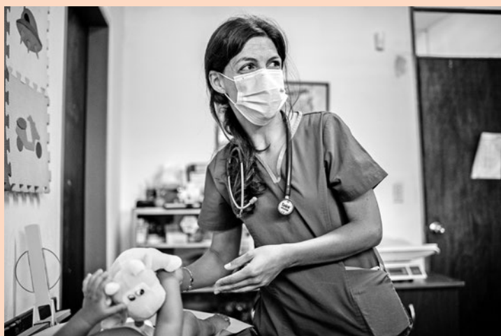
Policlínica Aquiles Lanza, 10 de marzo de 2021.

“El comercio de cercanía es muy receptivo a este tipo de proyectos porque ve la realidad de los barrios. Son miles de negocios y generadores de gran cantidad de puestos de trabajo, porque también existe un canal de distribución que representa una fuente ingreso para mucha gente”.