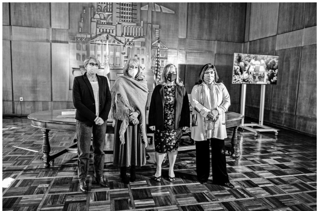
Conferencia de prensa por premio al Museo Juan Manuel Blanes en coordinación con la Embajada de EEUU, 11 de agosto de 2021.

El museo Blanes recibirá US$ 250.000 para financiar un proyecto de conservación de su casa, tras resultar seleccionado en el Fondo del Embajador para la Preservación del Patrimonio Cultural.