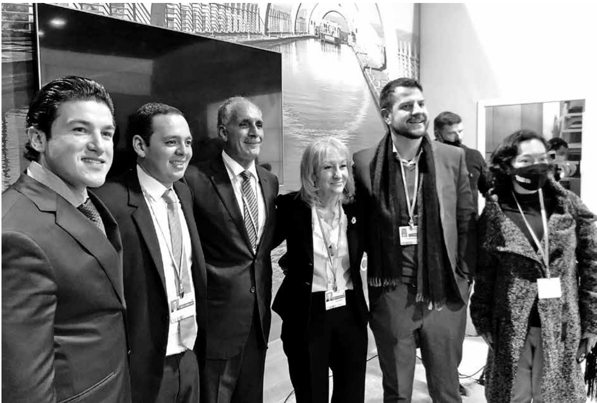
Intendenta de Montevideo Carolina Cosse participa en Conferencia sobre Cambio Climático COP 26 en Glasgow, 3 de noviembre de 2021.