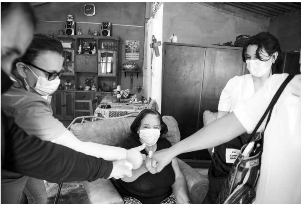
Policlínica móvil en Municipio D en el marco del Plan ABC, 18 de octubre de 2021.

Las policlínicas móviles del Plan ABC recorren los barrios de la ciudad con servicio de vacunación, consulta médica y enfermería.