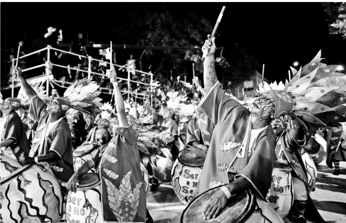
Desfile de llamadas, 17 de febrero de 2020.