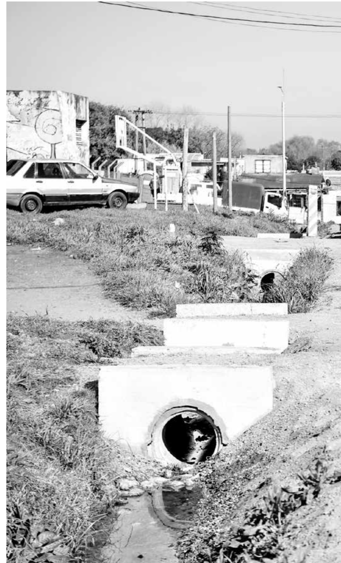
Asfaltado en calle Dr. Ernesto Quintela en el marco del Plan ABC, 30 de agosto de 2021.

"En los barrios hay organizaciones fragmentadas, eso les quita fuerza para enfrentar los problemas comunes. Si logramos unir las, la IM conseguirá interlocutores válidos para ejecutar las políticas".