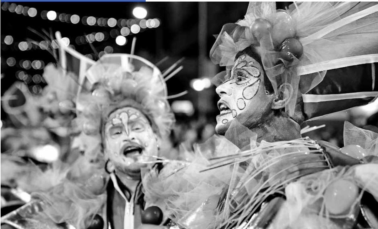
Desfile inaugural del Carnaval 2020, 11 de marzo de 2020.

A Toda Costa (murga) Son Delirante (murga) C 1080 (comparsa) Zíngaros (parodistas) La Cayetana (murga)