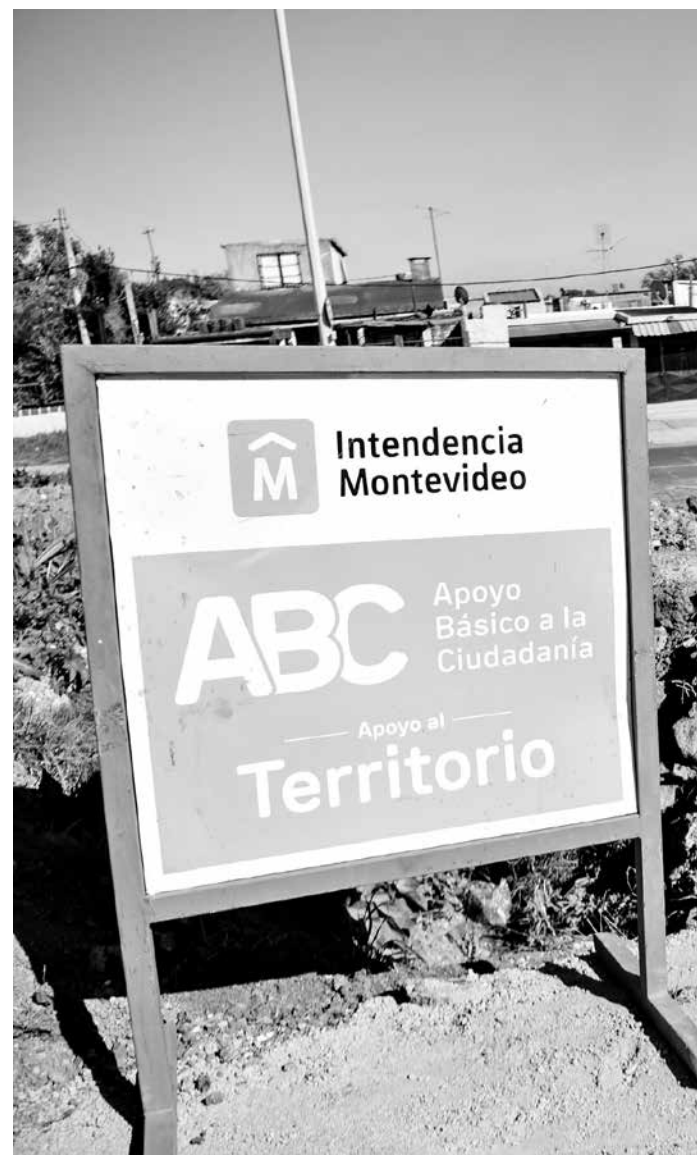
Asfaltado en calle Dr. Ernesto Quintela en el marco del Plan ABC, 30 de agosto de 2021.