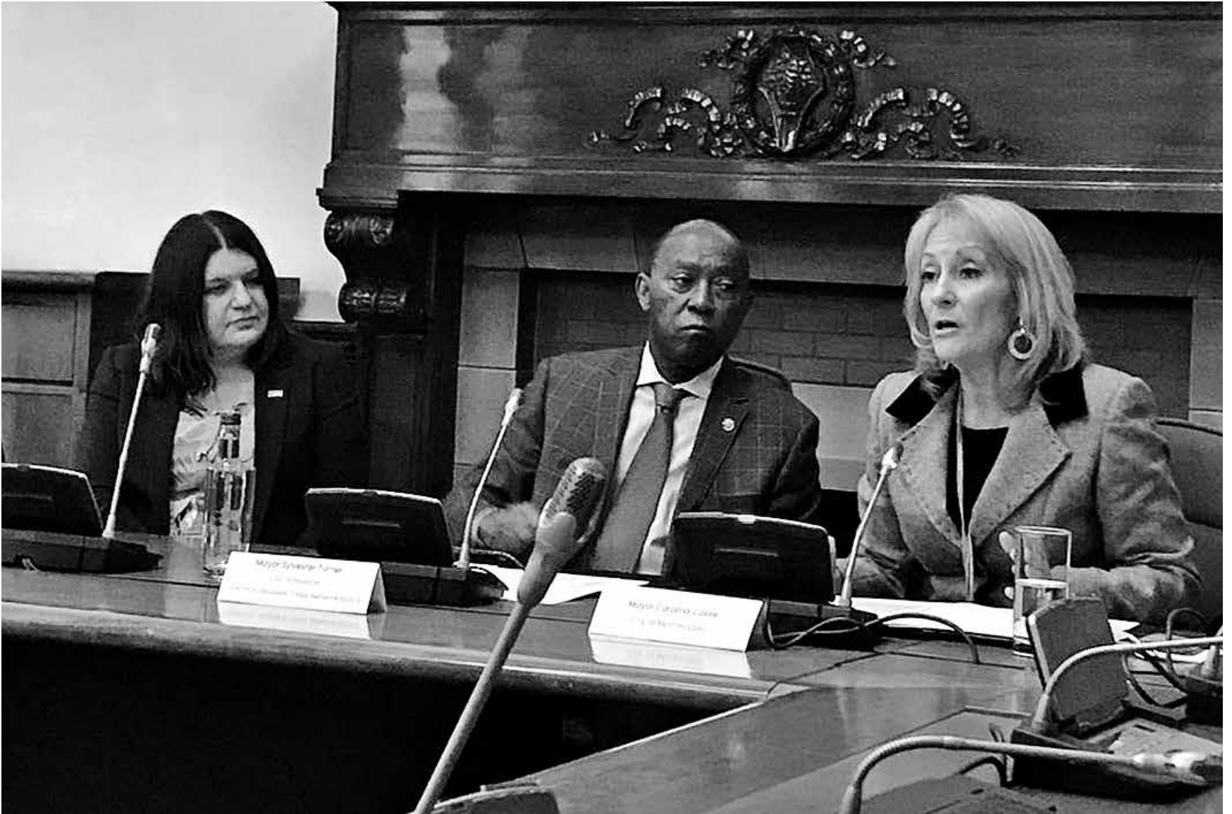
Intendenta de Montevideo Carolina Cosse participa en Conferencia sobre Cambio Climático COP 26 en Glasgow, 3 de noviembre de 2021.