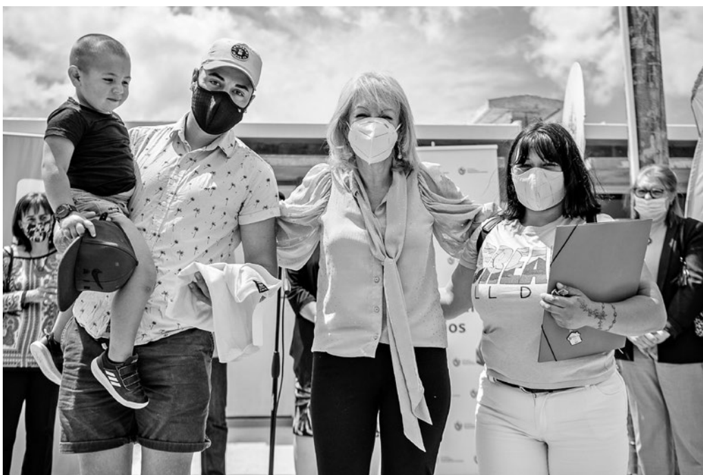
Entrega de viviendas barrio Cauceglia.

El trabajo conjunto de la Intendencia de Montevideo y el Ministerio de Vivienda y Ordenamiento Territorial (MVOT), permitió que cinco familias puedan disfrutar de su nueva vivienda en el barrio Cauceglia.