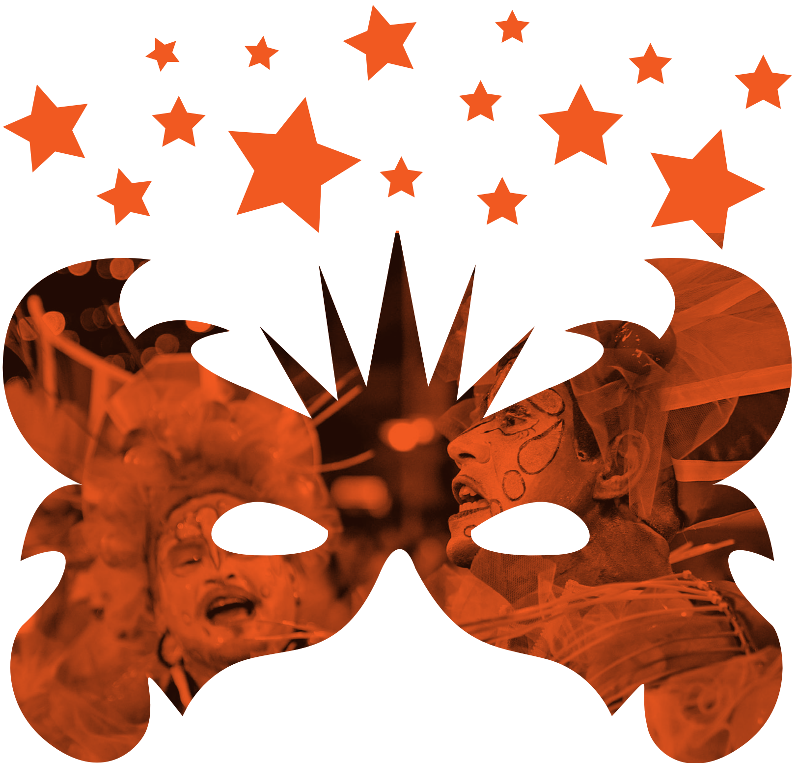
Desfile de llamadas, 17 de febrero de 2020.

La Intendencia de Montevideo definió las acciones en beneficio de la ciudadanía que desplegará a través del Plan ABC para el Carnaval 2022, denominado Carnaval ABC.