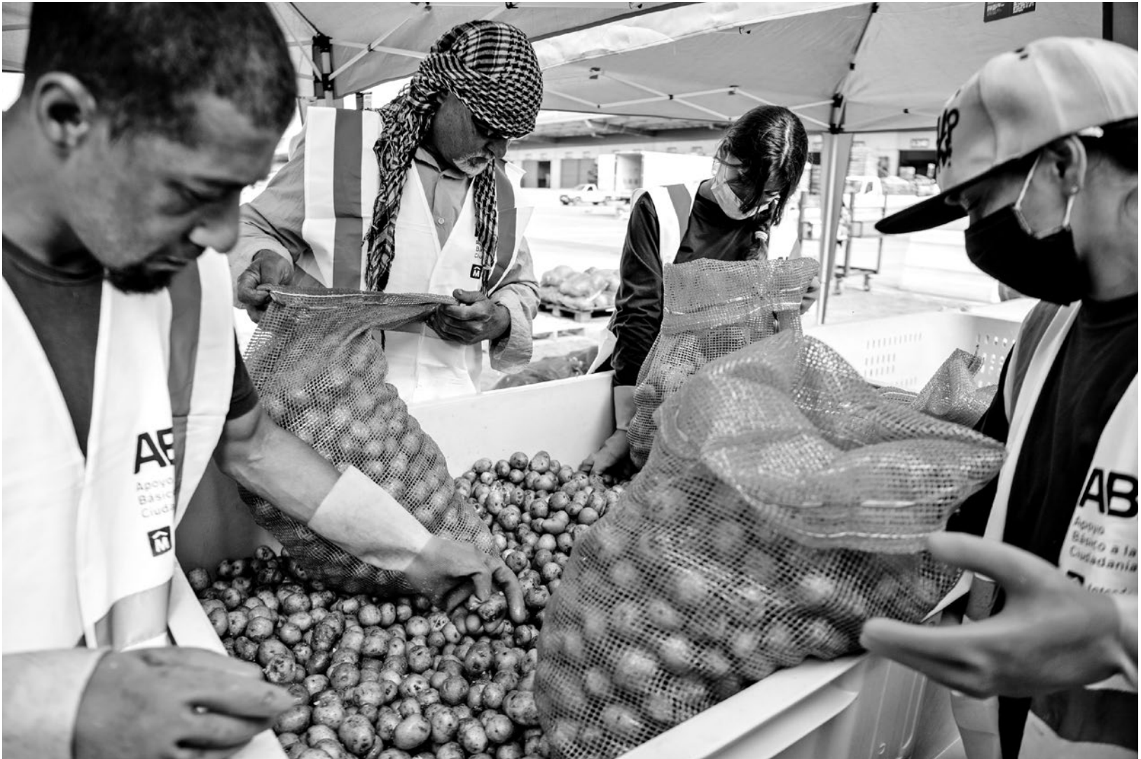
Recuperación de alimentos en la Unidad Agroalimentaria Metropolitana, 9 de noviembre de 2021.