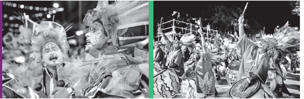
Desfile inaugural del Carnaval 2020, 11 de marzo de 2020.