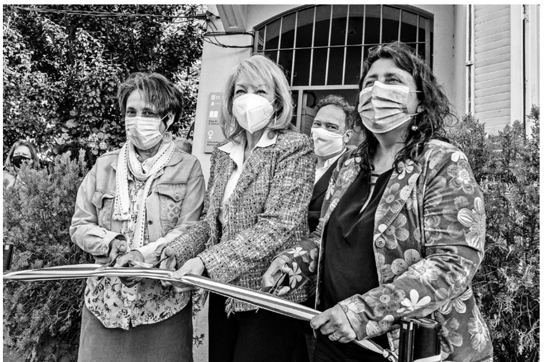
Inauguración Comuna Mujer C.

Se inauguró la Comuna Mujer C para asistir a las mujeres de cuatro barrios de Montevideo y seguir sumando esfuerzos en la lucha contra la violencia doméstica y de género.