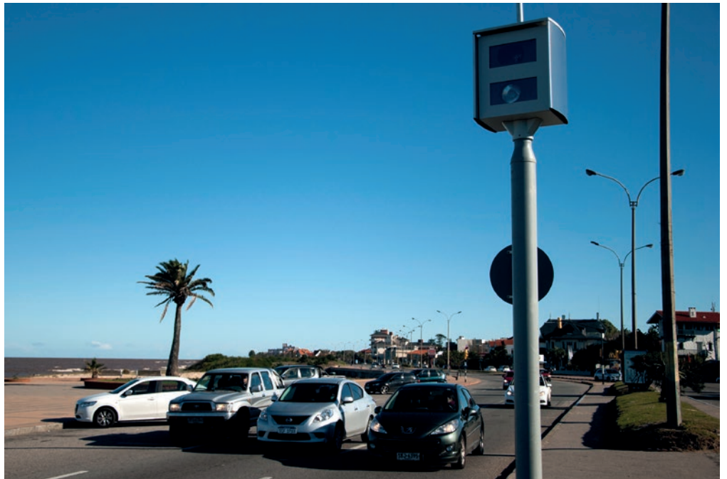
Rambla y Costa Rica, 23 de marzo del 2017.