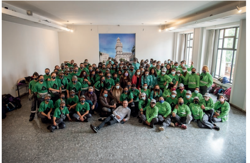
Lanzamiento de la 20ª edición del Barrido Inclusivo 2021-2022, 29 de noviembre del 2021.

"En esas propuestas hay de todo, realidades y prioridades distintas. Algunas están centradas en generar más espacios públicos, otras apuntan a proyectos socioculturales, también hay iniciativas para la reconstrucción de la memoria histórica, o que solicitan el reconocimiento de personas o temáticas. También hay algunas sobre obras de infraestructura muy concreta, como la solicitud de semáforos, y muchas propuestas vinculadas a lo deportivo. Otro aspecto para destacar son las propuestas sobre la utilización de los espacios públicos por parte de las nuevas generaciones, para que no estemos pensando siempre desde el mundo adulto. Las propuestas son tan diversas como Montevideo", concluyó.