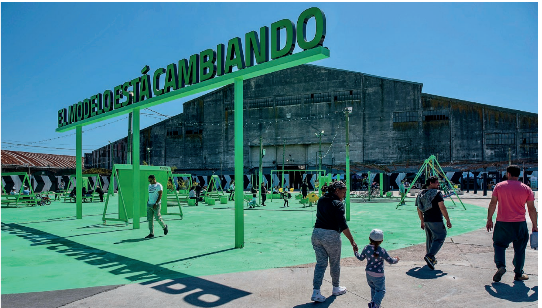
Actividades en el Mercado Modelo, 12 de octubre del 2021.