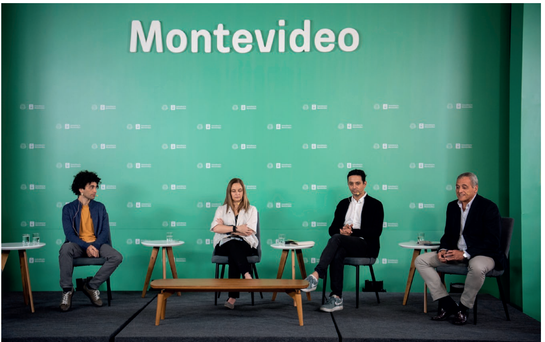
Encuentro de Ciudades Inteligentes 2021, 1 de diciembre del 2021.

Montevideo API abre las puertas a ideas innovadoras para servicios digitales y prototipos de aplicaciones. Esta semana se entregaron los premios a los proyectos que resultaron ganadores de este desafío a la creatividad.