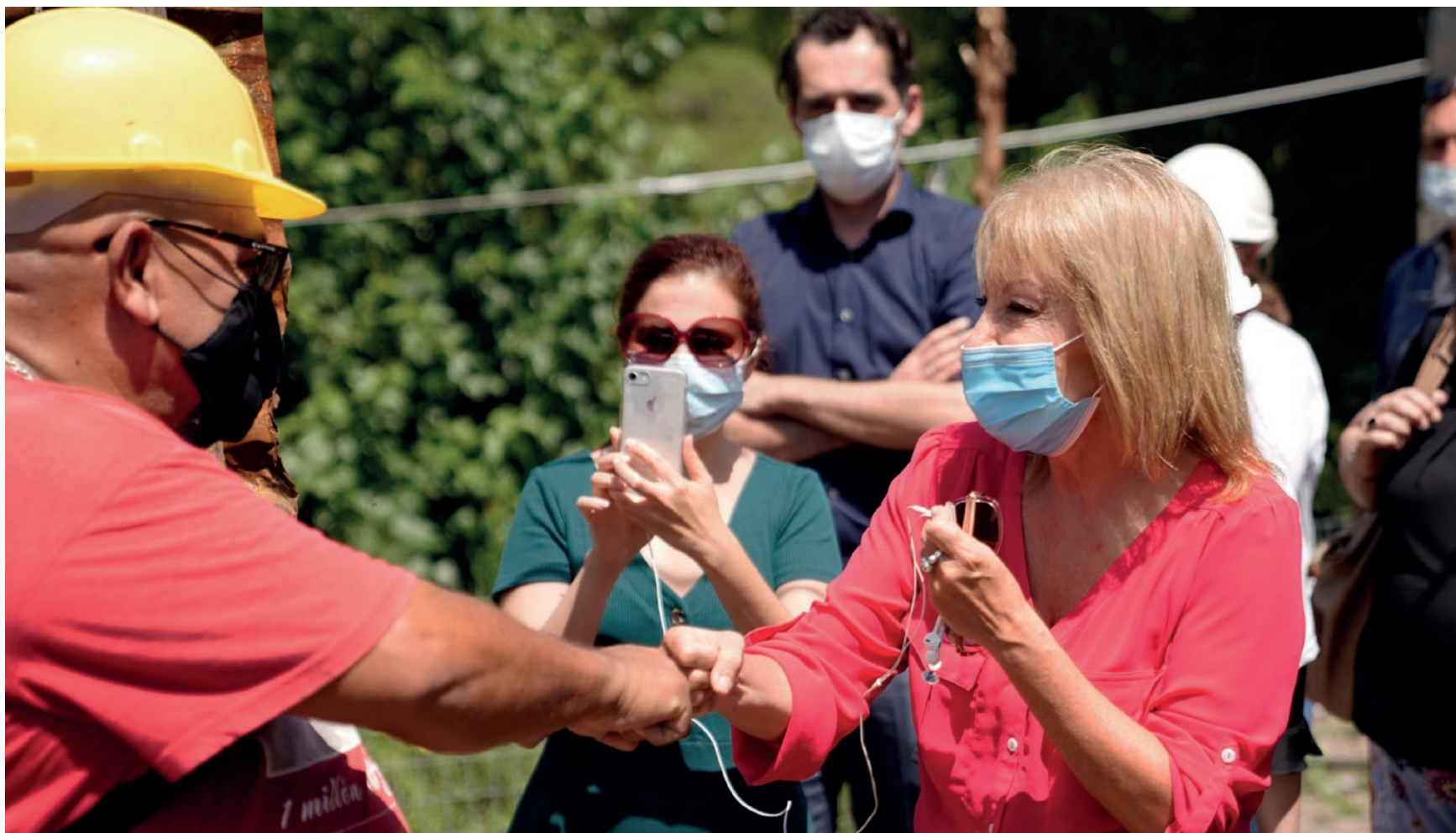
Recorrida de la Intendencia por el barrio Antares, 19 de febrero del 2021.