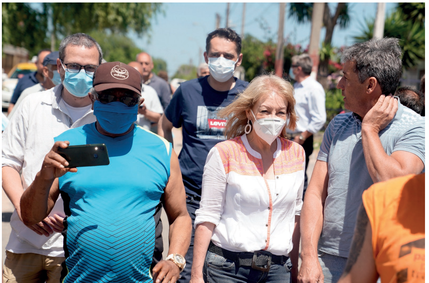
Recorrida por barrio El Tobogán en el marco del Plan ABC, 27 de noviembre del 2021.