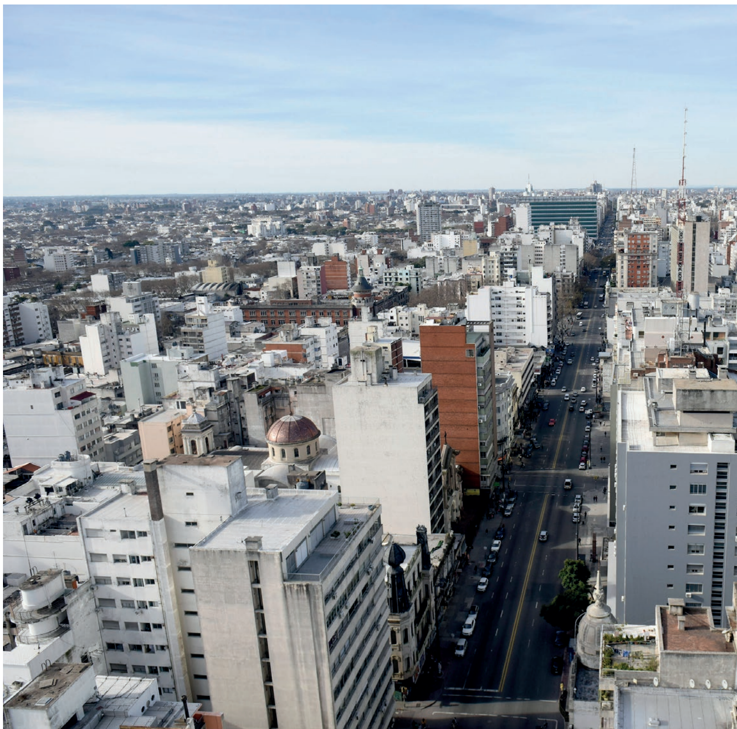
Vista aérea de Montevideo, 18 de agosto del 2020.

Se apunta especialmente a la disminución de los heridos graves y fallecidos que se transporten en motocicletas al momento del siniestro, dentro de la ciudad de Montevideo.