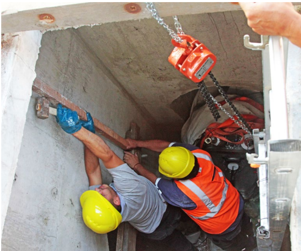
Recorrida por Obras en Red Arteaga, 11 de febrero de 2020.

En su apuesta por seguir construyendo una Montevideo más Verde, la IM inició el lunes 2 de mayo un proyecto que demandará una inversión de unos $4.000.000.