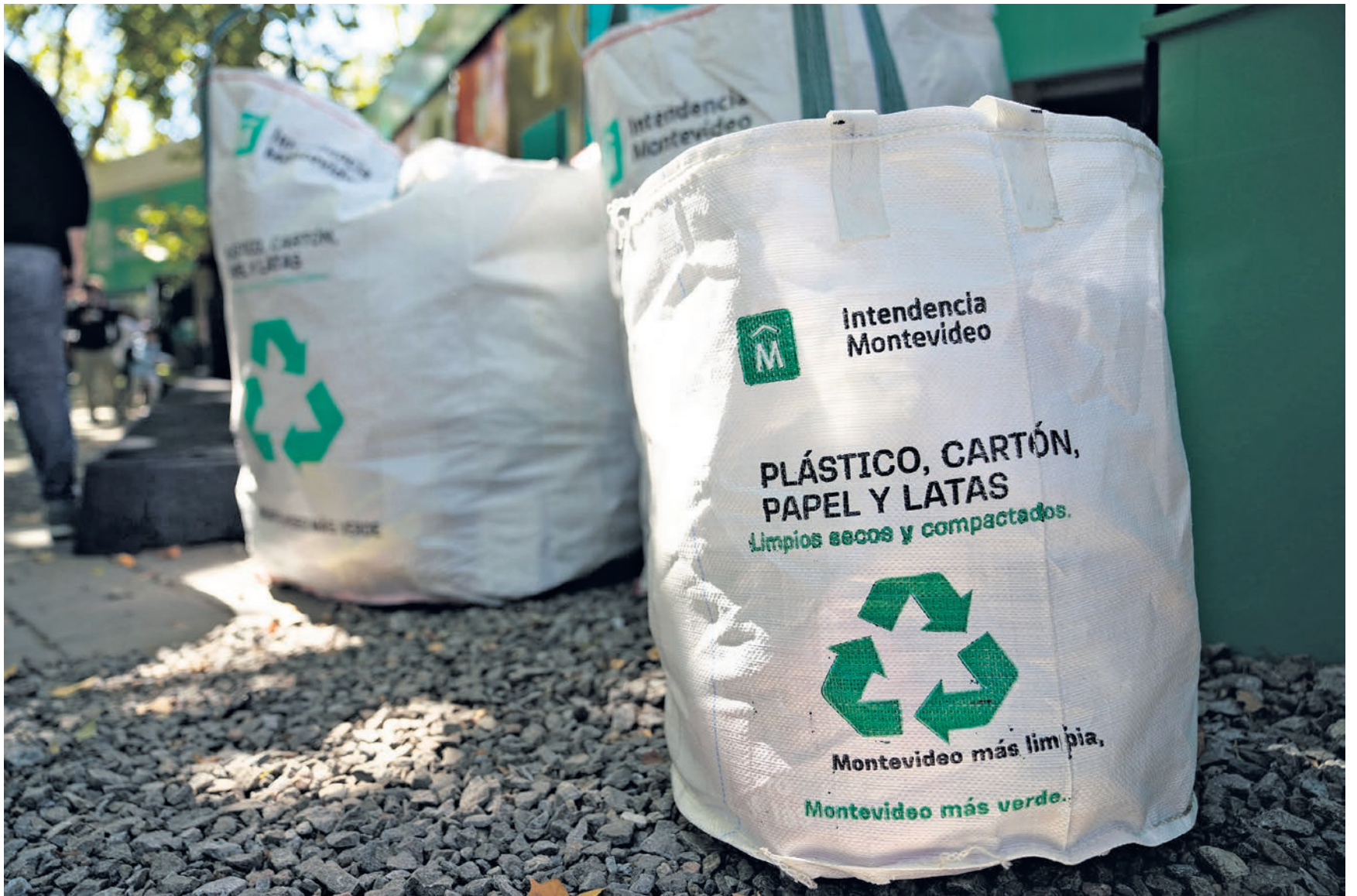
Bolsones especiales, 15 de abril de 2022.