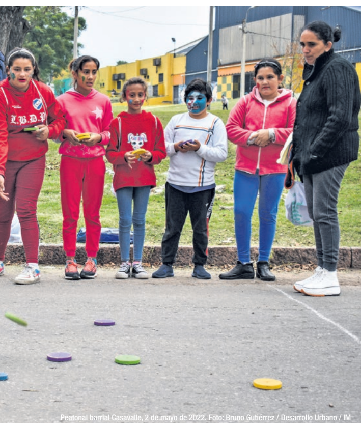
Peatonal barrial Casavalle, 2 de mayo de 2022.