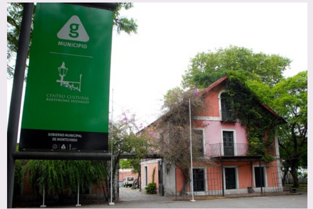
Municipio G,9 marzo de 2016.

El Centro de Gestión de Movilidad monitorea el tránsito con las cámaras disponibles en rambla Tomás Berreta y Rafael Barradas; también se ajustarán los planes semafóricos de los cruces del hotel Carrasco y de Tomás Berreta y Rafael Barradas, ambos semáforos centralizados.