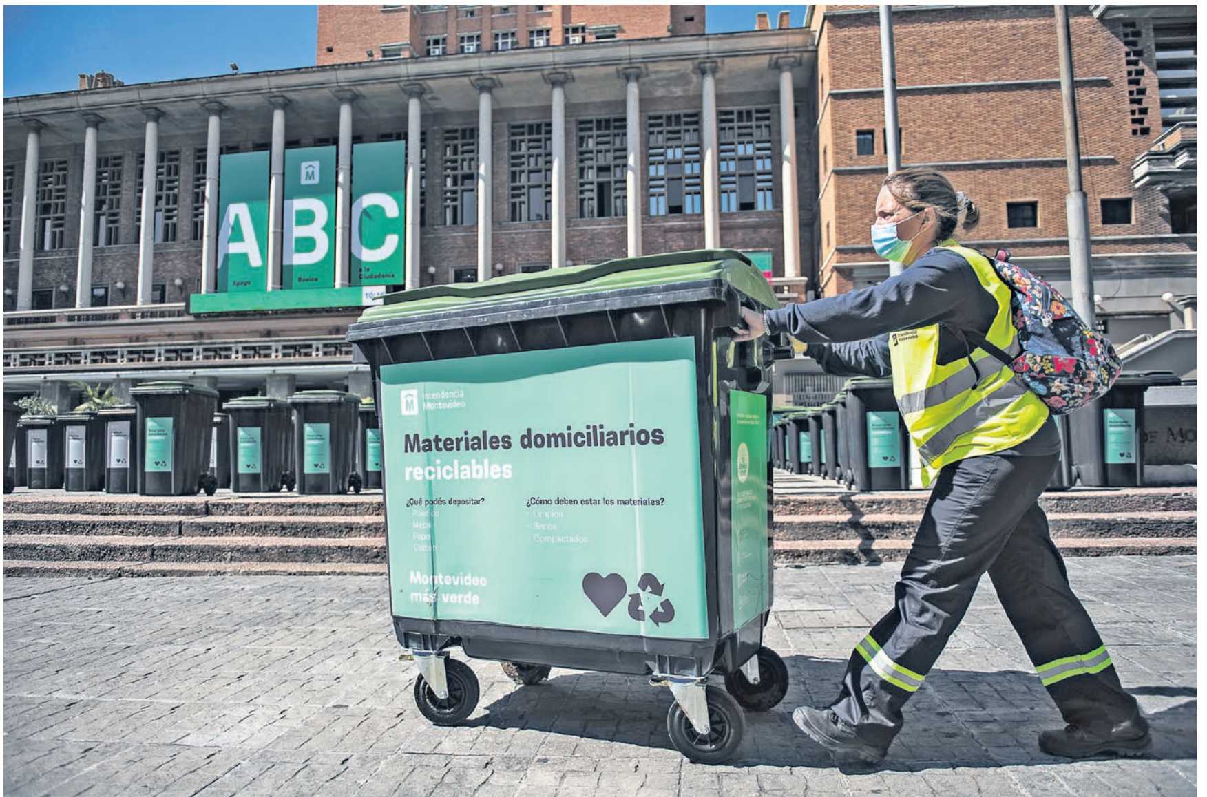
Lanzamiento del programa "Reciclando Barrio a Barrio" en la explanada de la Intendencia de Montevideo, 9 de febrero de 2022.