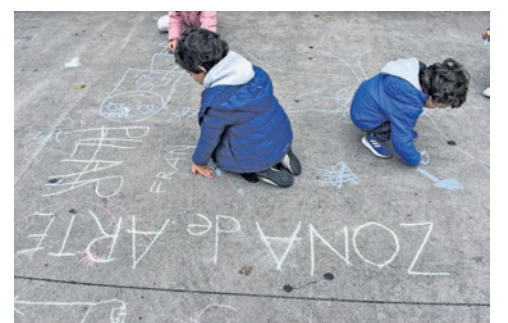
Peatonal barrial Punta Gorda , 2 de mayo de 2022.

José Cañas (calle 20) entre continuación Austria y continuación Rusia de 15 a 19 horas.