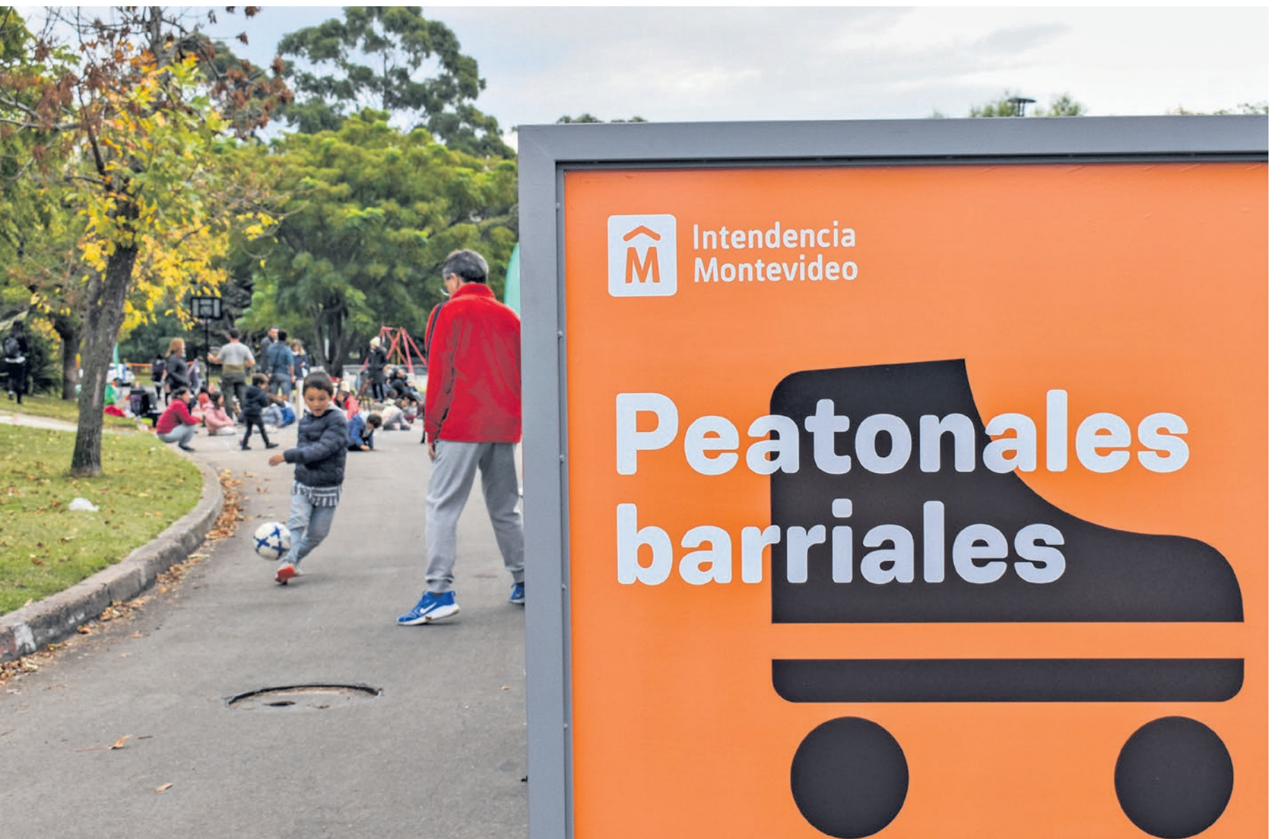
Peatonal barrial Punta Gorda , 2 de mayo de 2022.

Casavalle y Punta Gorda fueron los primeros en recibir una propuesta que recorrerá 24 puntos de Montevideo para democratizar el uso de los espacios públicos.