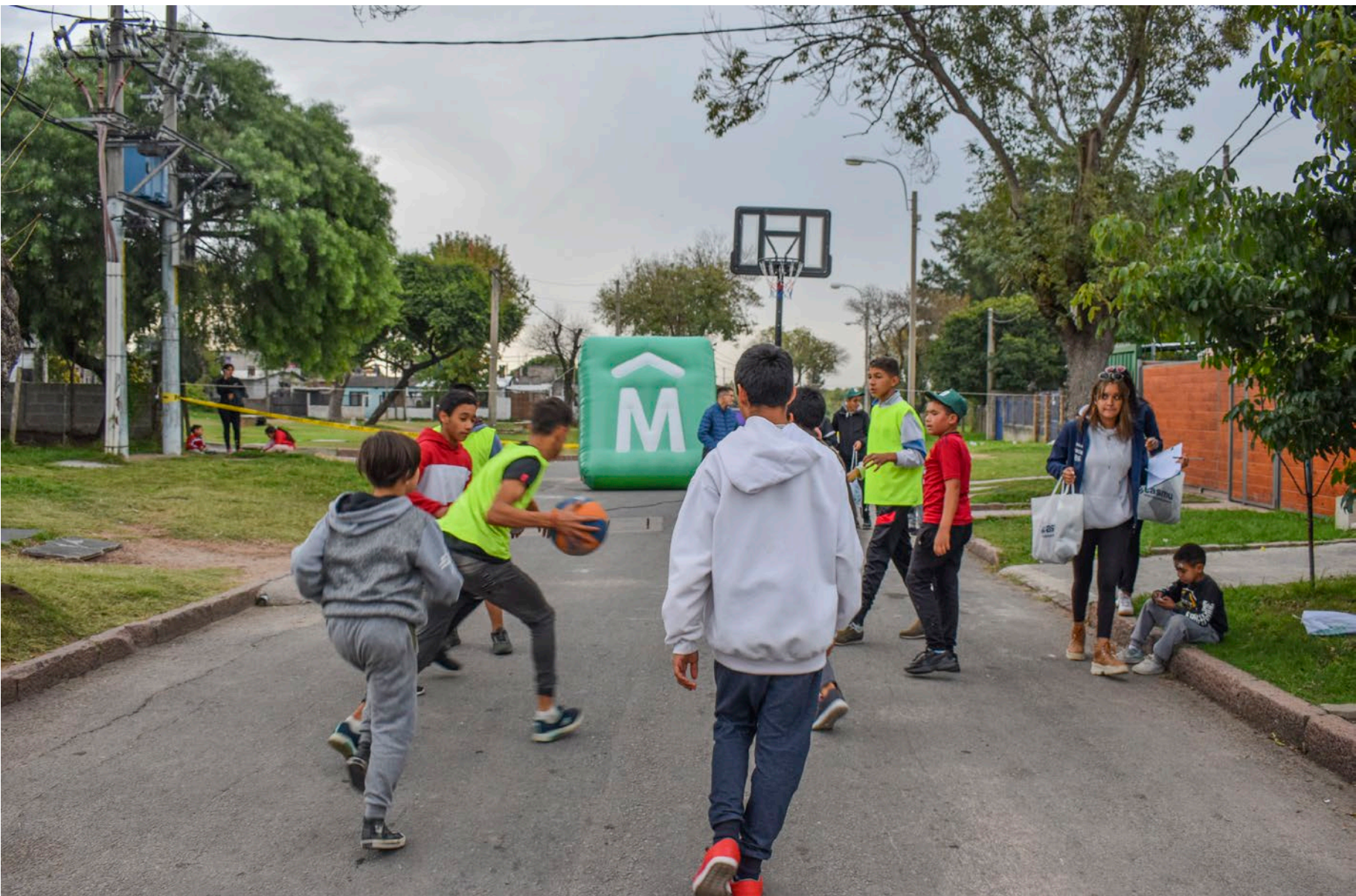
Peatonal barrial Casavalle, 2 de mayo de 2022.