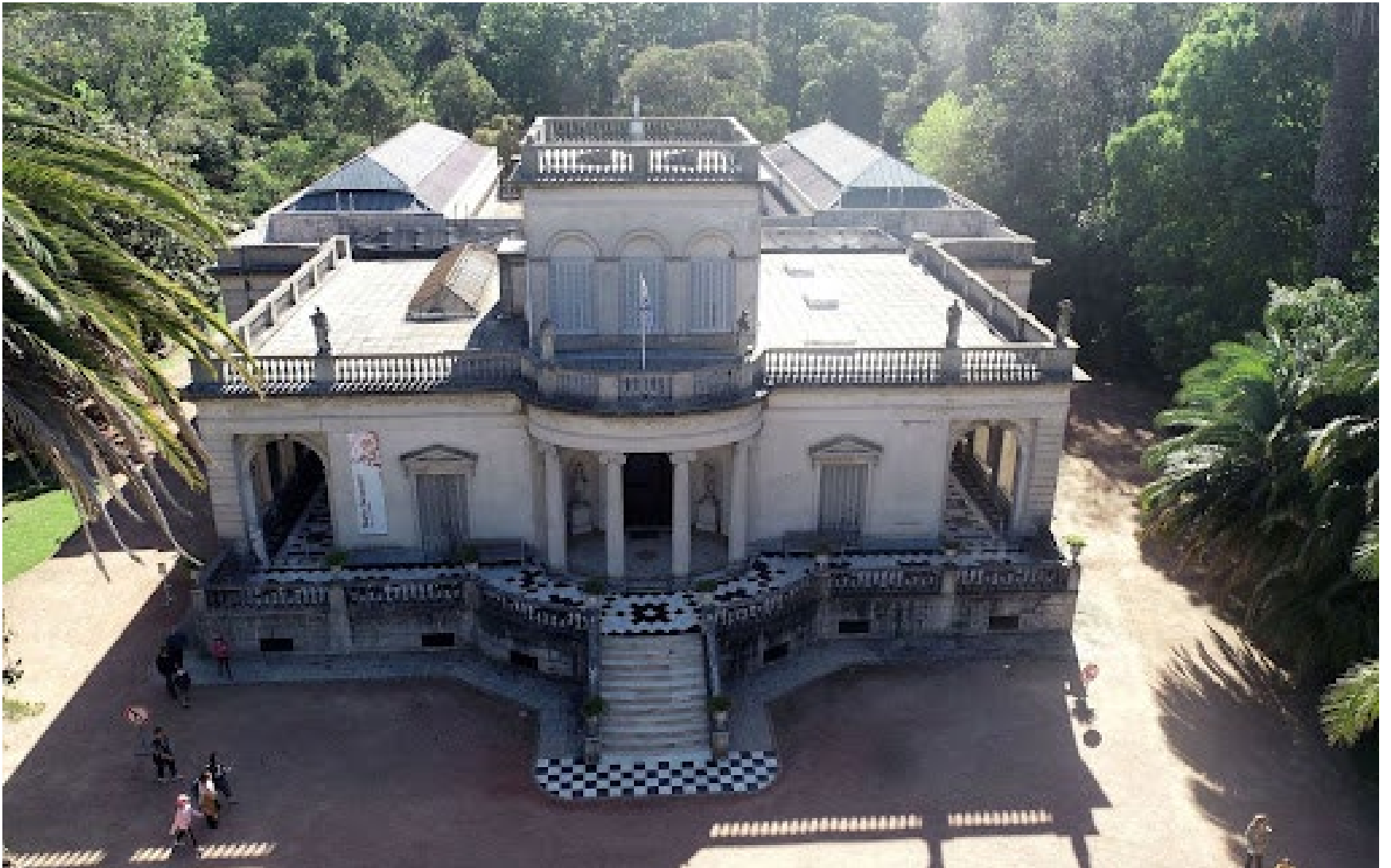
Museo de Bellas Artes Juan Manuel Blanes, 20 de agosto de 2021.