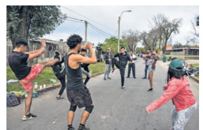
Peatonal barrial Casavalle, 2 de mayo de 2022.