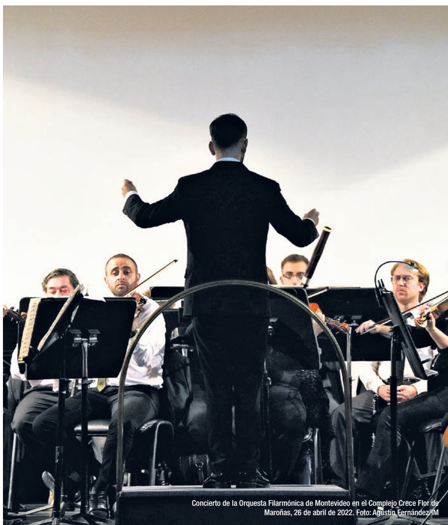
Concierto de la Orquesta Filarmónica de Montevideo en el Complejo Crece Flor de Maroñas, 26 de abril de 2022.