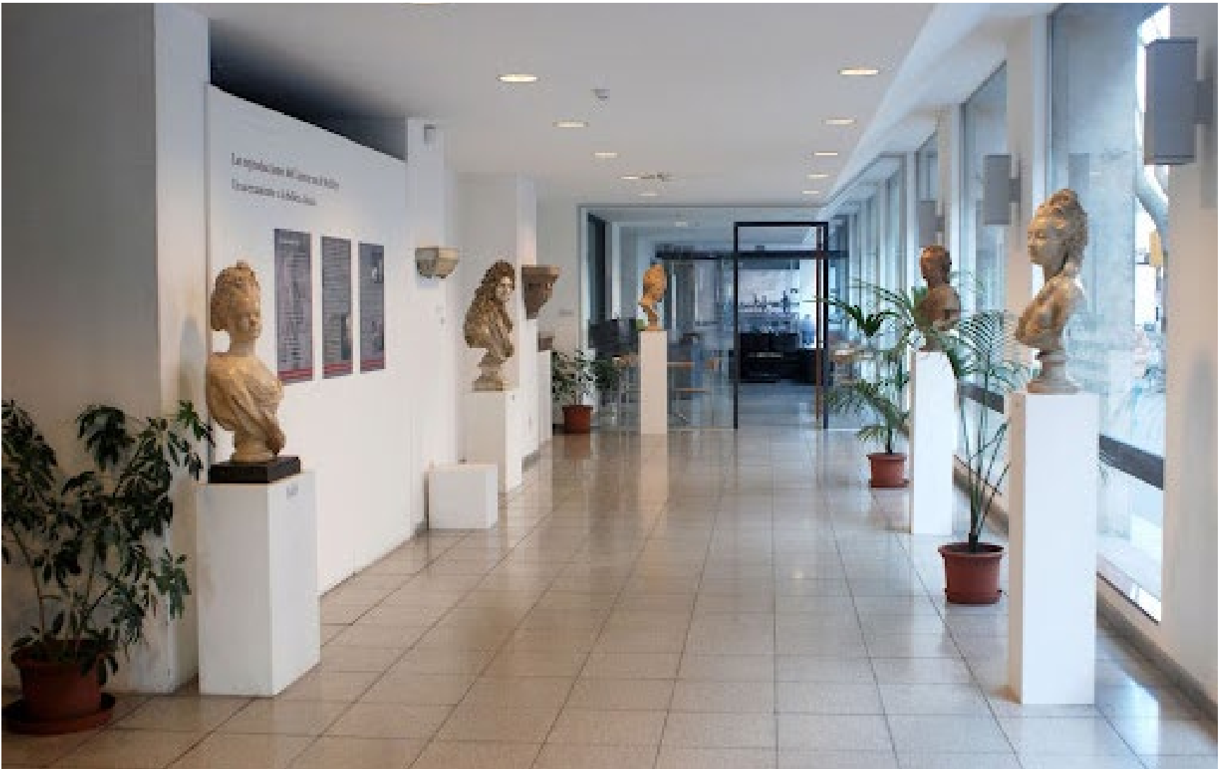
Museo de Historia del Arte, 16 de diciembre de 2014.