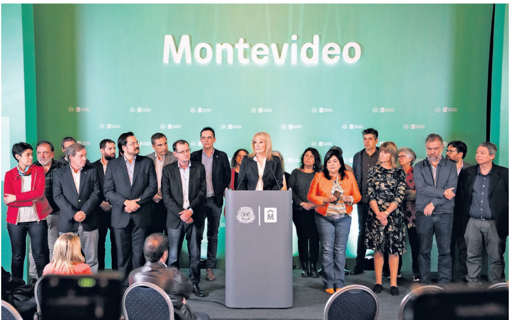
Conferencia de prensa sobre préstamo BID para limpieza y saneamiento, 21 de abril 2022.

El trabajo por una Montevideo Más Verde, más limpia y saludable no se detiene