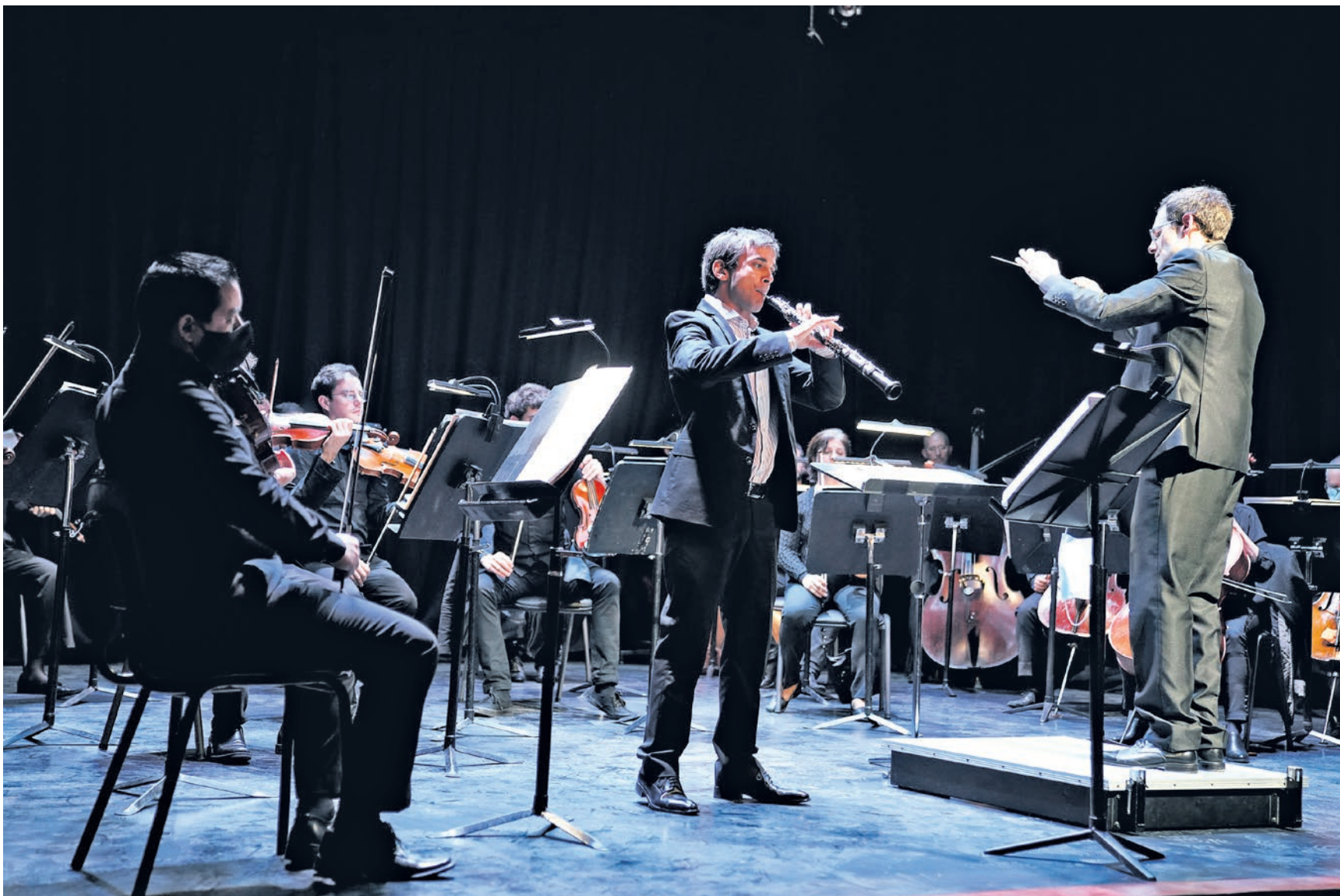
Concierto de la Orquesta Filarmónica de Montevideo en el Centro Cultural Artesano, 28 de setiembre de 2021.