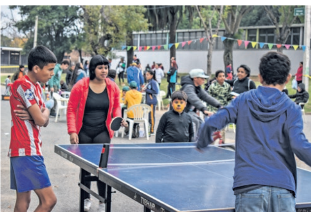
Peatonal barrial Casavalle, 2 de mayo de 2022.

Las calles Arroyo Torres (Punta Gorda) y Chicago (Casavalle) se revitalizaron el pasado fin de semana, cuando se transformaron en peatonales por varias horas. Durante ese lapso, vecinos y vecinas se apropiaron del espacio, disfrutándolo al máximo gracias a las múltiples propuestas deportivas y recreativas. Básquetbol, tejo, exhibiciones de artes marciales,