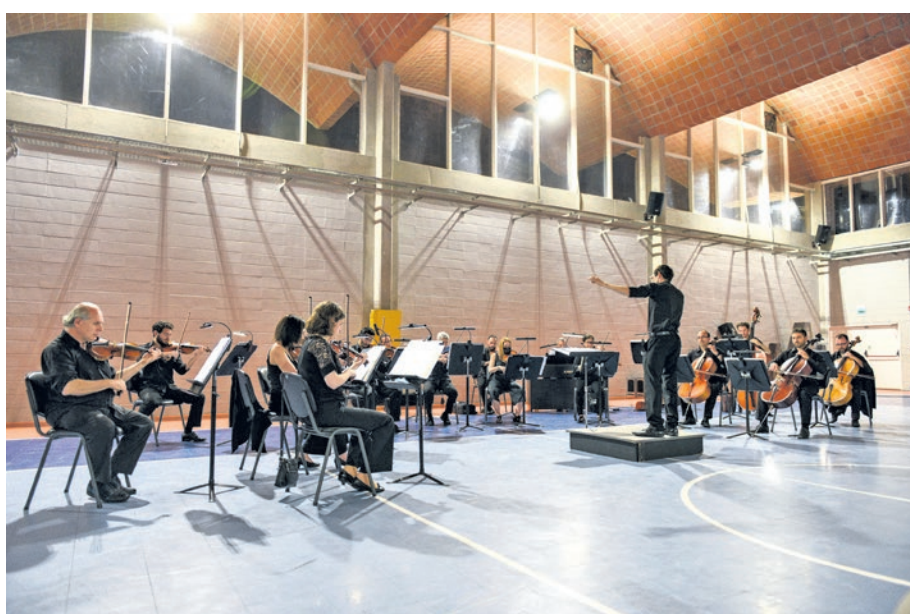
Concierto descentralizado de la Orquesta Filarmónica de Montevideo, 28 de octubre de 2021.

Las entradas pueden comprarse a través de Tickantel o en la boletería del teatro, que funciona de 15 a 19 horas.