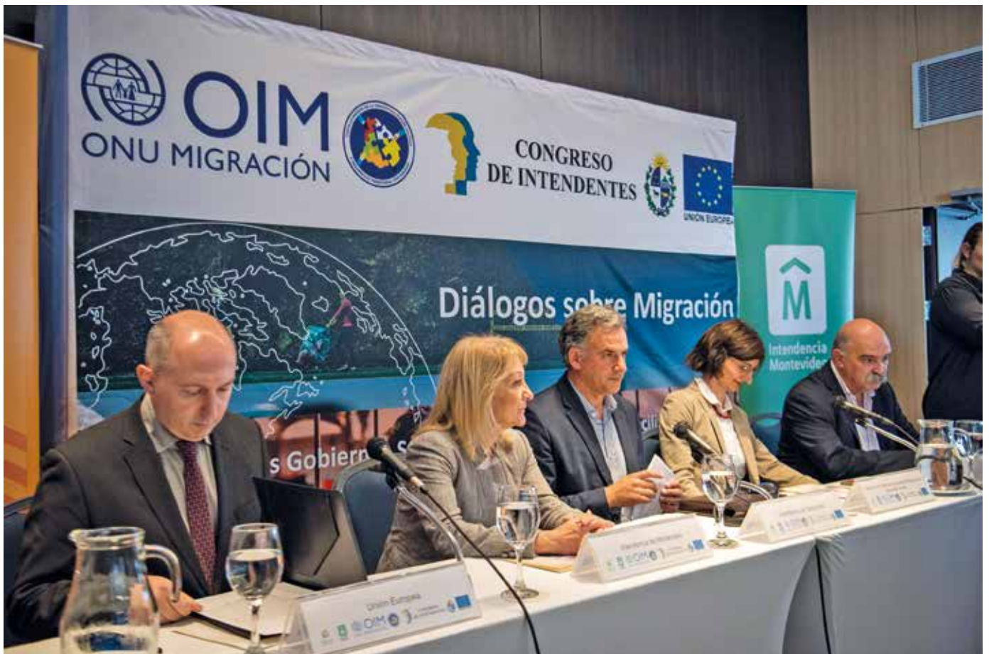
Seminario sobre poblaciones migrantes en el Hotel Hampton, 12 de setiembre de 2022.