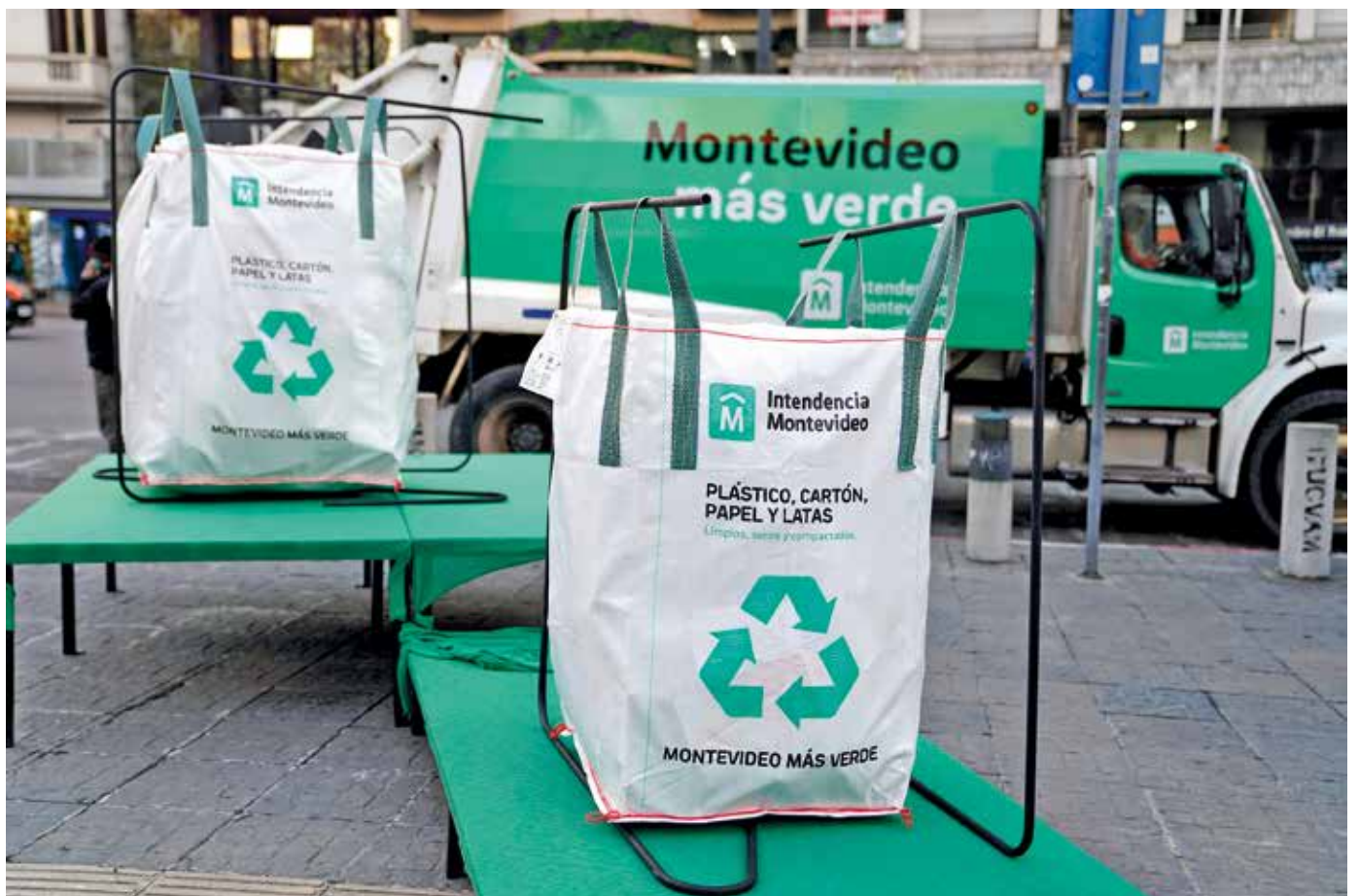
Presentación del nuevo equipamiento de Montevideo más verde, 14 de mayo de 2021.