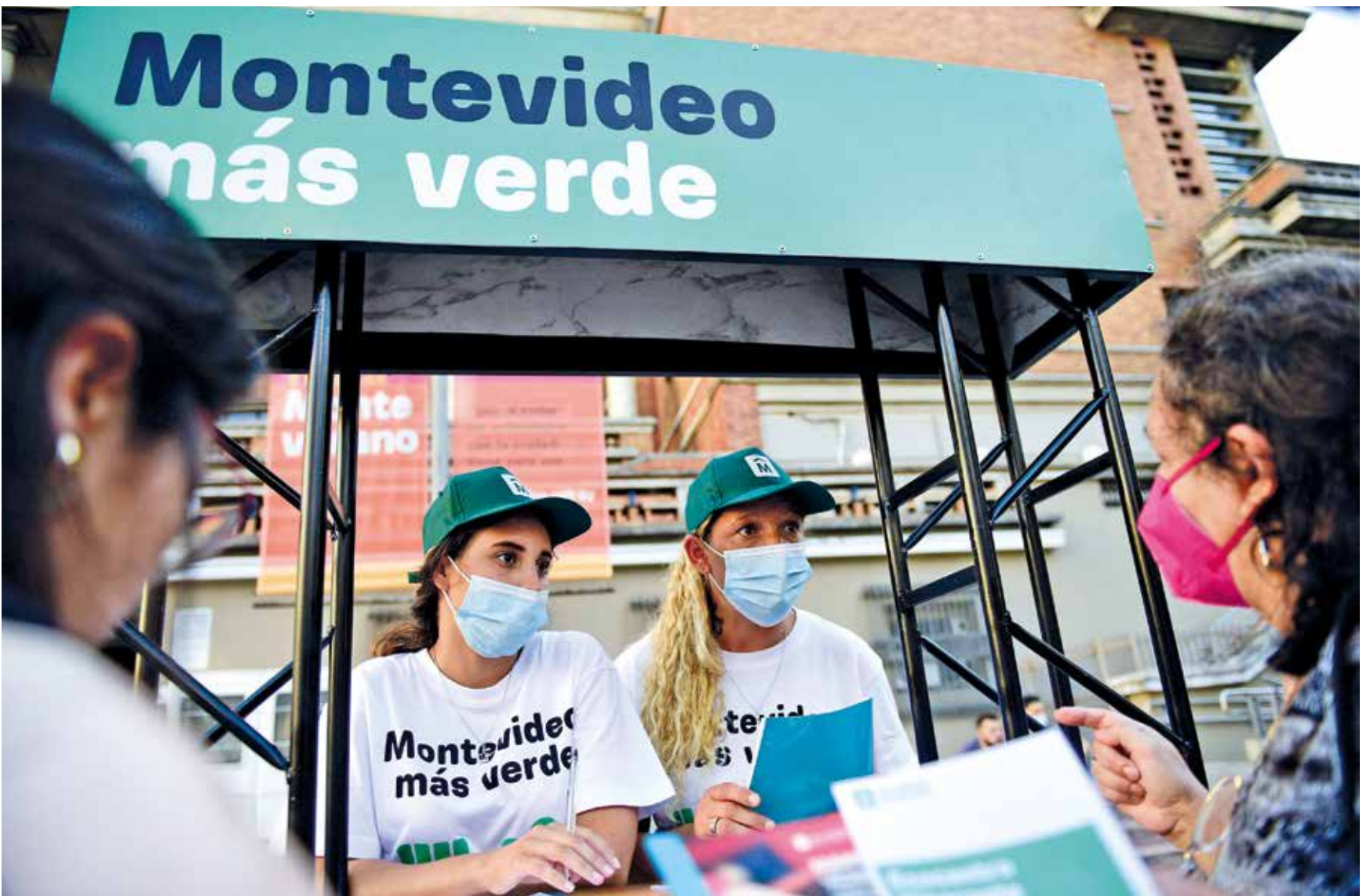
Actividad en el marco del programa Montevideo más Verde. Febrero, 2022.