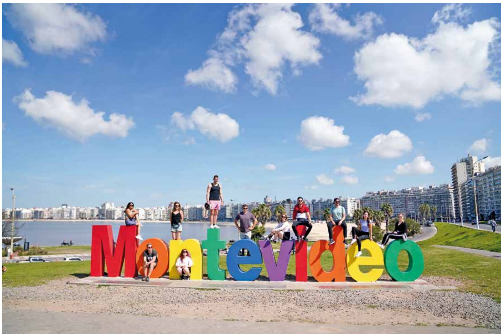
Intervención temática en el cartel de Montevideo en Kibón en el marco del Mes de la Diversidad. Setiembre, 2022.