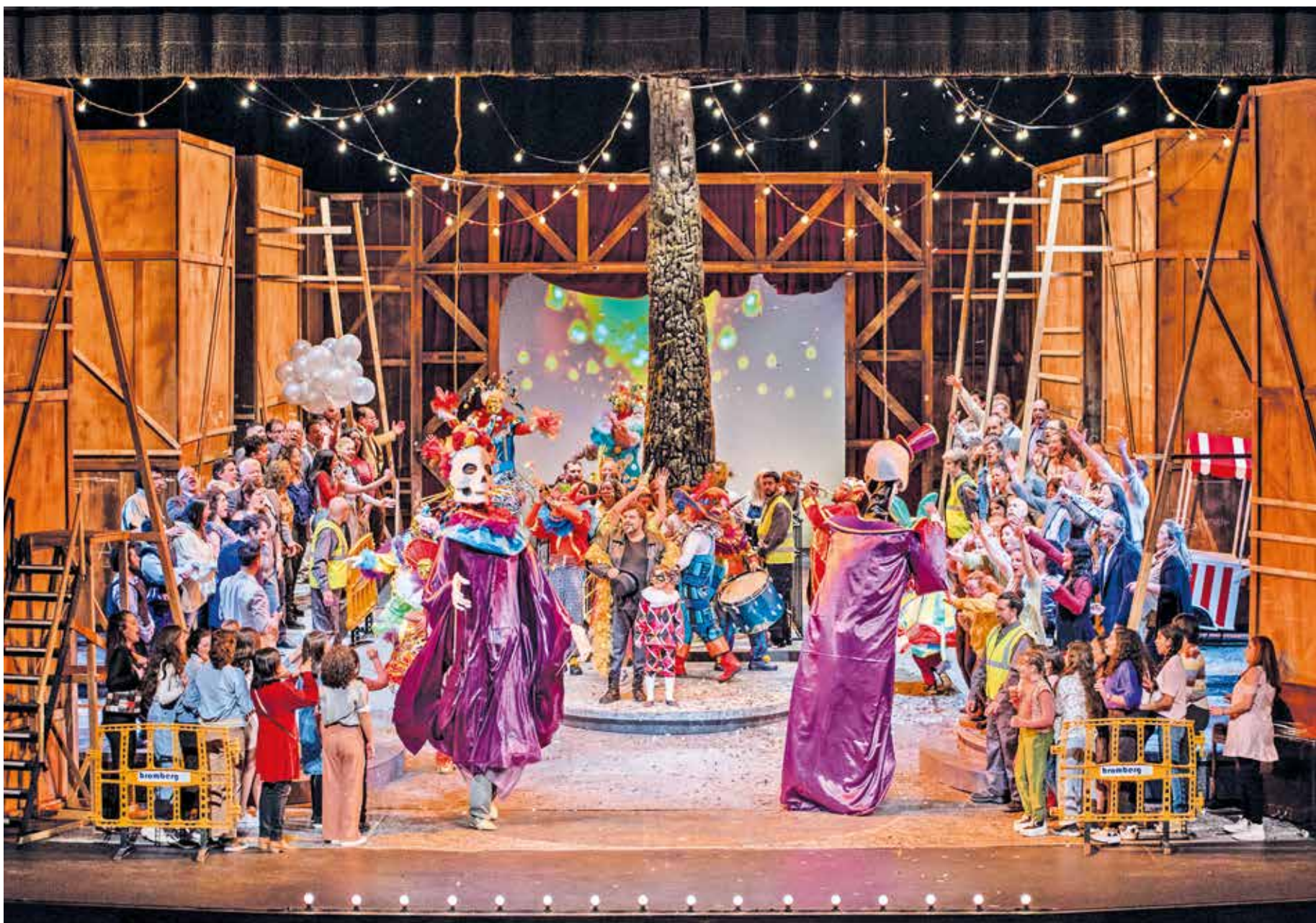
Ópera Pagliacci, 19 de agosto de 2022.

La temporada lírica se desarrolla en el teatro Solís con un éxito rotundo. Cuatro son las producciones que completan la temporada: Dido & Eneas, Camille, Una historia de Gardel, Pagliacci y La bella Helena.