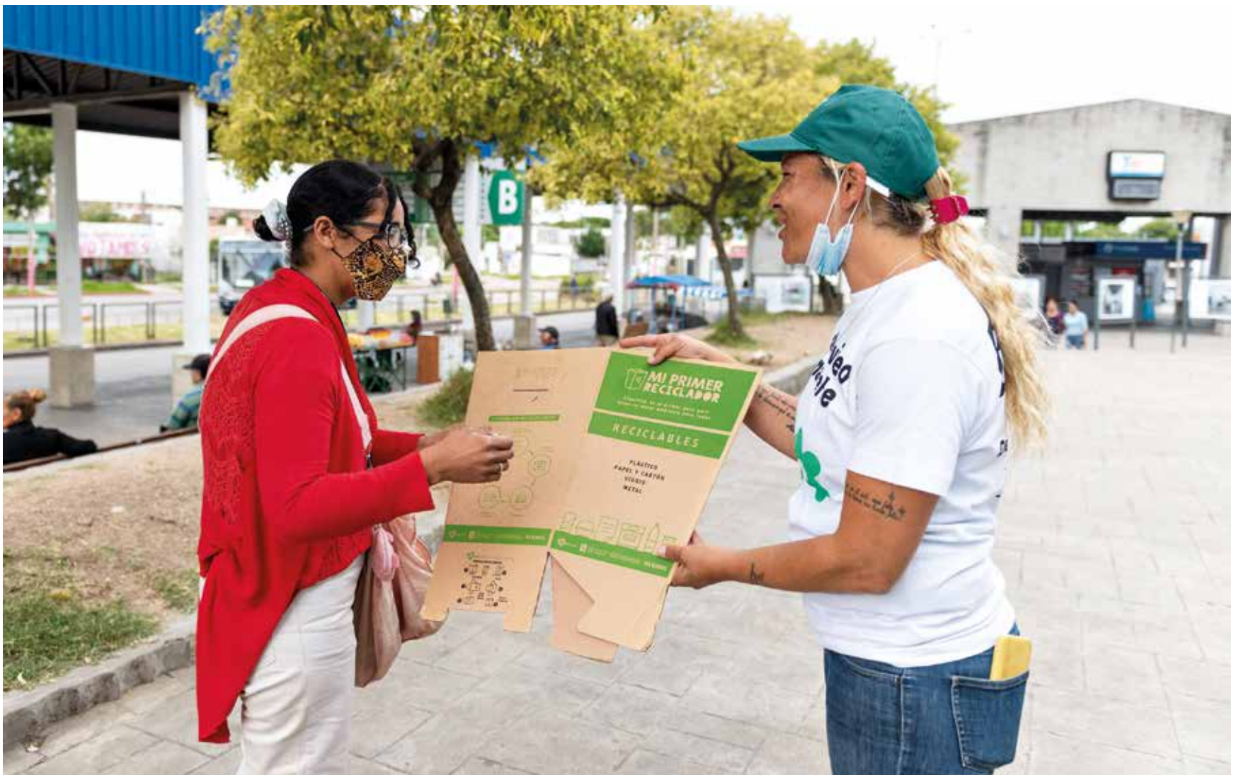
Ecocentro itinerante en la Terminal de ómnibus del Cerro. Marzo, 2022.

La IM trabaja intensamente por un gran desafío: lograr la transformación ambiental de la ciudad. Esto no requiere solo políticas públicas y obras, sino también plantar la semilla para que brote un cambio cultural en el que las vecinas y los vecinos tienen reservado un papel fundamental. “La reacción de la gente ha sido sumamente positiva”, aseguró al Semanario ABC el director de Limpieza, Ignacio Lorenzo.