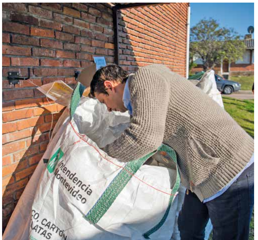
Cooperativas integrantes de la estrategia ambiental Montevideo Más Verde, 1 de agosto de 2022.