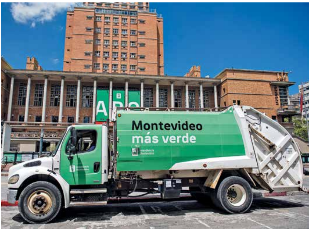
Lanzamiento del programa “Reciclando Barrio a Barrio” en la explanada de la Intendencia de Montevideo. Febrero, 2022.

Ignacio Lorenzo dio detalles de algunos de los cambios que la IM proyecta para lograr una Montevideo Más Verde: se comprarán 3.000 contenedores con un sistema que impedirá la extracción de residuos y que se arrojen en él desechos voluminosos.