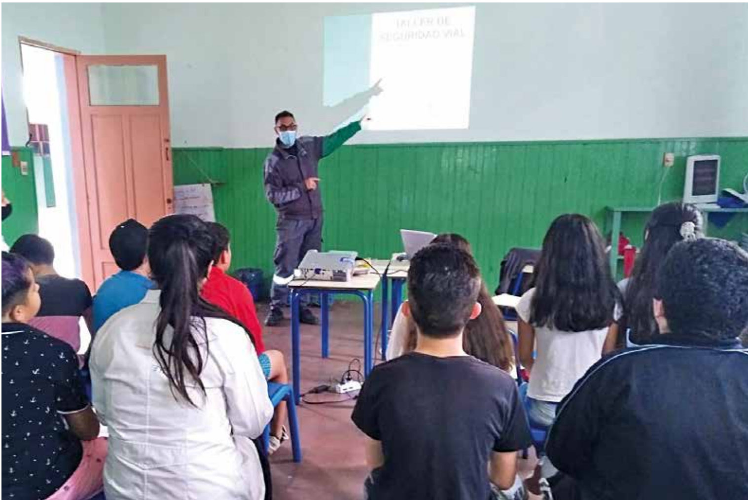
Charla de seguridad vial en la organización La Escuela, barrio Los Bulevares, 22 de octubre de 2022.

que se dictan los jueves. Pueden inscribirse personas que hayan reprobado el examen teórico dos veces.