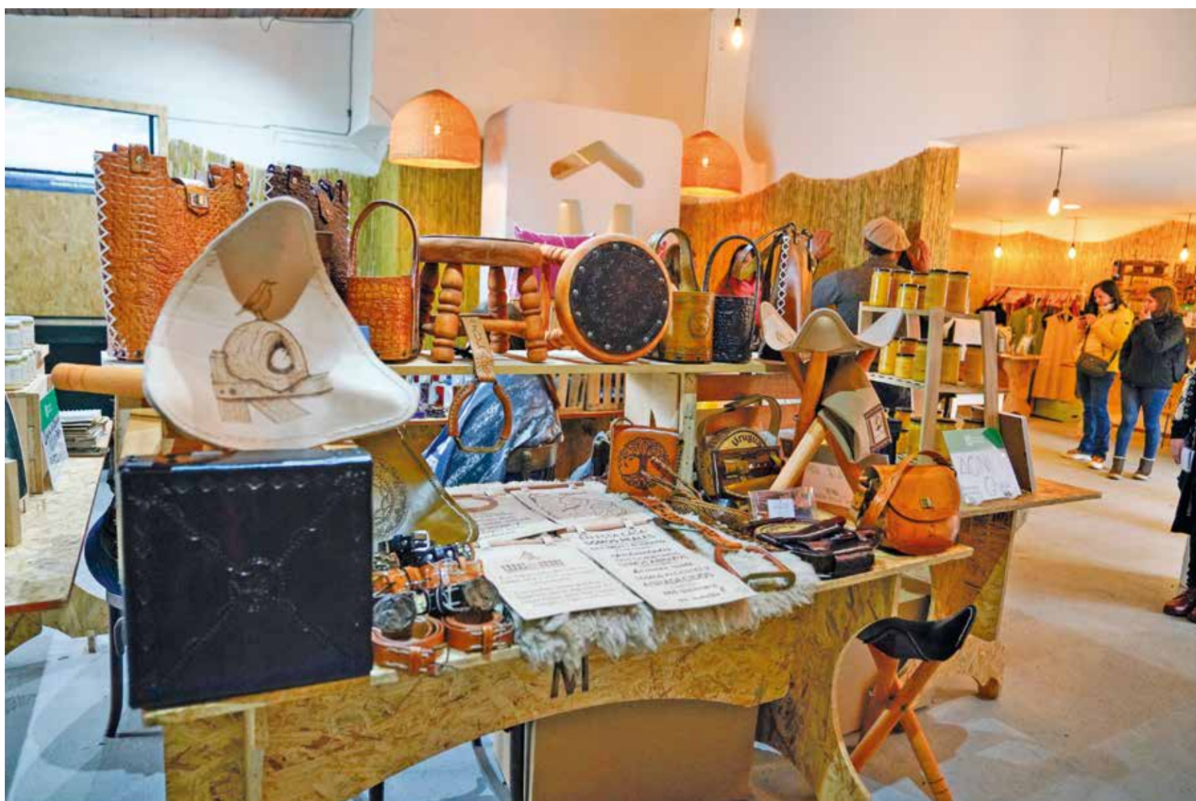
Inauguración de la Expo Prado 2022, 12 de setiembre de 2022.