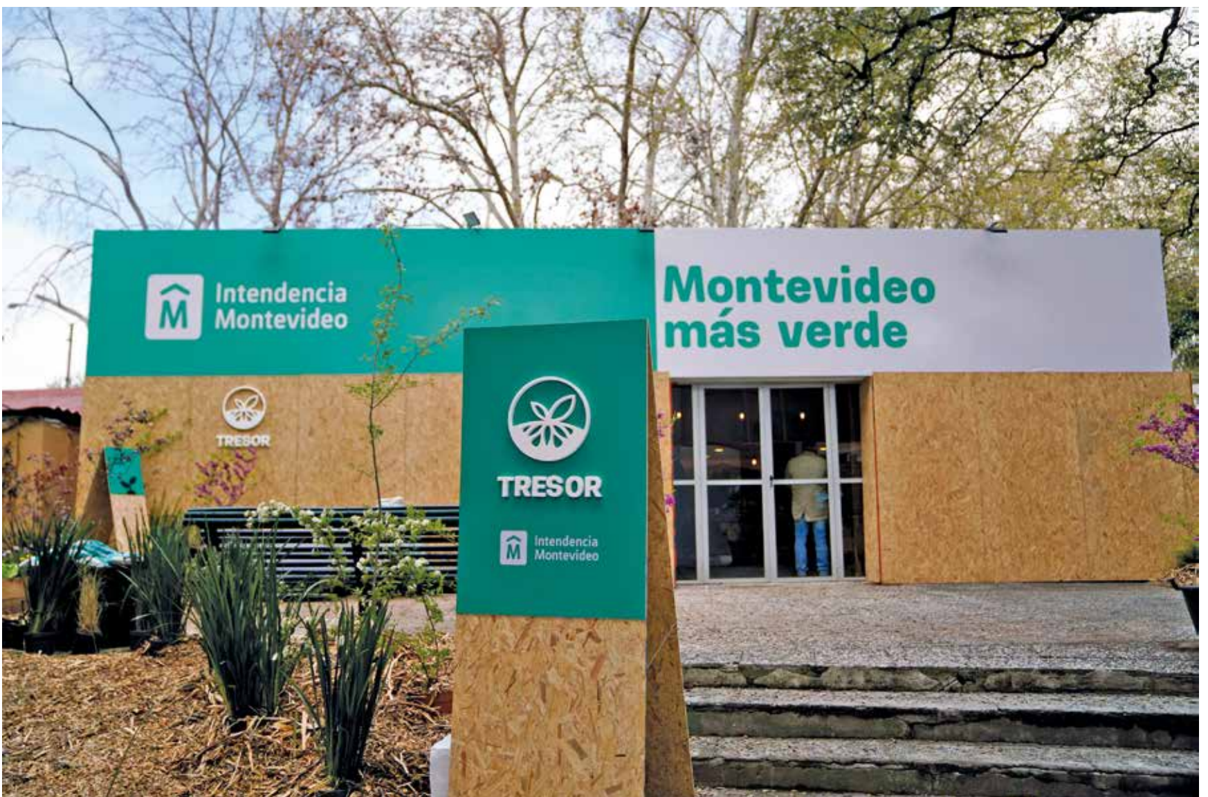
Inauguración de la Expo Prado 2022, 12 de setiembre de 2022.

Organizada por la Asociación Rural del Uruguay (ARU), la Expo Prado reúne a empresas, productores y organizaciones vinculadas al sector agroindustrial y ganadero del país.