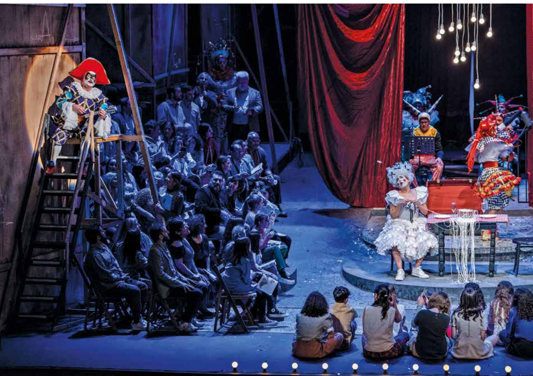
Ópera Pagliacci, 19 de agosto de 2022.

Durante el año 2022 el arte lírico se instaló en el teatro Solís con una temporada que comenzó en mayo y finalizará en diciembre. Al momento ya han transcurrido tres de las cuatro obras que se tienen previstas para el año, todas con funciones agotadas.