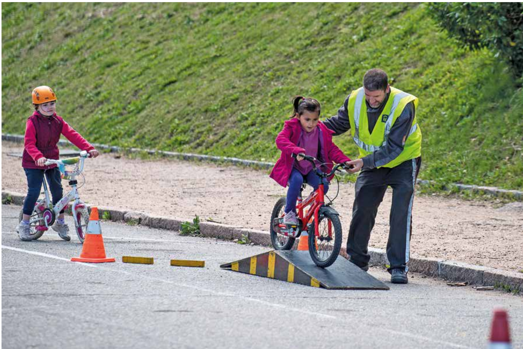
Actividad Crecé con tu bici, 4 de octubre de 2022.

El Centro de Educación Vial de la Intendencia de Montevideo es el área responsable de acercar la educación vial a toda la ciudadanía.