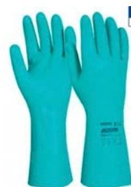
Guantes de nitrilo largos hasta el codo