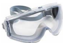
Protección facial o gafas antiempañantes