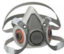
Respirador 3M Ref. 6200