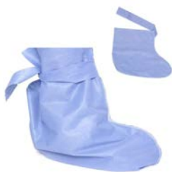
Botas impermeable de tipo industrial y cubre botas