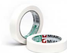
Adhesivo ancho de baja