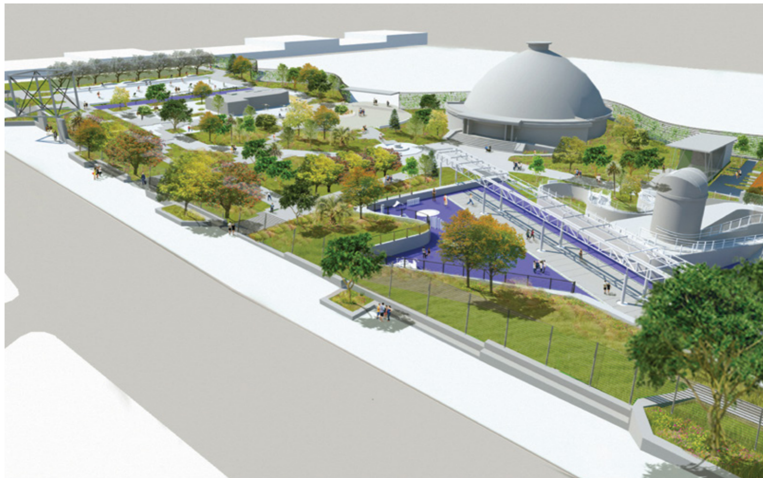
Esquema de ampliación del Parque de la Amistad

En este sentido se busca incorporar nuevos juegos accesibles e incluir diferentes dinámicas a los que ya existen en el parque. “Pensamos una nueva mirada para los juegos; por ejemplo, investigamos cómo juegan los niños en otros países para adaptarlo al Parque de la Amistad. Una cancha