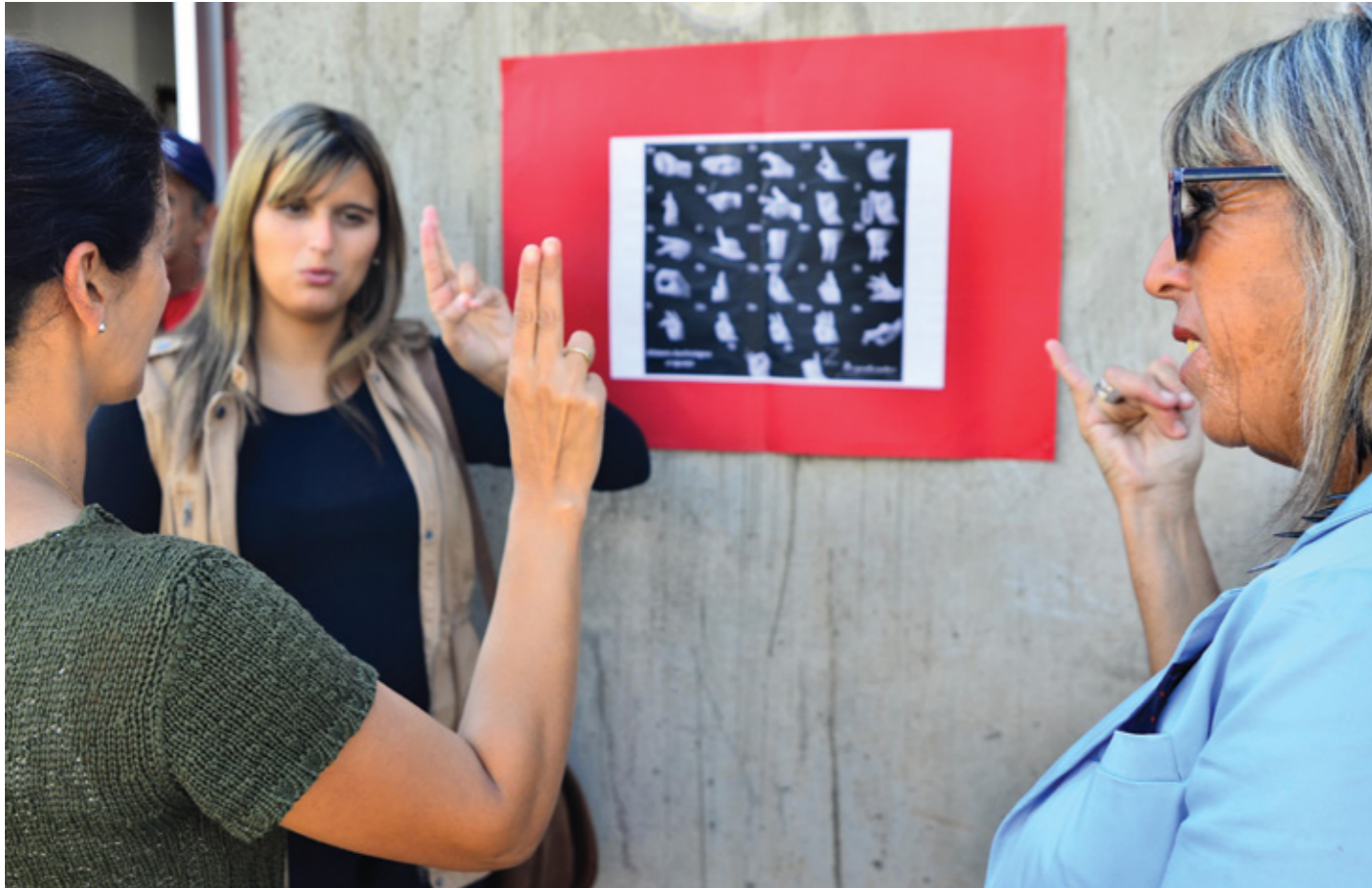
↑ Actividades por el festejo del segundo año del Parque de la Amistad.

clínica Misurraco; y los miércoles y viernes (8.00 a 14.00 h) en el Hospital Filtro. Si bien en las policlínicas se trabaja en el primer nivel de atención de salud, el equipo coordina con el segundo y tercer nivel de atención para que las personas sordas tengan una cobertura adecuada. Por ejemplo, se derivan y coordina consultas con especialistas en el Hospital Pereira Rosell, con la participación de intérpretes.