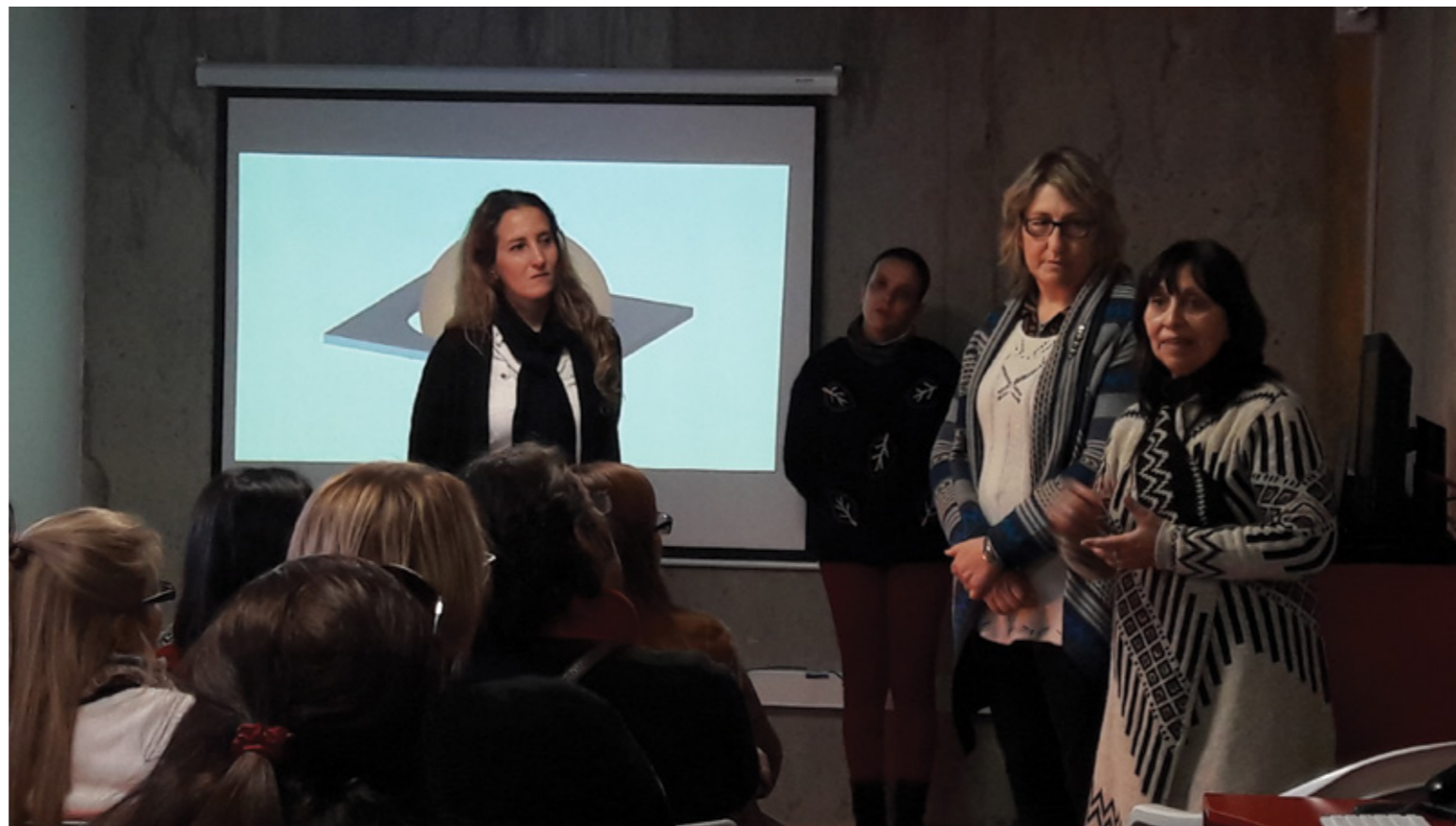
↑ Capacitación a maestros en el Parque de la Amistad.

Según Roxana Castellano, directora de Creática, los talleres se han desarrollado en torno a dos áreas fundamentales: comunicación aumentativa y acceso a la lectoescritura apoyado con pictogramas. De acuerdo con Castellano, en el primero “se habla de que existe una cantidad de personas que poseen la capacidad para expresar necesidades, pensamientos y sentimientos que muchas veces permanece oculta debido a la dificultad de expresarse verbalmente, como consecuencia de un compromiso motor, sensorial o de lenguaje que determina ausencia o déficit”. En lo que refiere a la lectoescritura, se aborda el lenguaje como herramienta fundamental tanto para la comunicación como para “transmitir conocimientos, necesidades, ideas y opiniones, [herramienta que también] permite conocer el mundo que nos rodea y establecer relaciones afectivas”, destacó la profesional.