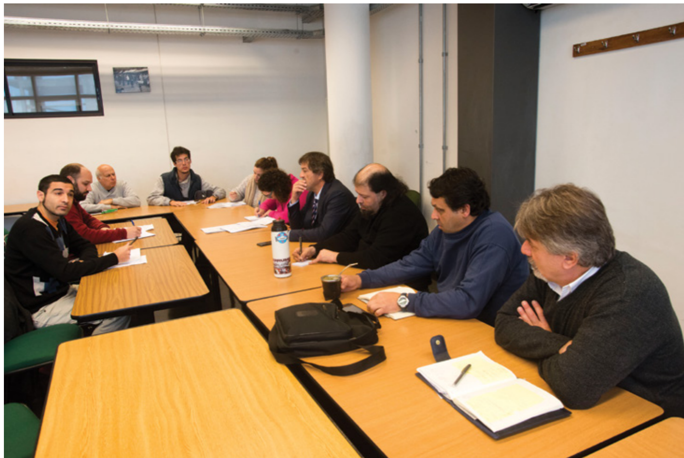
Reunión del Subgrupo Transporte Accesible, del Consejo Consultivo de Transporte Urbano de Montevideo.