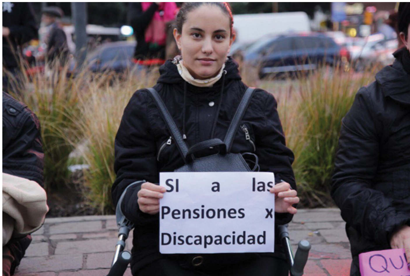
↑ Marcha contra el recorte de pensiones a personas con discapacidad, en Buenos Aires.

En junio el presidente de Argentina, Mauricio Macri, decidió recortar las pensiones a 70 mil personas con discapacidad, si bien un mes antes había presentado un Plan Nacional de Discapacidad.