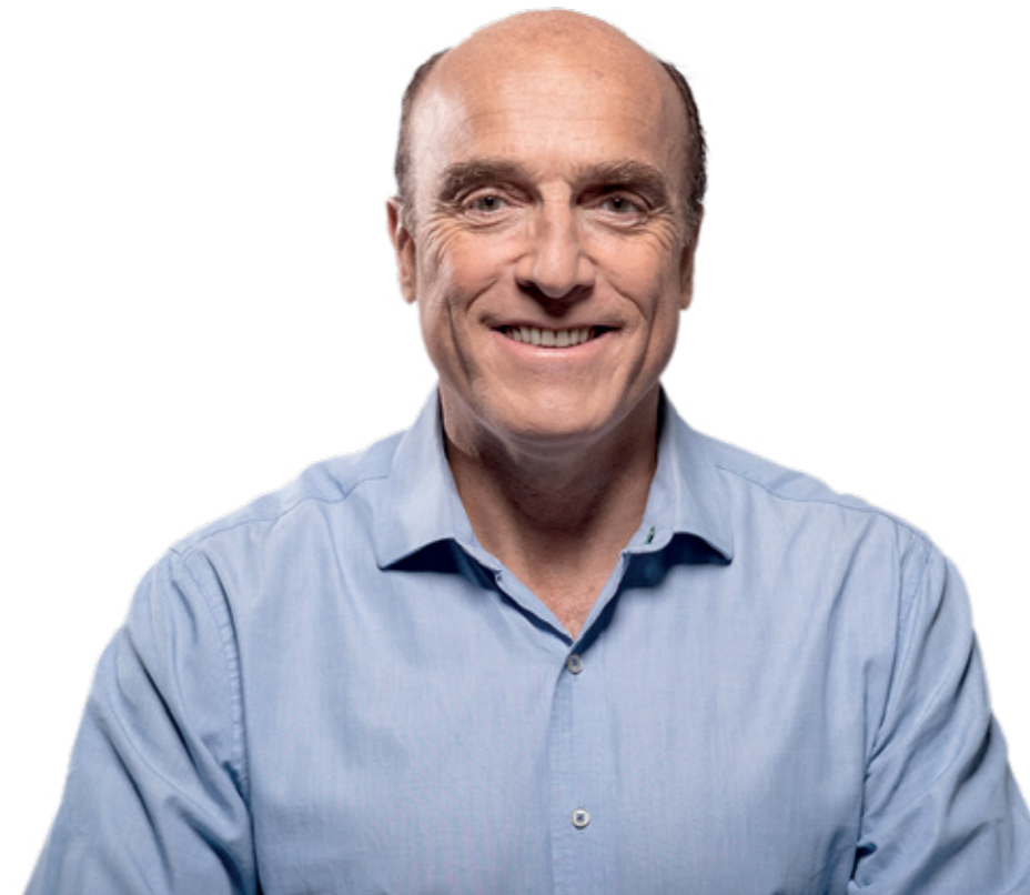
↑ Daniel Martínez

Sobre las propuestas acerca del tema discapacidad que se incluyen en el programa del FA, Martínez aseguró que las tres candidaturas se basan en el programa del FA y que no hay dos visiones sobre la temática, porque es un programa común de construcción ciudadana, que incluye a todas y todos. “Esa es una fortaleza que ningún otro partido puede mostrar. El FA cuenta con un programa nacional y departamental, sólido y claramente estructurado, pero también con una acumulación de experiencia y con una práctica de Gobierno que la ciudadanía conoce y ha valorado”, sostuvo. En ese sentido, recordó que mientras estuvo en el Gobierno una de sus mayores preocupaciones fue el cumplimiento del programa,