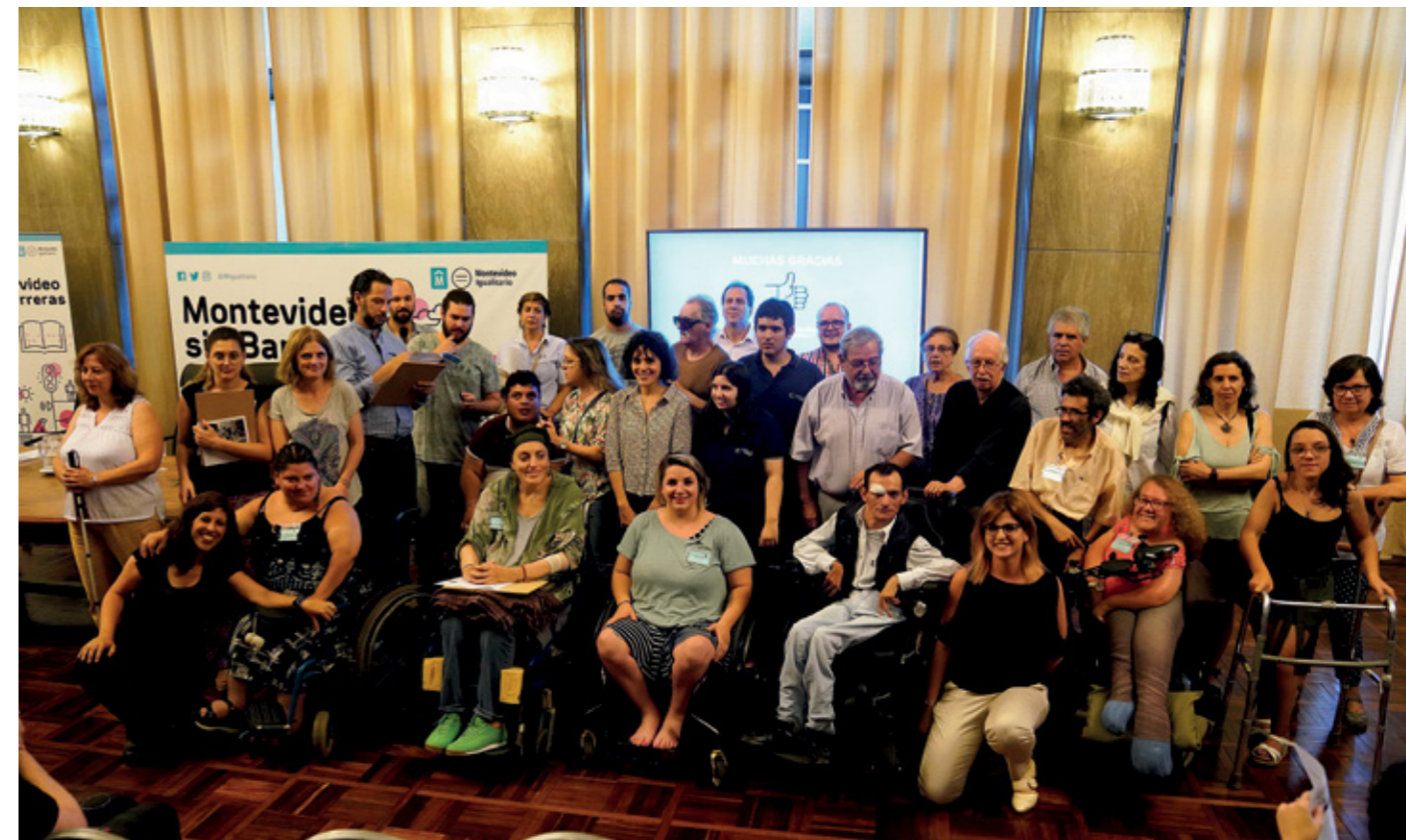
↑ Integrantes del Concejo de Participación de Personas con Discapacidad.

Tanto el Concejo como la Institución Nacional de Derechos Humanos y Defensoría del Pueblo, que ha recibido denuncias por esta situación, consideran que este cobro no corresponde