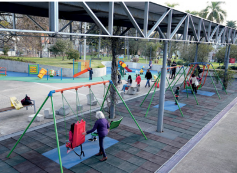
↑ Autor: Comunicación Desarrollo Social de la IM.