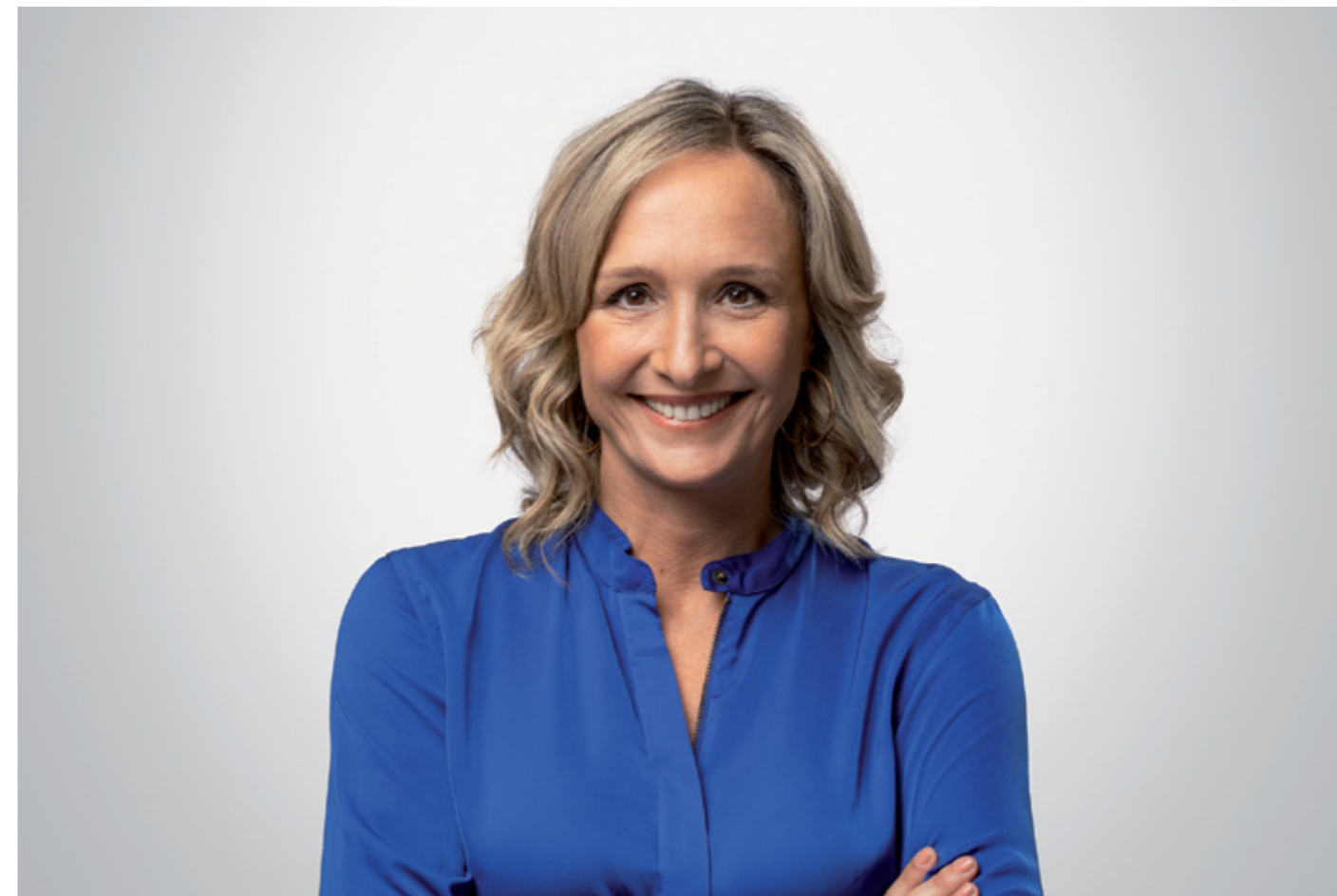
↑ Laura Raffo/Difusión.

El plan de acción para personas en situación de discapacidad que se detalla en el capítulo Montevideo para vos incluye la actualización del 1er Plan de Accesibilidad de Montevideo bajo el concepto de cadena de accesibili-