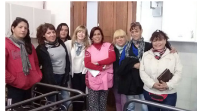
↑ Participantes del curso de asistentes personales.

Para Bruno estos dos programas buscan “visibilizar y fortalecer a diferentes colectivos de población que han tenido sus