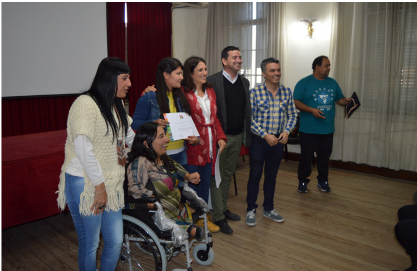
↑ Capacitación de asistentes personales.

Un grupo de mujeres trans se capacitó en la ciudad de Santa Fe, Argentina, para ser asistentes personales de personas con discapacidad.