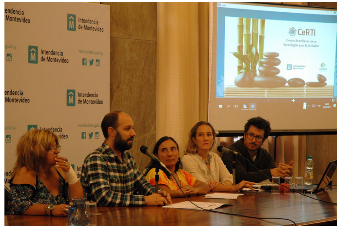
↑ AKSJdl kajjdkl jsajkdj lksajdl jsajkl jlsakdentes personales. Autor: akjsdlk jasljl kasjdl jaskdj lksajdl Isakd

Con motivo de los once años de la Convención Internacional de los Derechos de las Personas con Discapacidad de las Naciones Unidas (CDPD), se plasmó en el plan la propuesta de realizar, en el marco de la XXII Cumbre de Mercociudades en Córdoba, una mesa de intercambio so-