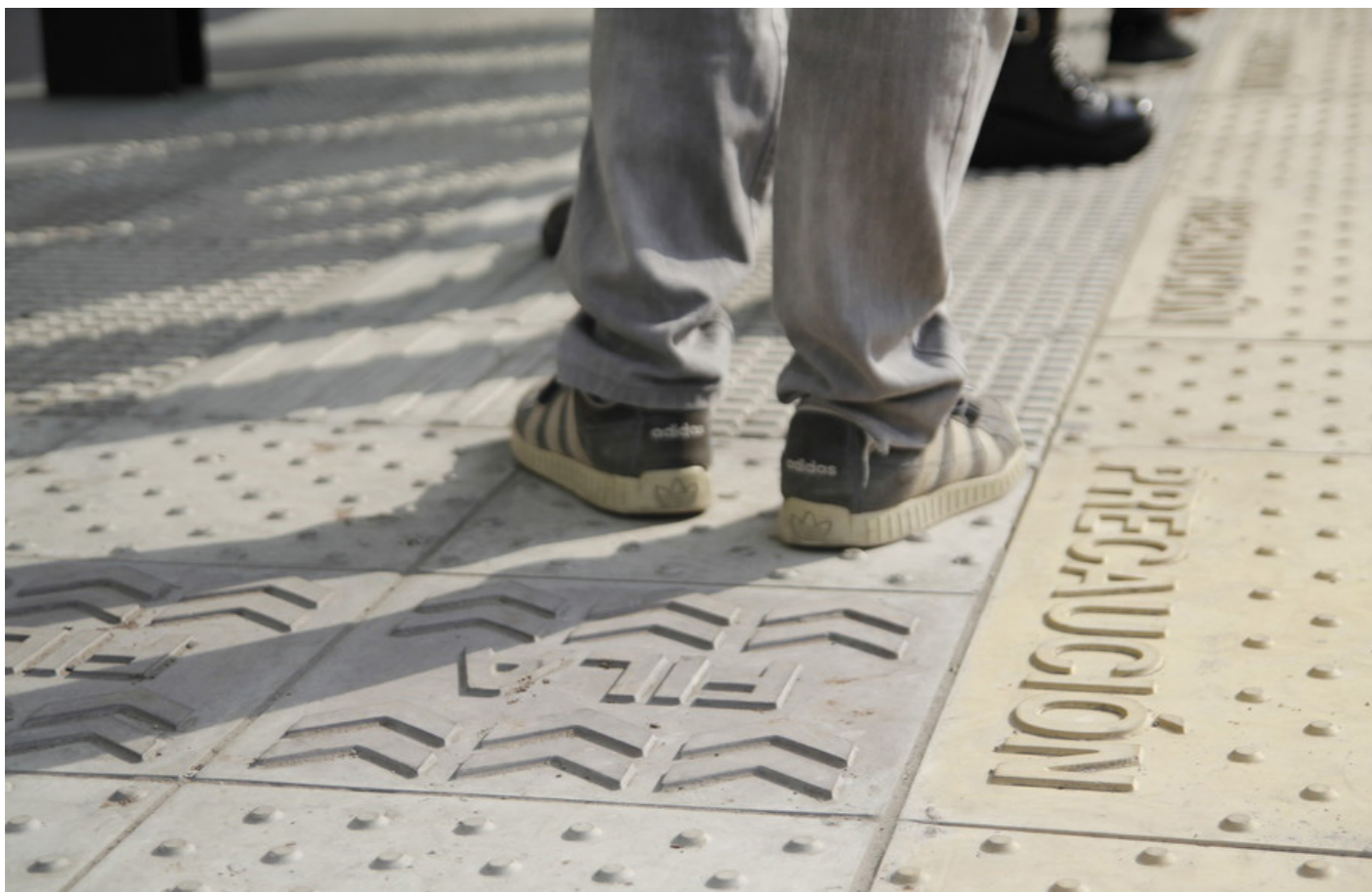
↑ Piso táctil en parada de bus en Buenos Aires: Autor: Copidis

El Ministerio de Desarrollo Urbano y Transporte proyecta y lleva adelante un programa para que el transporte público sea la mejor opción para moverse en la ciudad de Buenos Aires.