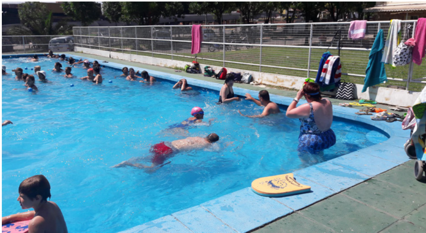
↑ Natación adaptada en la piscina municipal de Villa Carlos Paz.

La ciudad de Villa Carlos Paz, Argentina, se destacó en la temporada de verano 2016-2017 con el Programa Escuela de Natación Adaptada, un espacio de estimulación y rehabilitación para personas con discapacidad motora.