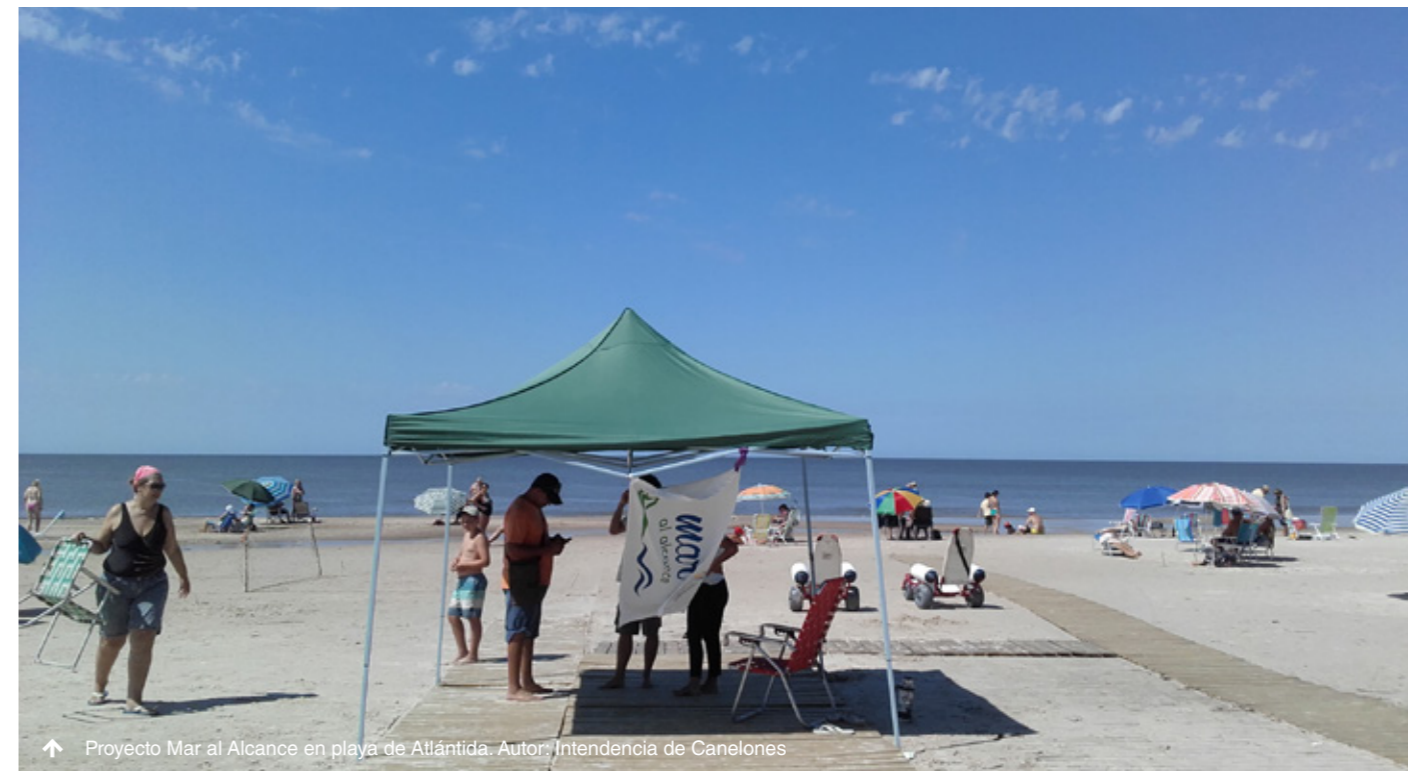
↑ Proyecto Mar al Alcance en playa de Atlántida.

Por otra parte, la comuna canaria cuenta ahora con un Taller de Ayudas Técnicas, que prevé elaborar, de cara a la temporada turística, sillas anfibas y equipamiento para que las personas con discapacidad puedan disfrutar de los sitios