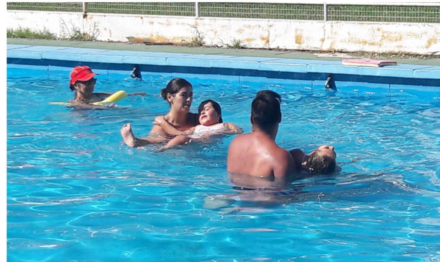
↑ Programa Escuela de Natación Adaptada en Villa Carlos Paz. Autor: Municipalidad de Villa Carlos Paz.

La ciudad de Villa Carlos Paz, Argentina, se destacó en la temporada de verano 2016-2017 con el Programa Escuela de Natación Adaptada, un espacio de estimulación y rehabilitación para personas con discapacidad motora.