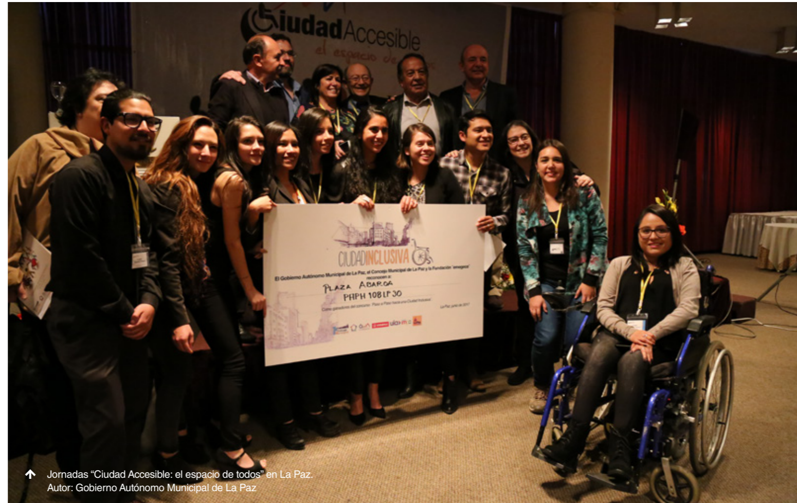
↑ Jornadas “Ciudad Accesible: el espacio de todos” en La Paz.

Los representantes de la UCCI compartieron sus experiencias y conocimientos y acordaron que impulsarán juntos la implementación de una cultura de accesibilidad, que implique mirar más allá de la eliminación de las barreras arquitectónicas que aún existen en las ciudades. Así como poder desvincular el concepto de accesibilidad de su connotación ligada a la discapacidad y asociarlo a la construcción de ciudades para todos, espacios libres de discriminación en el que la inclusión