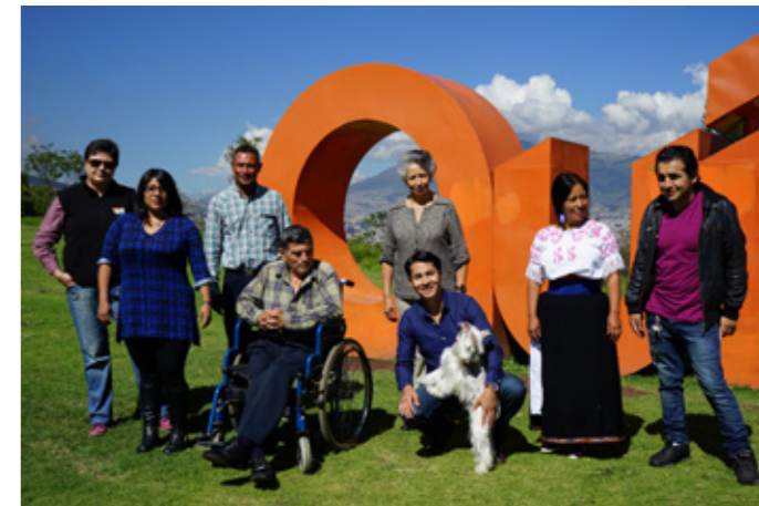
↑ El Municipio del Distrito Metropolitano de Quito apuesta por la diversidad. Autor: Secretaría de Inclusión

Quienes reciben el sello acceden a capacitaciones, son incluidos en una guía de establecimientos turísticos y destacados en el portal de la empresa de turismo de Quito. Tras obtenerlo, los establecimientos pueden utilizar el sello de Quito, Ciudad Inclusiva en sus comunicaciones. El objetivo es que los consumidores o