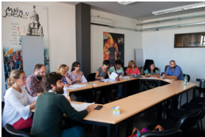
↑ AKsijdl kasjldk lsad personales.

Durante este año se formalizó el contacto y acuerdo con la Cooperativa Rampita para poder concretarlo. En diciembre, en el marco de un nuevo encuentro del grupo, se definirá cuáles son las ciudades que van a participar de esta iniciativa.