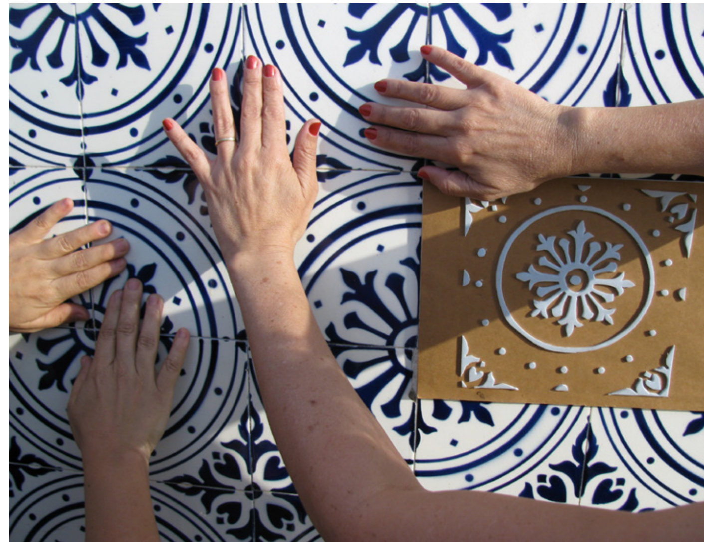
↑ Maquetas en relieve con diseños de azulejos.

Además de la arquitectura se exploraron otras temáticas, como los jardines proyectados por Roberto Burle Marx y el tacto; también se trabajó con otros sentidos, como la audición, en la edición Pampulha Sonora y con el gusto, donde la propuesta fue literalmente degustar un jardín. Este almuerzo especial fue titulado: Arquitectura de los sentidos: visita táctil degustativa y se seleccionaron, con ayuda de especialistas, las plantas del jardín que fueran comestibles, como es el caso de la trapoeraba ( Commelina ), el tubérculo taro y el lirio, con las cuales se preparó el menú a degustar por el público. Según Gonçalves Campos, estas actividades llevadas adelante dentro del órgano gestor de la cultura de la ciudad de Belo Horizonte “traen un avance en las discusiones y acciones que van a garantizar el acceso a la cultura, un derecho humano ampliamente reconocido”.