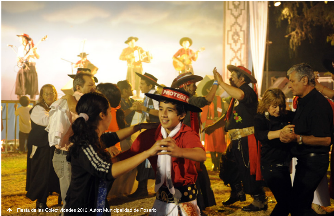
↑ Fiesta de las Colectividades 2016.

La Fiesta de las Colectividades de la ciudad de Rosario, Argentina, inaugura en esta edición nuevas características de adaptabilidad y accesibilidad que garantizan la participación de personas en situación de discapacidad en la Fiesta de las Colectividades de la ciudad de Rosario.