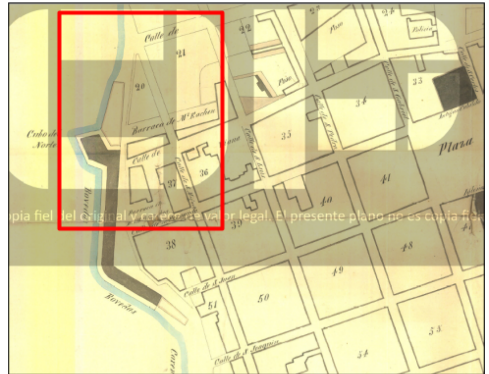
Figura 2: Plano Topográfico de la ciudad de Montevideo de 1829, realizado por José María Reyes. En rojo área de interés.

Teniendo en cuenta la relevancia patrimonial del bien cultural objeto, en tanto sus valores testimoniales, históricos, culturales, arqueológicos, arquitectónicos y tecnológicos, sumado a su especificidad y singularidad como entidad colonial relacionada a la defensa de la plaza fuerte; se hace necesario implementar medidas enmarcadas en un accionar preventivo que garanticen su conservación para el conocimiento, puesta en valor y disfrute de las generaciones actuales y venideras.