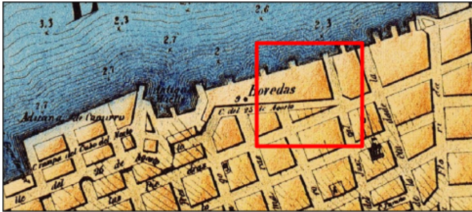
Figura 3: Plano de Montevideo hacia 1865, realizado por Neumayer. En rojo área de interés.

En ninguno de los casos anteriores, los hallazgos de objetos y/o construcciones históricas, deben sufrir deterioro y deberán ser considerados como un bien finito.