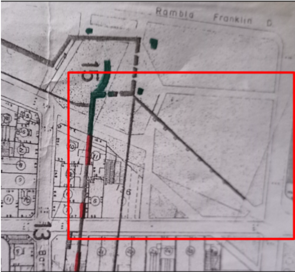
Figura 4: Plano de la superposición del frente de tierra sobre padronario urbano; realizada por el Esc. R. Baroffio Burastero. En rojo área de interés.